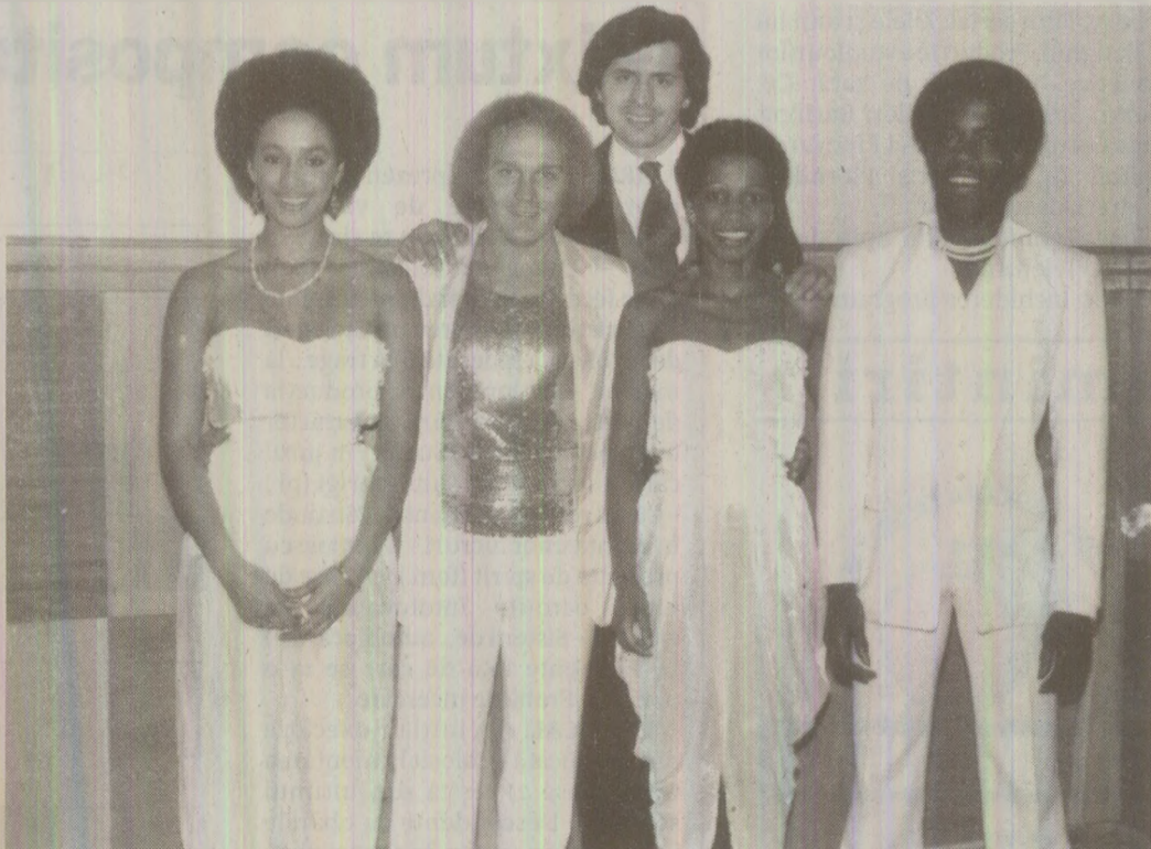
Goombay Dance Band a concertat în 1989, la Sala Polivalentă din București, într-un spectacol prezentat de Tavi Ursulescu

Mi-a stat inima în loc, emisiunea nu s-a mai reluat, deci nu fusese vorba despre o defecțiune tehnică, folclorul respectiv făcând parte din așazia... „mapă de rezervă” pregătită pentru situații-limită. L-am sunat pe Titus – și el era la fel de îngrijorat ca și mine, ca să nu zică de-a dreptul speriat, căci el, ca angajat al TVR, cunoștea perfect faptul că doar două persoane puteau interrompe în acest mod transmisia. Vă dați seama că n-am dormit nici unul dintre noi în acea noapte, iar a doua zi ni s-a confirmat ceea ce bănuiam: telefonul întempestiv venise de la Cabinetul 2, Elena Ceaușescu monitorizând în mod obișnuit ce se petrecea pe micul ecran, cu atât mai mult cu cât nu avea mult de „lucru” între orele 20:00 - 22:00. Fusese scandalizată de-a dreptul de „indecența dansatoarelor”!!! În zilele următoare am stat ca pe ghimpi, nici nu am ieșit din casă, așteptând să fiu săltat și anchetat. Din fericire, după cum