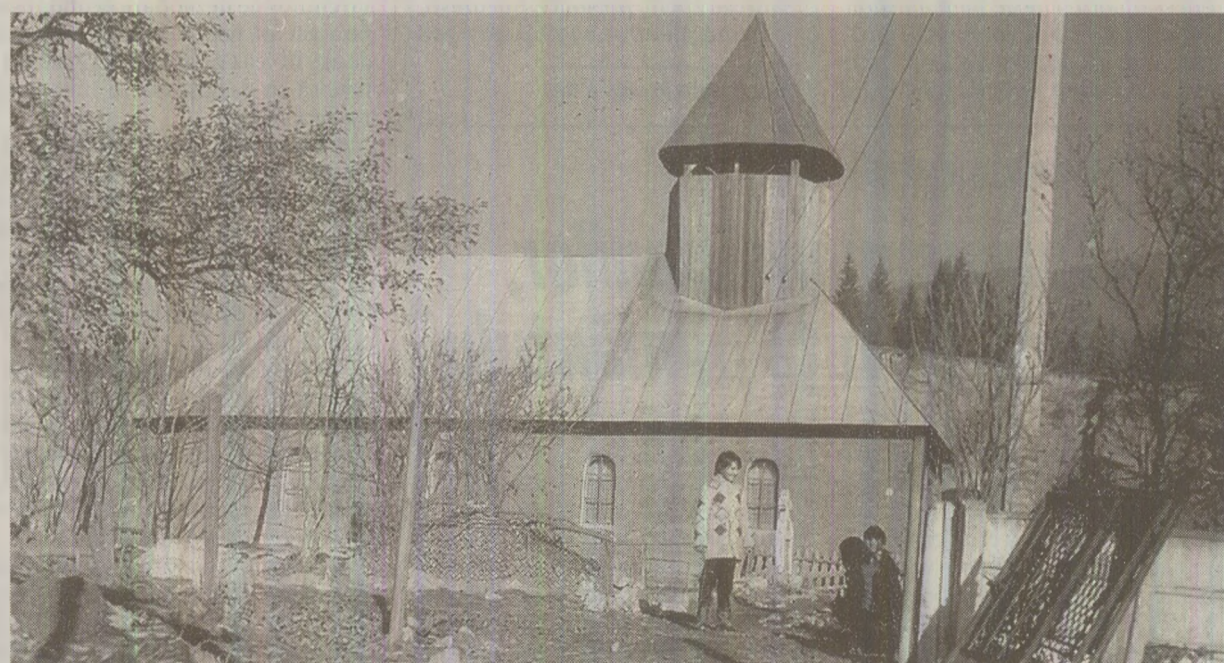
Biserica din satul Câmpu lui Neag, veche de 120 de ani, a fost demolată, împreună cu alte 39 de construcții, pentru un proiect care viza extragerea hulei în regim de carieră

Aici e casa părintească. Aveam verandă închisă unde mă jucam, un castan mare în fața casei și fântână. În curte era mereu curat, că nu aveam voie să lăsăm găinile să intre. Tata, când a văzut că toată munca lui de-o viață s-a distrus și când a văzut pământul răscolit unde a fost îngropat fratele meu, s-a dus în pădure să se spânzure. Frațele meu fusese înmormântat cu un an înainte și mai avea jumătate de obraz când l-au dezgropat.