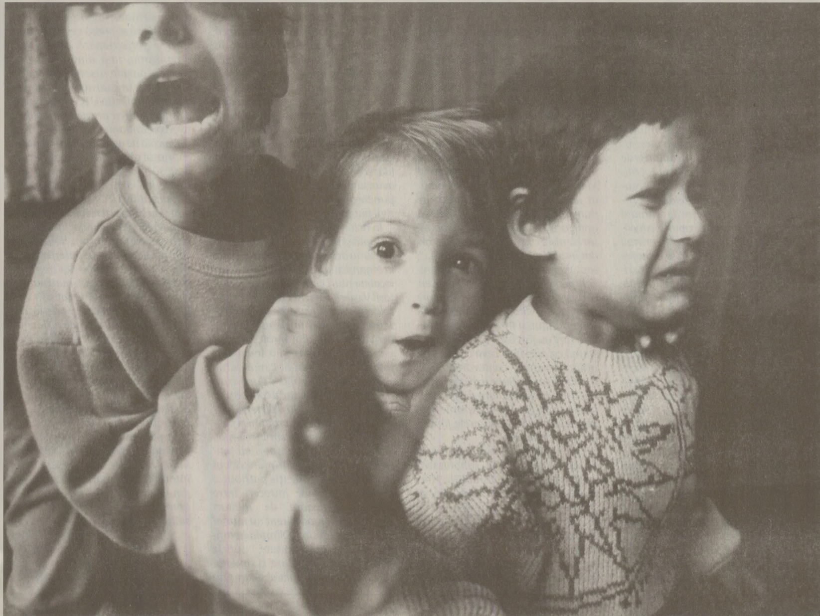
La începutul lui 1989, jumătate dintre copiii aflați în orfelinatele din județul Constanța erau infectați cu HIV.

Încă din 1988 au început să moară copii. Mulți, mult mai mulți decât în anii precedenți. În luna martie, în județul Constanța au murit 88 de sugari. Din vina medicilor, s-a spus atunci. Și tot așa, decese au continuat. Câte două, trei cruci pe zi se ridicau din țărâna rece la căpătâiul copișailor.