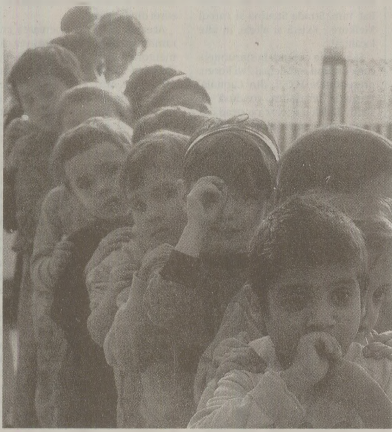
SIDA era în 1989 puțin cunoscută chiar și de specialiștii în boli infecțioase

Din același motiv, în '89 n-am putut ține o evidență a copiilor diagnosticați cu HIV decât de la începutul lunii decembrie, când am înființat «caietul negru», pentru că deja fuseseră și în continuare erau mult prea mulți. Boala ucidea, dar nu exista. Cam așa a fost din mai '89 până-n ianuarie '90, când ne-am trezit că... nu numai că veneau foarte mulți copii și eram asaltați de acest fapt, dar ne-am trezit cu ziarști din toată