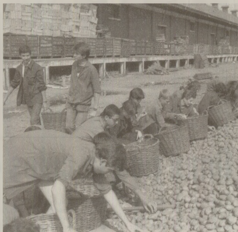
Elevul sau studentul era supravegheat la practica agricolă de profesori, asistenți și angajați ai fermei.

După câțiva kilometri, un echipaj de Militiție a oprit autobuzul. Stăteam lângă șofer și nu văzusem să fi făcut vreo prostie. Rabla nu putea fugi, tabla îi scărșnea mai să se imprăstie, în plus, șoseaua era goală. Șoferul mi-a șoptit că l-a oprit pentru controlul sacozelor, pentru copii. Nu pricepeam. Un milițian s-a apropiat de ușă, a dat bună ziua tovarășelor profesoare, a întrebat dacă are cineva cartofi în sacoze, copiii au răspuns în cor: Nuuuu! Cu ce se ocupa Militiția! După cinci kilometri, al filtru. Același ritual. Înainte de intrarea în Brașov, înaintea unei benzinării, al treilea filtru. Aștia erau porniți rău de tot. În vreo 15 kilometri, trei filtre. Un milițian uscat și plictisit s-a urcat în autobuz și făra prea multe vorbe a răsturnat sacozele copiilor pe podeaua autobuzului. Din trei au căzut câțiva cartofi, patru din prima, câte trei din celelalte două. Zece cartofi. Vreo două chile. S-a lăsat tăcerea. Profesorarele au reacționat diferit. Una tăcea, privind speriată. Cealaltă era violentă: Asta e furt! Sunteți niște hoști! S-a înfipt în amărâtul ăla cu patru cartofi întrebându-l idiot! Ce faci, mă, cu cartofii? ăla începu să plângă, spunând printre sughițuri că i-a zis mamică-să să aducă și el trei-patru