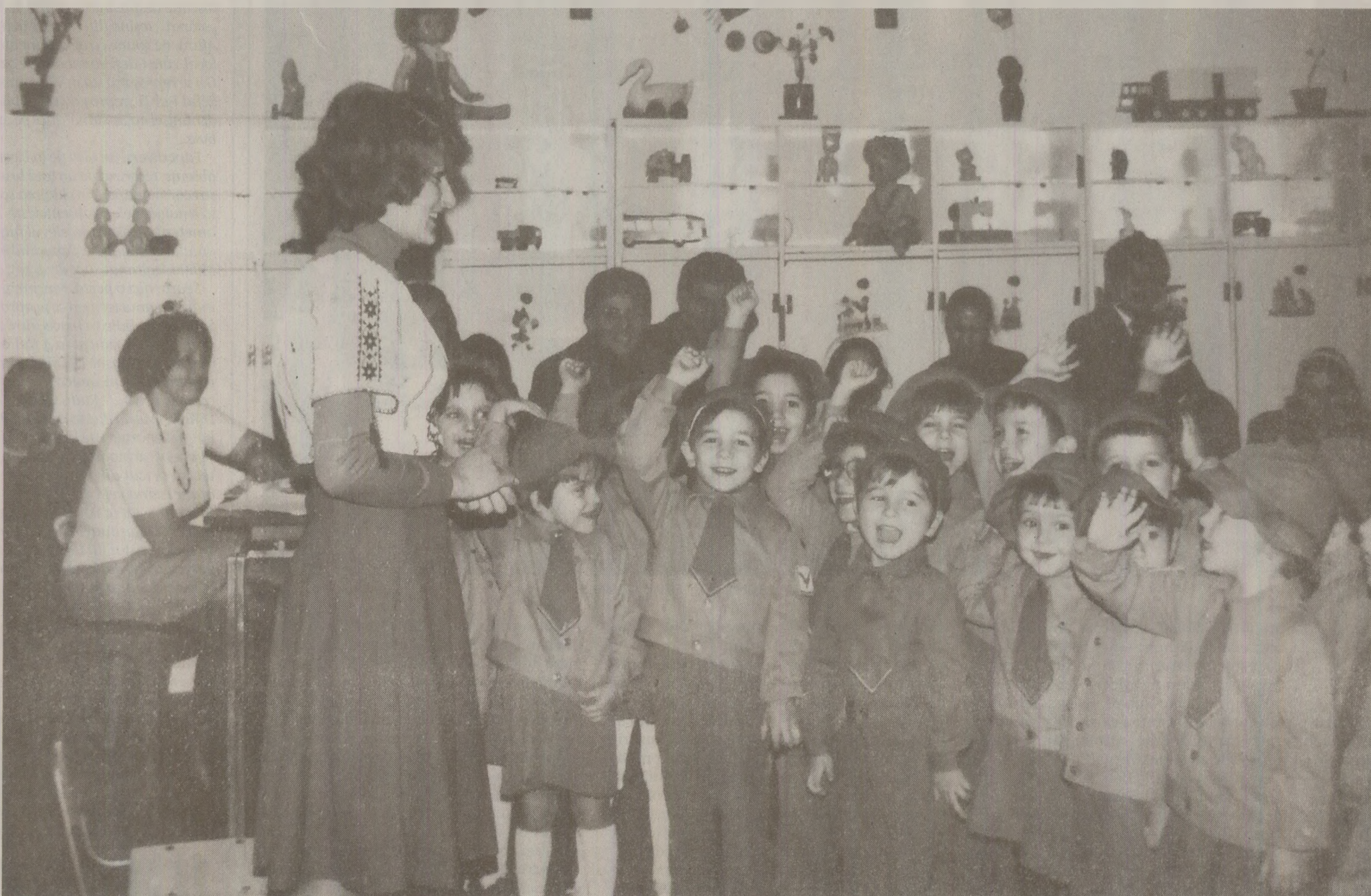
„Eu, Șoim al Patriei, mă angajez./ Poporul credință să-i păstrez./ Să fiu cinstit și drept; oricând/ Să apăr și să cânt acest pământ.”

Prin diverse activități, se urmăreau învățarea și înțelegerea de micii „șoimi” a unor cunoștințe despre „patrie, partid, popor, oamenii muncii și realizările deosebite din țara noastră în anii socialismului, cunoașterea Imnului de Stat al Repu-