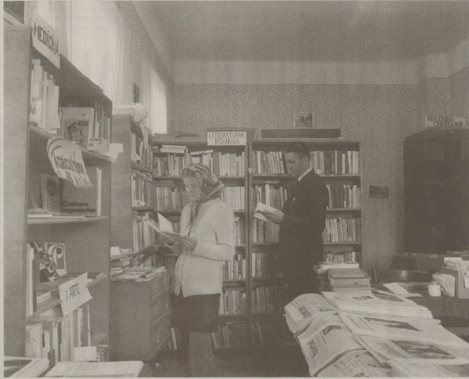
Satele aveau cămine culturale și biblioteci