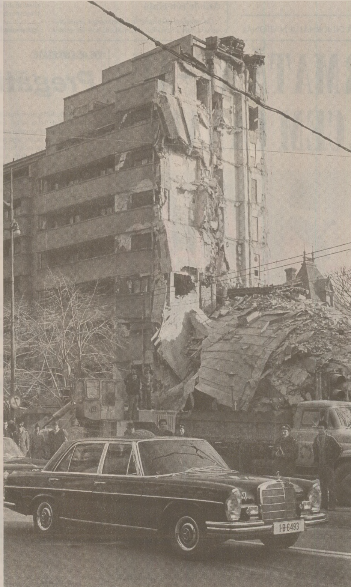
După cutremur, Elena Ceaușescu (pe bancheta din spate), despre care se zvonca că i-ar fi murit o nepoată, a apărut pentru prima dată în ipostaza de „prima femeie a țării”.