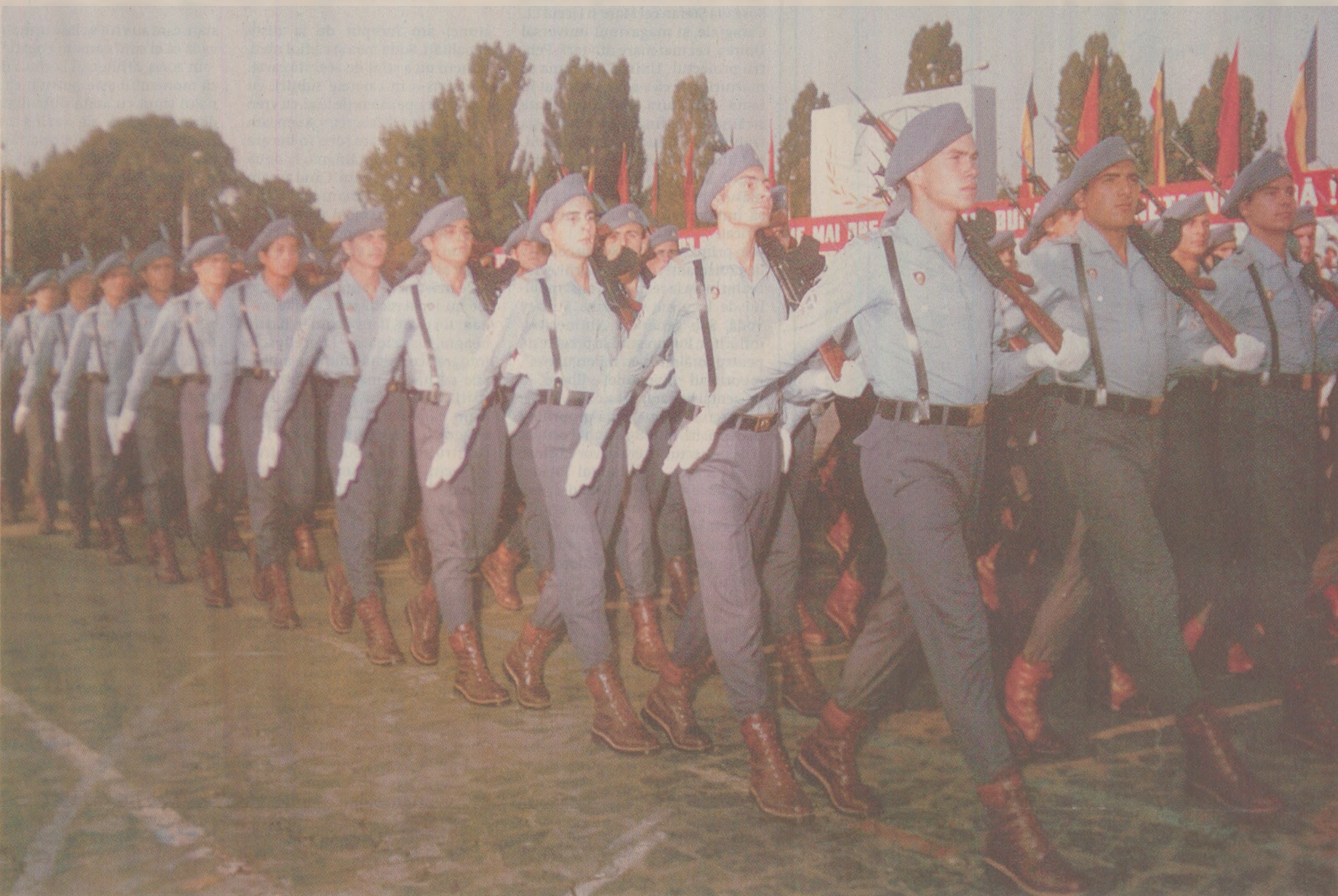
„Avem o țară, o datorie/Si-o misiune de veacuri de îndeplinit/Duşmanii țării și ei să știe/Că suntem stăncă de granit“

„În armată am intrat în ziua de marți, 13 septembrie 1988 și am intrat în rezervă în 10 februarie 1990. Nu mai știu ce zi a săptămânii era când am ieșit din armată. Ziua intrării în armată mi-o amintesc, dar nu mai știu de ce mi-o amintesc, mi-o amintesc și gata. N-am fost tocmai o generație norocoasă. Semăna foarte mult cu descrierile din „O zi din viața lui Ivan Denisovič“, cu singura deosebire că la noi mai puteai să sari gardul să te duci în oraș și puteai să mănânci cât voiai. Asta, bineînțeles, dacă-ți plăcea mănăncarea. Un an jumate, cât am stat în armată, am mâncat patru feluri de mâncare: cartofi, varză, fasole și