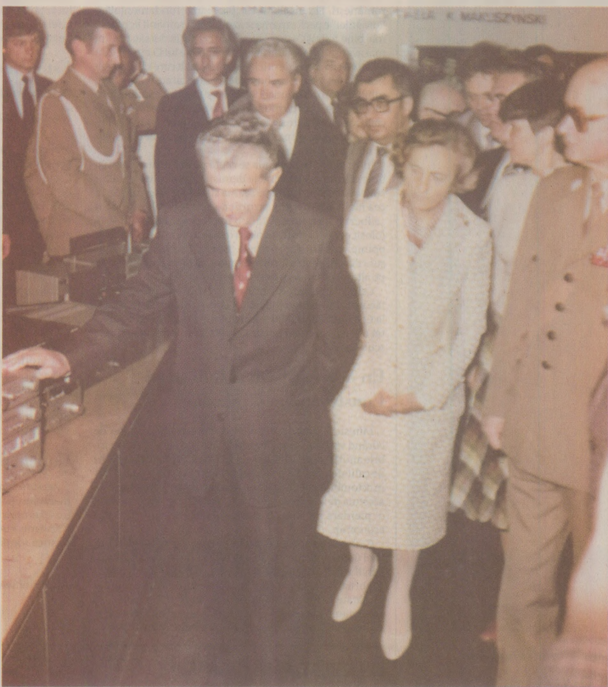
Ideea lui Ceaușescu, de a se fura și copia utilaje și tehnologii de fabricație străine, și-a găsit aplicarea mai ales în industria de apărare

Ca urmare a reducerii semnificative a deficitului comercial al Ro-