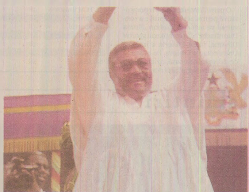
Cu ocazia zilei naționale a Republicii Ghana, Ceaușescu a trimis o telegramă de felicitare lui Jerry John Rawlings, șeful statului african