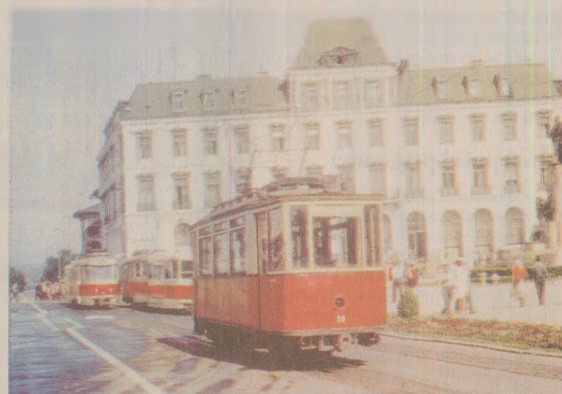
La începutul lui '89, pentru unii ieșeni orașul lor nu mai era „dulcele târg”, ci un oraș sinistru și sufocant.