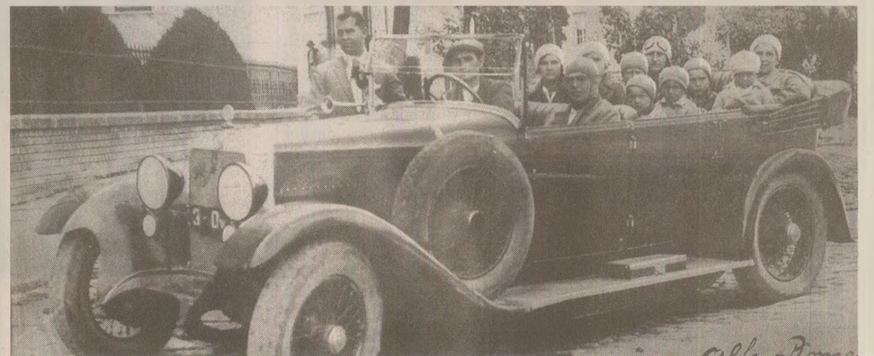
Înainte de '89, nu se mai spunea că „tovarășul de drum” Petru Groza fusese un om bogat