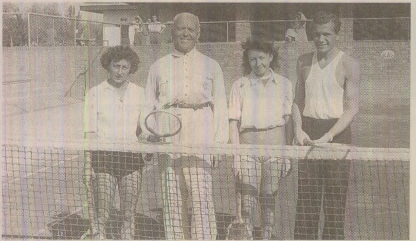
La 6 martie se împlinseau 44 de ani de când Petru Groza (al doilea din stânga), zis „burghezul roșu” din cauza preocupărilor sale excentrice, devenise prim-ministru.