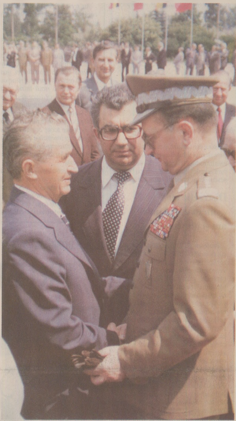
În martie 1981, Wojciech Jaruzelski (foto dreapta) a anunțat că Polonia nu mai poate plăti datoria externă. Pentru că România să nu ajungă în aceeași situație, Ceaușescu a decis să ramburseze toate datoriile în avans.