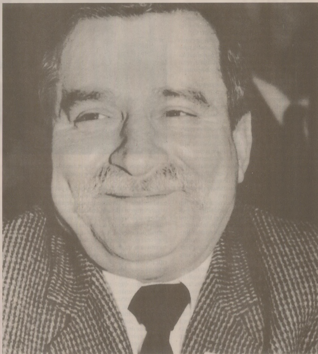
Lech Walesa, lider al opoziției poloneze care negocia în acele zile cu guvernul de la Varșovia, a protestat în mai multe rânduri împotriva încălcării drepturilor omului în România.

Încălcarea drepturilor omului de către România nu a fost denunțată doar de autoritățile maghiare, care au vorbit deschis de multă vreme despre politica liderului PCR, Nicolae Ceaușescu. Critica vine și de la grupuri independente din Polonia și Cehoslovacia. O a doua demonstrație, în doar o săptămână, a avut loc la Varșovia, la începutul lui februarie. A fost organizată de membri ai ilegalistului Partid Socialist Solidaritatea și s-a încheiat în fața Ambasadei României, unde participanții au strigat sloganuri împotriva lui Ceaușescu și au împărțit fluturași care conțineau critici la adresa lui. Aproximativ 20 de demonstranți au fost reținuți de Poliție. La 7 februarie, Lech Walesa și alți cinci activiști ai Solidarității au semnat o scrisoare deschisă, adresată lui Ceaușescu, în care îi cereau acestuia să pună capăt hărțuirii Doinei Cornea, fapt care, spun ei, lezează „drepturile elementare ale omului într-o lume civilizată”.