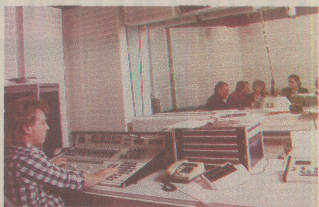
„Pentru scurtă vreme și cu mult timp în urmă, jurnalistul american William Pfaff, contactat de Silviu Brucan pentru a-i înmăna scrisoarea, lucrase în redacția Radio Europa Liberă de la New York