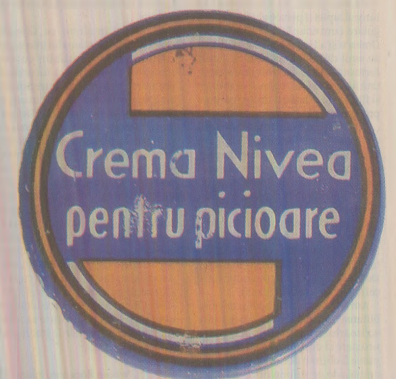
Crema pentru picioare Nivea nu putea lipsi din „arsenalul” unei femei îngrijite