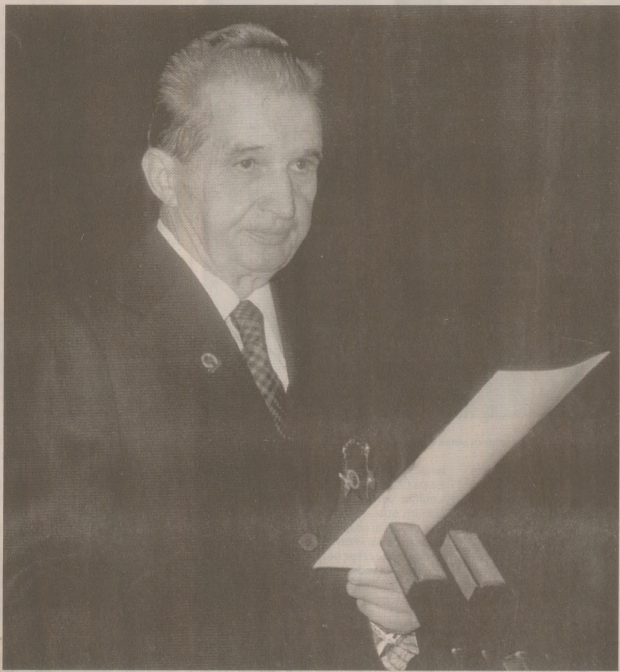
Nicodată Ceaușescu nu s-a exprimat niciodată public despre primirea „scrisorii celor șase”

F) Scrisorile sunt deschise în mod sistematic și conversațiile telefonice