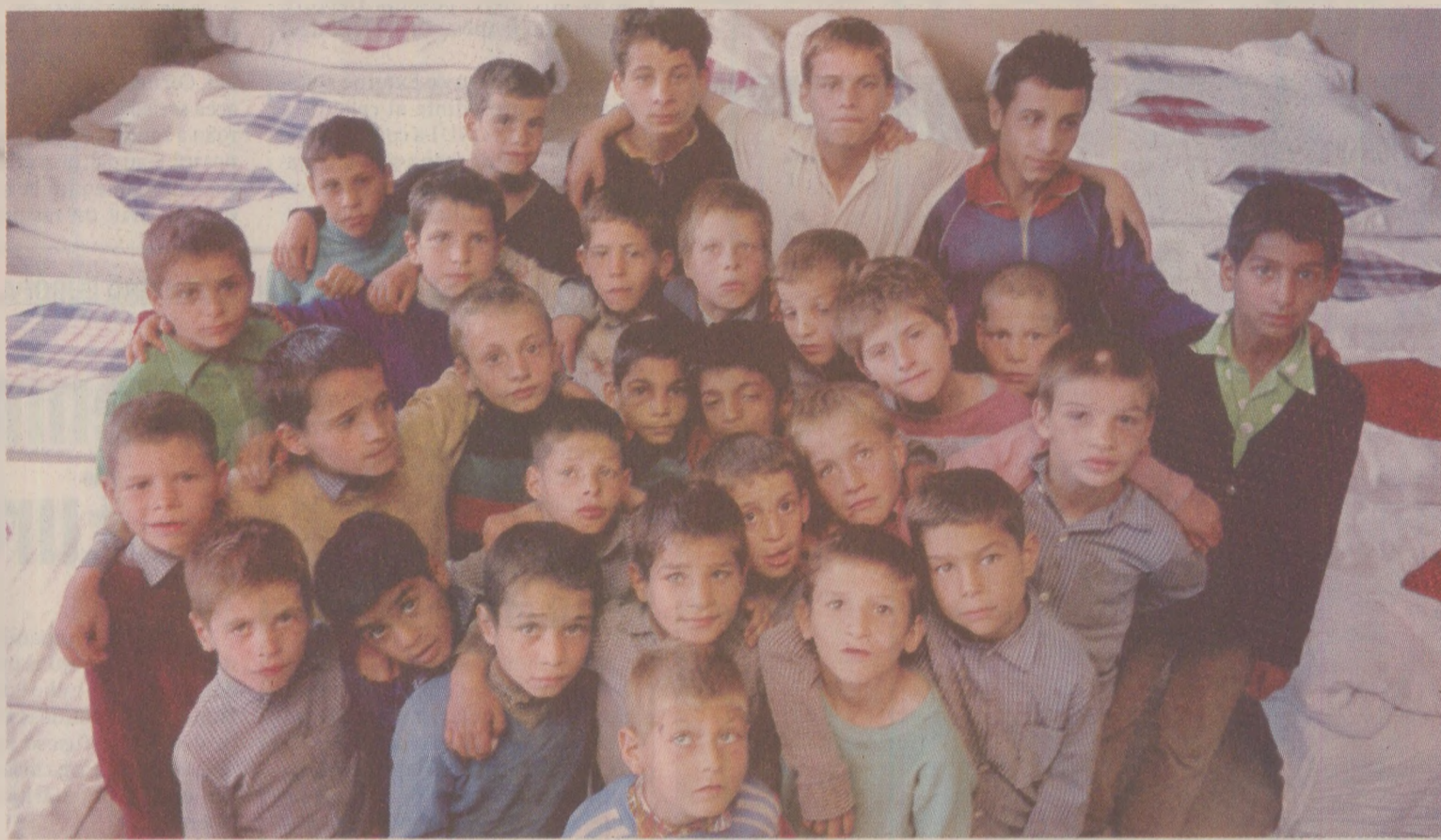
Copiii care făceau în pat li se spunea pișorcoși, stropitori sau plutași, pentru că dimineața îi vedeai cum ies cu salteaua în spate

Taberele erau pentru buni și pentru răi, dorite și nedorite. La 16 iunie, pentru că eram printre premianți, ajungeam la Năvodari, la una dintre taberele Căminării, Delfinul, Temerarii. Dintre ăia 300, foarte puțini înși erau buni la învățatură, oricum nu mai mult de 10%. Mai erau și taberele obligatorii, cum ar fi cea de la Bivolari, aflată la 40 de kilometri de Trușești, apoi cea de la Strun-