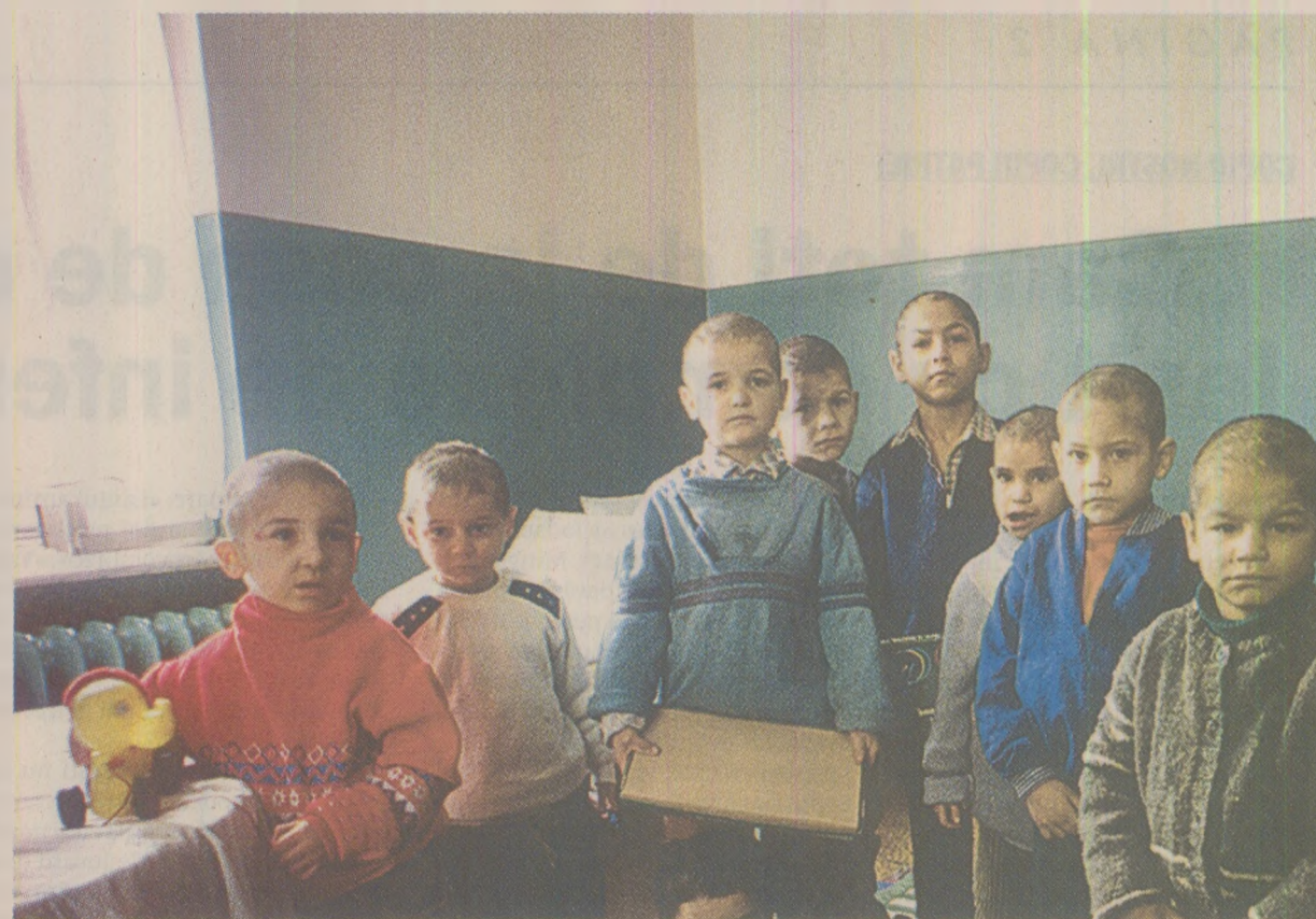
Scrisorile pe care le primeau copiii erau citite public în fața clasei de învățătoare