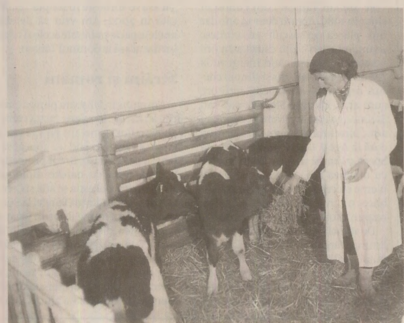
Pentru că în 1989 tăierea unui vitei din gospodăria proprie se pedepsea cu închisoarea, țărani dădeau animalele de bună voie la stat

Erau realiste cifrele? „Nu, nu erau realiste. Ele erau făcute și defalcate de oameni neprofesioniști. Erau cifre care rezultau din planurile cincinale naționale și trebuiau date mai departe... Nu erau cifre reale. Noi încercam să comentăm, să arătăm adevăratele posibilități de producție a animalului. Degeaba. Cifra era impusă. Nu puteam nici să apelăm la