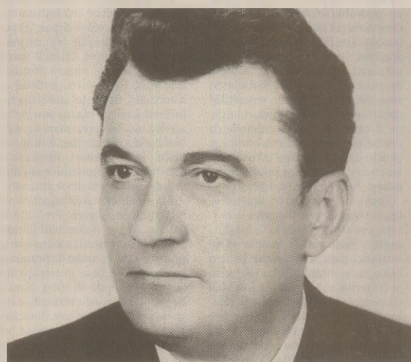
Ministrul de Externe, Ion Totu, a negat de fiecare dată acuzațiile că în România drepturile omului nu sunt respectate

...Am citit articolul din LUPTA privind protestul acestor corifei partinici. Însă ziarul dă de fapt doar textul protestului, iar acest text stă alături de cel al Doinei Cornea cu câteva numere înainte. Pentru cititori sunt de fapt toți niște protestatari, fiecare în felul lui, noțiunea deosebiri nu rezultă. De aceea, fie că au fost ridicăți aceștia la nivelul Doinei Cornea sau, mai degrabă, a fost coborâtă această temerară profesoară la nivelul licheismului lor partinic. În lumea asta sunt multe cauze care conduc fenomene diferite la același efect. Pe unii îi interesează efectul, pe mine cauza. Extrapolând fenomenul uitării, putem trece în rândul prigonitilor, ba chiar ai martirilor acestui popor, pe toți colaboratorii «familiei sacre», care au fost destituiți între timp. Fără discuție, o dată cu destituirea, și ei devin niște protestatari. O întrebare rămâne însă mai departe deschisă: din ce cauză sunt ei nemulțumiți? Ce doresc prin protestul făcut? Iar atunci când au acceptat puterea, înainte de a fi dați afară, nu au fost în țară aceleași condiții pentru care protestează astăzi?