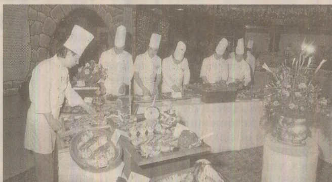
În 1989, la orele de practică, elevii se pregăteau pentru Olimpiada culinară

„În 1989, învățământul de specialitate era organizat pe discipline, pe trimestre, acum este organizat pe module, iar mediile se încheie la sfârșit de an școlar sau în momentul în care se termină numărul de ore destinat respectivului modul”, ne precizează profesoara. Arta gătitului începea la clasă, la teorie, unde se vorbea despre valorarea nutritivă a preparatelor, locul lor în meniu, asocierea cu diferite băuturi, sisteme de servire și se încheia în laborator, unde se realizează în mod practic. Atunci, ca și acum, școala avea un fond destinat acestei activități. „Orele de pregătire practică se desfășurau atât în laboratoarele școlii, unde se formau competențele specializate, cât și la IAPL (Întreprinderea de Alimentație Publică Locală), cu care școala avea încheiate contracte. Numărul de ore de practică era mult mai mare față de acum: trei-patru zile din săptămână erau dedicate practicii”, își amintește