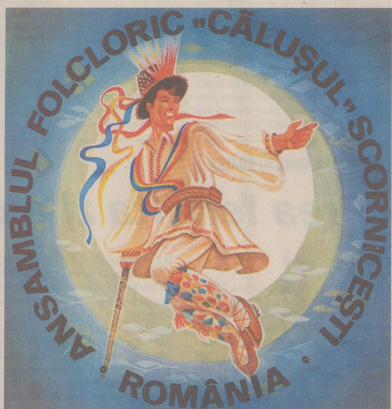
Triumful folcloric al unei comune ajunse stat în stat