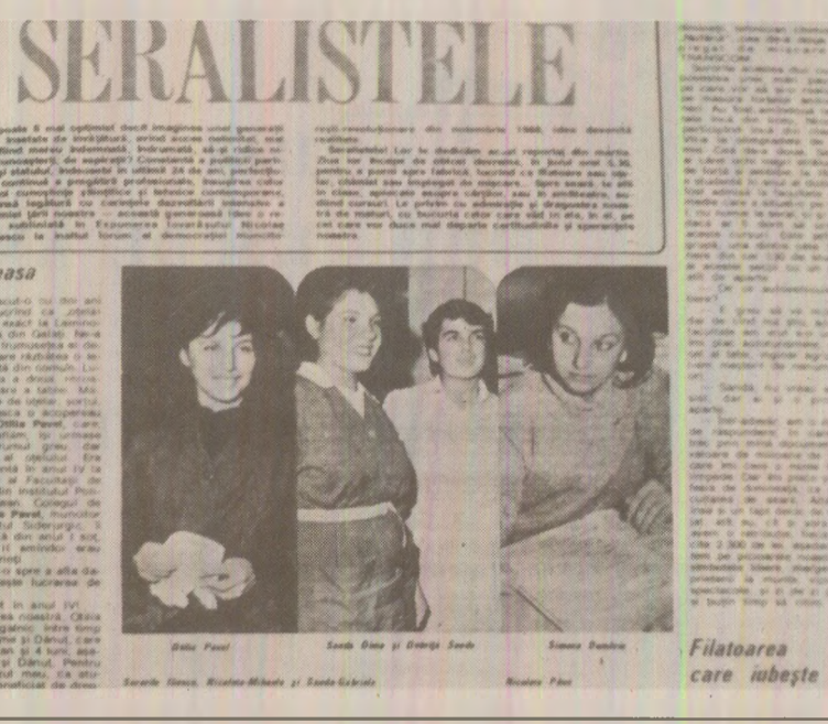
Filatoarea care iubește