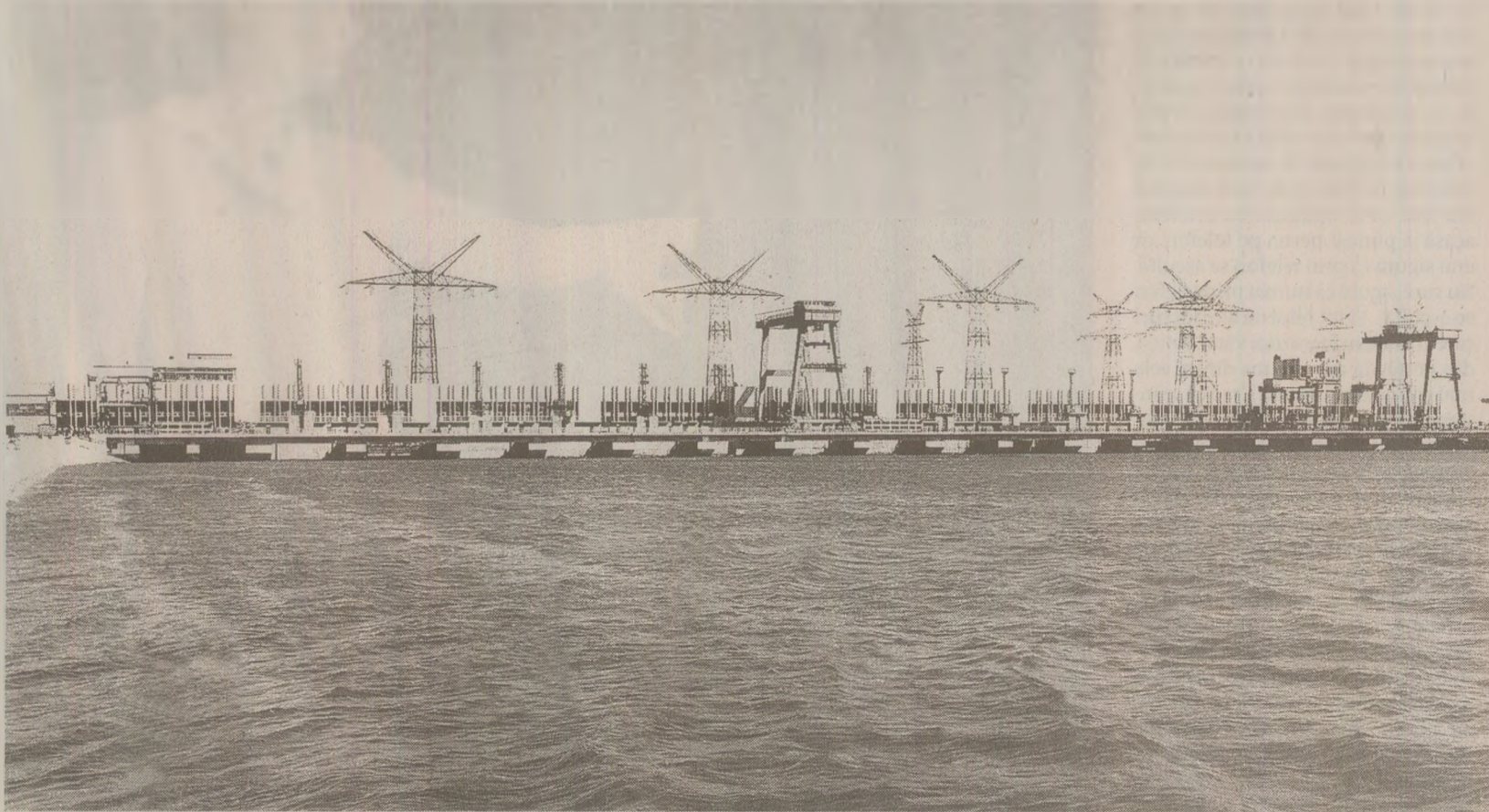
România a avut în 1989 o dispută diplomatică cu Iugoslavia pentru că am folosit prea mult hidrocentrala de la Porțile de Fier