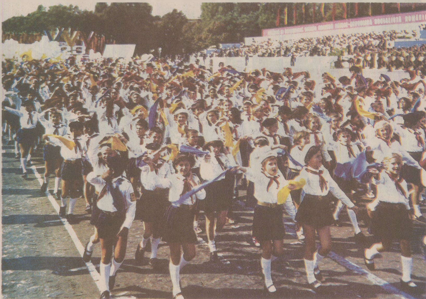
„Copiii fericiți ai patriei!” veneau de multe ori pe lume fără a fi dorii de părinții lor. Decretul antiavort făcea imposibilă planificarea familială

Trebuia să iau ceaiul seara și apoi dimineața. Iar la amiază trebuia să încep hemoragia. Așa că, în ziua în care știam ce avea să se întâmple, am mers la șeful-maistru de echipă să-mi dea o zi liberă. Mi-a cerut un litru de țuică de prune și până la urmă tot nu mi-a dat ziua liberă. Așa că, în ziua aceea, la amiază, când hemoragia s-a declanșat eram la muncă. Și nu puteam spune nimănui ceea ce trăiam. Cum mi s-a făcut rău la un moment dat, foile a acceptat să îmi dea un „bilet de veche”. Am ajuns acasă mai mult moartă decât vie. În orele care au