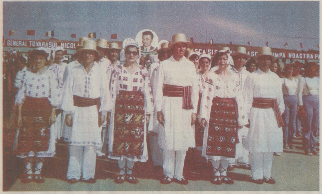
Desfășurarea de forțe numită „Cântarea României” a luat proporții și s-a transformat în emisiunea Tovarășilor