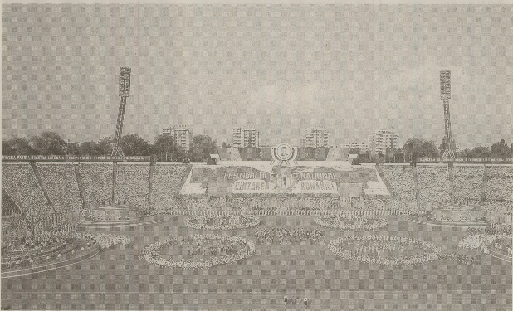
La Festivalul „Cântărea României”, totul era dirijat de la Comitetul Central

Apărută inițial sub forma altor proiecte, „Celui mai iubit fiu” sau „Omăgiu țării, conducătorului iubit”, desfășurarea de forțe numită Cântărea României a luat proporții și s-a transformat în emisiunea primilor tovarăși ai țării. Astfel că, în 1989, ajunsese „pe cele mai înalte culmi ale dezvoltării și progresului”.