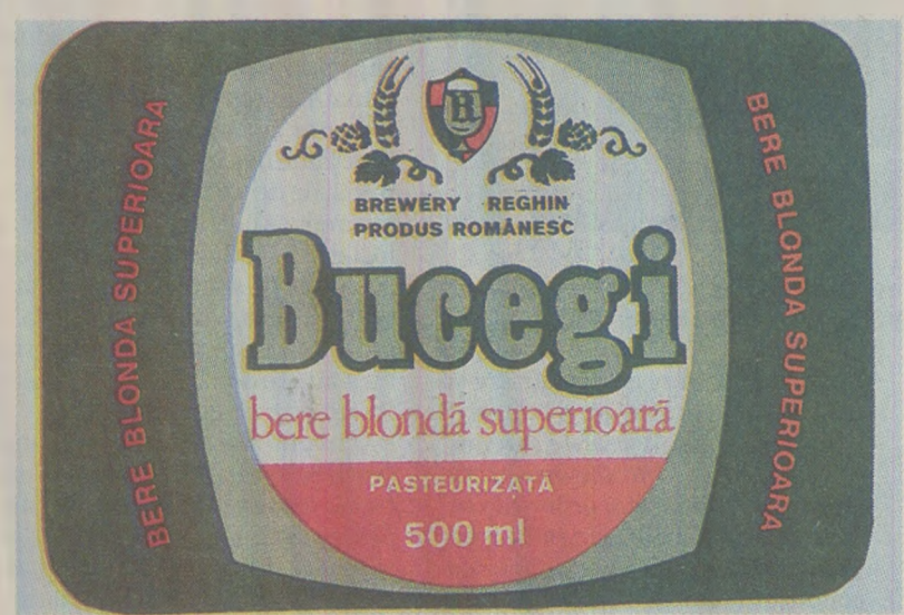
Berea superioară „Bucegi” se „trezește” după cinci minute