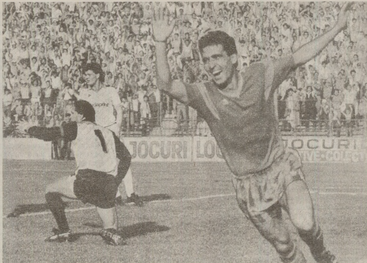
Gică Hagi a deschis drumul unei victorii steliste contestată de rivalii din Ștefan cel Mare

În etapa a 20-a a returului sezonului 1988-1989 a fost programat eternul derby al campionatului, Steaua - Dinamo, meci care s-a desfășurat pe arena din Ghencea. În acel moment, cele două echipe erau la egalitate de puncte în fruntea clasamentului, câte 37 de puncte, dinamoviștii devansându-și rivalii la golaveraj. Dinamoviștii aveau nevoie de victorie pentru a mai spera la titlu, în condițiile în care Steaua nu mai pierduse vreun joc de peste două sezoane. La final a fost 2-1 pentru gazde, însă totul s-a terminat cu un imens scandal, după ce căpitanul lui Dinamo, Ioan Andone, s-a dus în fața tribunei oficiale, unde se aflau sefiile Stelei, printre care Ilie și Valentin Ceaușescu, făcând gesturi obscene. Sabău și Mihăescu au reușit să-l oprească pe fostul internațional, însă era prea târziu.