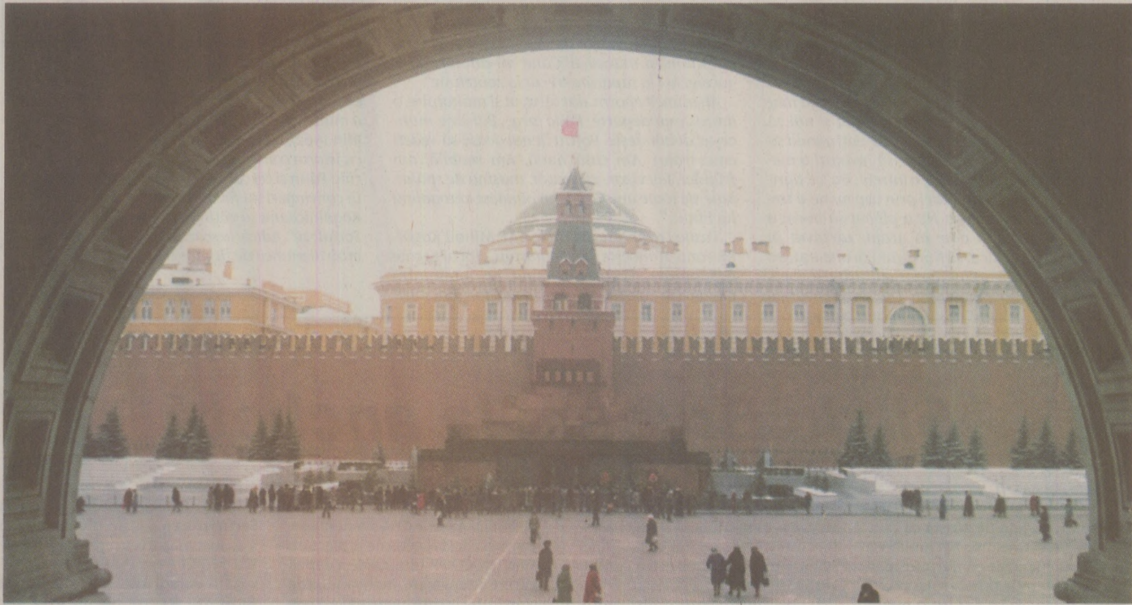
După ce primeau aprobările de la COM și Securitate, când ajungeau în patria socialistă, românii intrau în program. Punct obligatoriu - coada la mormii lui Lenin.

„Vând dormitor complet, stare bună, mobilier de hol și pianină corzi încrucișate, samovar, sfeșnice din argint, combină muzicală Akai, mașină de cusut electrică Sanda, mașină de spălat Albalux, calorifer electric, haină de nurcă damă, măsura 48, căciula astrahan, cărți, diverse.” O viață de om scoasă la vânzare. Viața unei familii. Genul acesta de anunțuri de vânzare, prezente în paginile de specialitate ale Scînteii sau României Libere, erau, de fapt, mai mult decât vânzări de obiecte. Ochiul format știa să distingă vânzările obișnuite de „totala debarasare” care precedea părăsirea definitivă a țării.