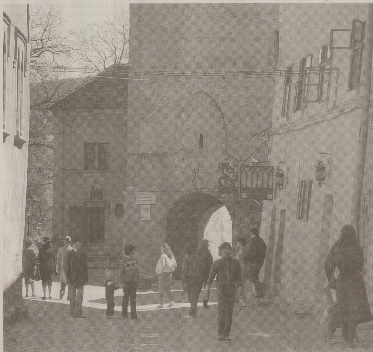
Vânt de primăvară la Sighișoara!