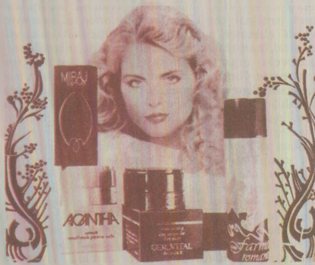
Miraj – București, Nivea – Brașov și Farmec – Cluj-Napoca produceau peste 800 de produse cosmetice și parfumerie