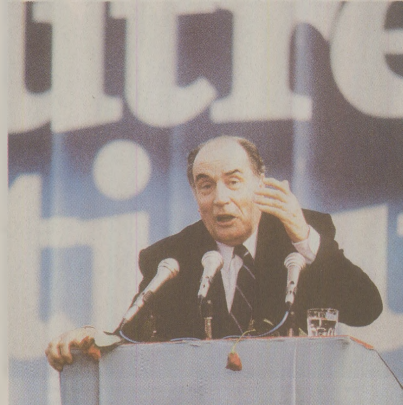
Președintele francez François Mitterrand și guvernul său acuzau România de „măsuri polițienești împotriva personalităților”