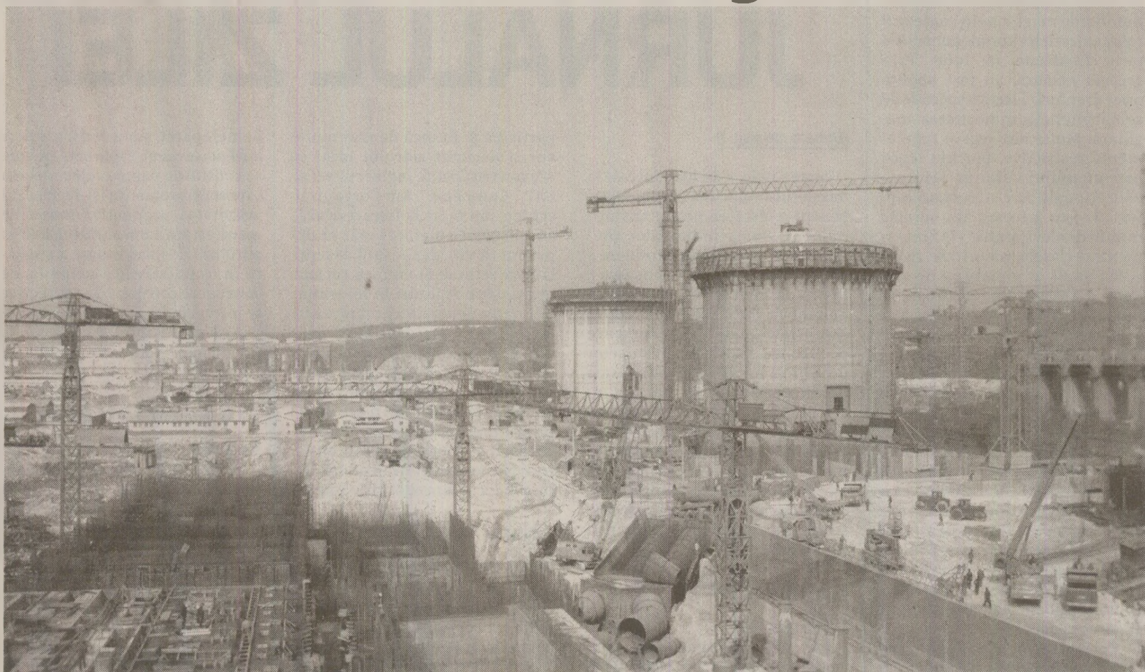
Cercetători, ingineri, constructori, diplomați - „un singur gând, o singură voință” și pentru punerea în funcțiune a Centralei atomo-electrice de la Cernavodă