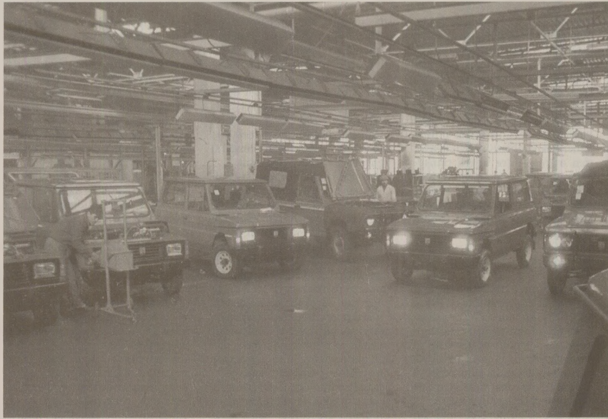
Oficial, în perioada comunistă, mașinile ARO erau la mare căutare, fiind cunoscute în peste 50 de țări ale lumii

În aceeași emisiune „Drumuri de inimă și țară”, după două orașe importante, puncte de reper pentru diferite sectoare ale economiei, atenția realizatorilor se îndreaptă spre o comună din județul Dâmbovița. Așa cum v-ați închipuit deja, aceasta nu a fost aleasă la întâmplare, localitatea Poiana reprezentând un model pentru celelalte sate și comune de pe plaiurile românești. Nu numai că este „multiplă câștigătoare a întrecerii socialiste”, ci „a demonstrat o masivă dezvoltare pe toate planurile”, locuitorii fiind dintre cei mai destoinici. Cine altcineva putea cunoaște mai bine destinul comunei dacă nu Marin Florea, unul dintre cei