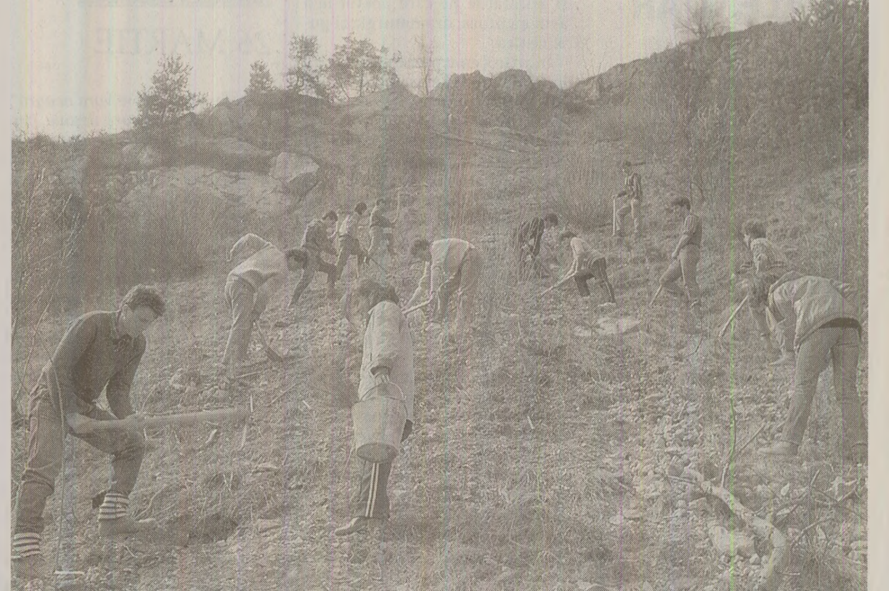
În „Luna pădurii”, organizată în martie 1989, toți „oamenii muncii” erau îndemnați să planteze arbori