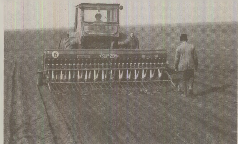
Campania agricolă era în toi la sfârșitul de martie. Presa vremii anunța „zile hotărâtoare” pentru semănat

Ziarul România Liberă anunță „zile hotărâtoare la semănat”. Cum campaniile agricole țin tot anul pe diversele fronturi zootehnice, legumicole, pomicele ori în tarlăua mare, curg ca-n război, fără odihnă și sărbătoare, „leri, numeroase forțe au fost prezente pe câmp la executarea lucrărilor agricole de primăvară, scrie oficiosul Frontului Democrației și Unității Socialiste, referindu-se la ziua de duminică. În această săptămână se cer lichiditate cât mai repede restanțele la semănatul culturilor mai timpurii. Pe măsură ce se creează condițiile de temperatură în sol, va trebui să se declanșeze fără întârziere semănatul porumbului. Vitezele la semănat pot și trebuie să crească.