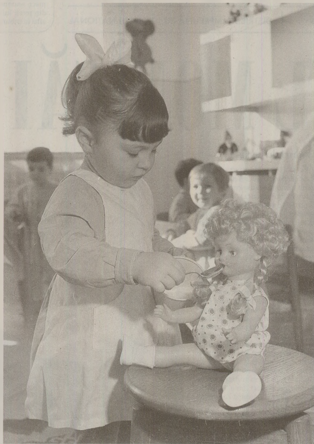
Printre subiectele tabu ale „Epoicii de Aur” erau și copiii cu handicap. În schimb, în presa vremii, micuții erau întotdeauna fericiți și sănătoși

Camera centrului erau mobilate auster, cu șase paturi într-o cameră și două dulapuri cu două despărțituri. Paturile erau de fier, ca de spital. În anii '80 ajunseseră să aibă deja zeci de ani de uzură în spate. Înainte de Revoluție, în condițiile în care numărul de copii atingea 400, a fost amenajată și o cameră cu 16 paturi (după 1989 s-a transformat într-o capelă). A fost și o perioadă când copiii stăteau și câte doi într-un pat.