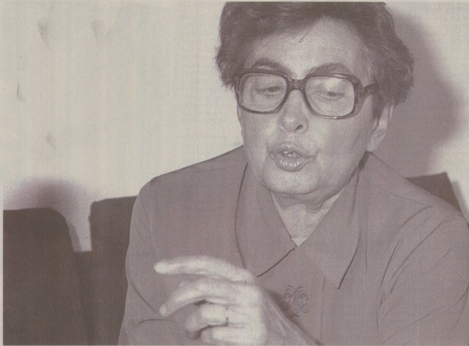
Pentru scriitorul român, a fi lăudat de la microfonul Europei Libere de către Monica Lovinescu în emisiunea „Teze și antiteze la Paris” valora mai mult ca premiul Uniunii Scriitorilor general.