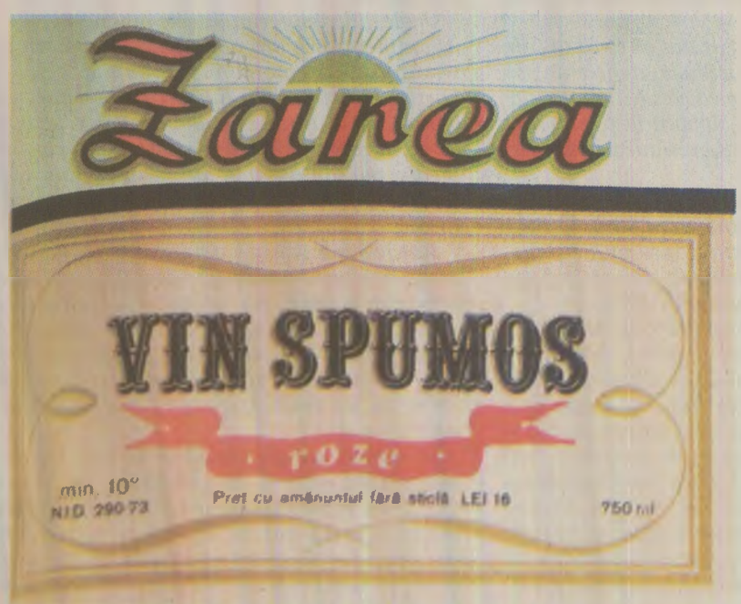
Vinul spumos „Zarea”, tovarășul de petreceri al românilor în anul 1989