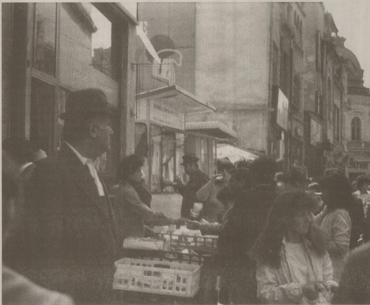
Criza anilor '80 a fost provocată și gestionată integral de Nicolae Ceaușescu

După un stagiul diplomatic, de ambasador în China, Florea Dumitrescu a preluat mandatul de guvernator al BNR în 1984. Culmea este că, din această poziție, este cel care a resimțit din plin deteriorarea relațiilor cu Banca Mondială și FMI, drept consecință a hotărârii lui Nicolae Ceaușescu de a rambursa anticipat datoria externă. Contextul economic al anilor '80 era cu totul altul față de perioada în care fusese ministru de Finanțe. Spre deosebire de deceniile trecute, creșterea în putere Elena Ceaușescu, iar „Cabinetul 2” intervenea tot mai agresiv în chestiunile economice. Intrând în circuitul decizional, pozițiile Elenei Ceaușescu au derutat tot sistemul economic-financiar al țării. Până la urmă,