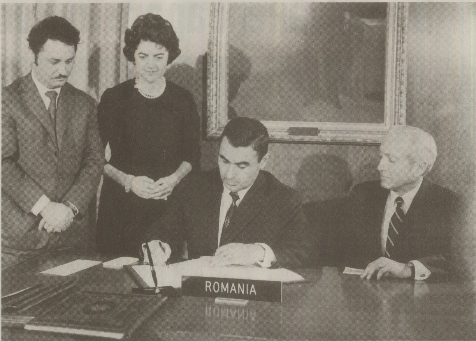
Florea Dumitrescu este semnatarul acordului de aderare a României la FMI și BERD, în calitate de Ministru de Finanțe (15 decembrie 1972)

Prin Decretul nr. 250 de la 12 iulie 1980 s-a stabilit o serie de așa-zise normative sintetice economico-financiare, între care și normative maxime de stoc, calculate la volumul producției marfă reprezentând: necesarul pe numai 20 de zile pentru materii prime și materiale, 10 zile pentru producția neterminată, cinci zile pentru produsele finite destinate consumului intern și 10 zile pentru cele destinate exportului. Pe această bază, la toate întreprinderile s-au stabilit normative de 5-10-20-30 de zile, în timp ce condițiile de aprovizionare teh-