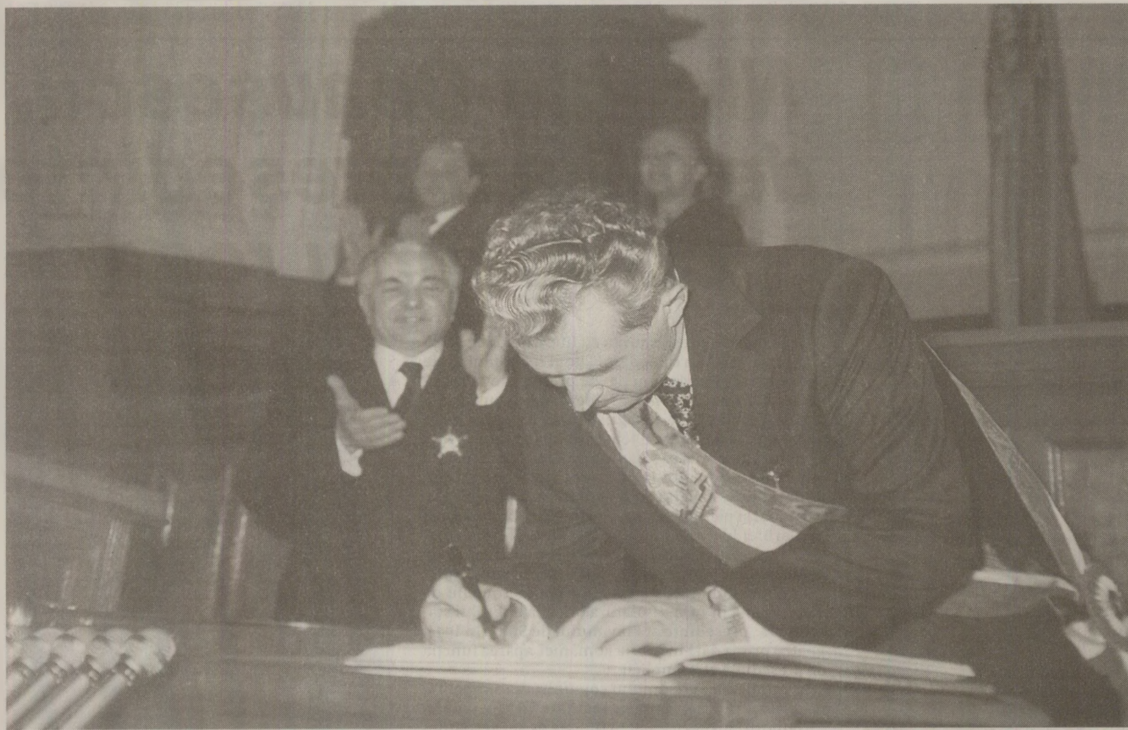
Insemnele funcției prezidențiale erau clasică eșarfă tricoloră, dar și bizarul „sceptru” regal