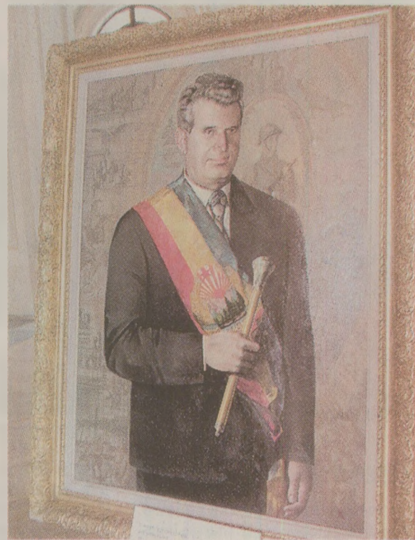
Instituția prezidențială a fost inventată în 1974 de Ceaușescu

De-a lungul vieții, acumulate o sumedenie de calități și titluri oficiale, de-a-proape li se pierduse șirul: secretar general al CC al PCR, președinte al RSR, al Consiliului de Stat, al Consiliului Apărării, al Biroului Permanent al Consiliului Suprem al Dezvoltării Economice și Sociale, al Consiliului Național al Oamenilor Muncii, al Consiliului Național al Frontului Democrației și Unității Socialiste, comandant suprem al