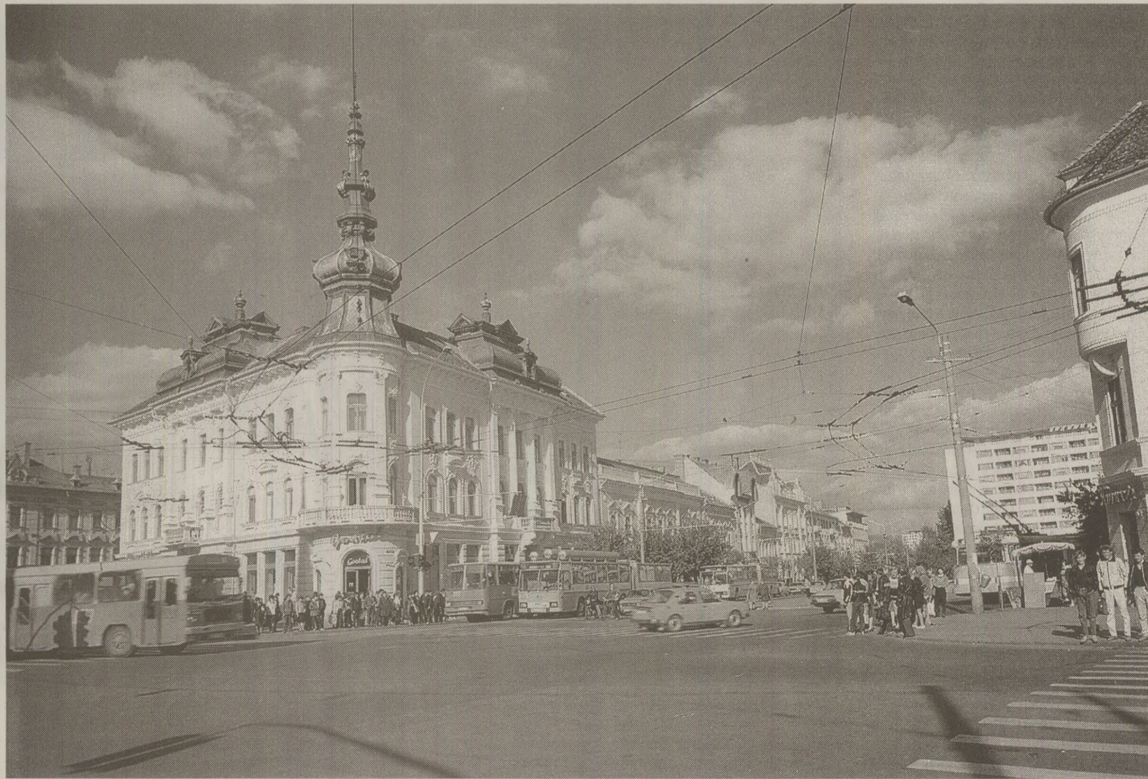
Orașul Cluj-Napoca a fost centrul publicațiilor de tip samizdat editate de comunitatea maghiară din România în anul 1989.

„Editorii noii publicații au amintit de lecțiile învățate de minoritatea maghiară în ultimii 70 de ani. Cea mai importantă lecție care trebuie deșirată din trecut, au insistat editorii, este că nimeni nu se poate aștepta ca o schimbare să aibă loc în România peste noapte. Deși este adevărat că responsabilitatea principală pentru actuala situație îi aparține unei singure persoane, sentimente nefavorabile și chiar sentimente de ură față de minoritatea maghiară au o răspândire largă, regăsindu-se la largi segmente ale populației românești. Dacă dictatorul ar fi dat jos, tot ar rămâne în picioare o „piramidă” intactă din moment ce ar fi o naivitate să se speră că un fel de glasnost sau de perestroikă ar schimba lucrurile într-o clipă. La finalul articolului de lansare, editorii și-au exprimat „profunda satisfacție și gratitudine” pentru grija și sprijinul pe care l-au primit de la statul maghiar și de la maghiarii de pretutindeni. La fel de îmbucurător, au spus ei, este faptul că tot mai mulți oameni au constientizat că „tirania și discriminarea etnică sunt două extreme ale aceluiași sistem” și că „nici un popor nu poate fi liber dacă le oprim pe altele”.