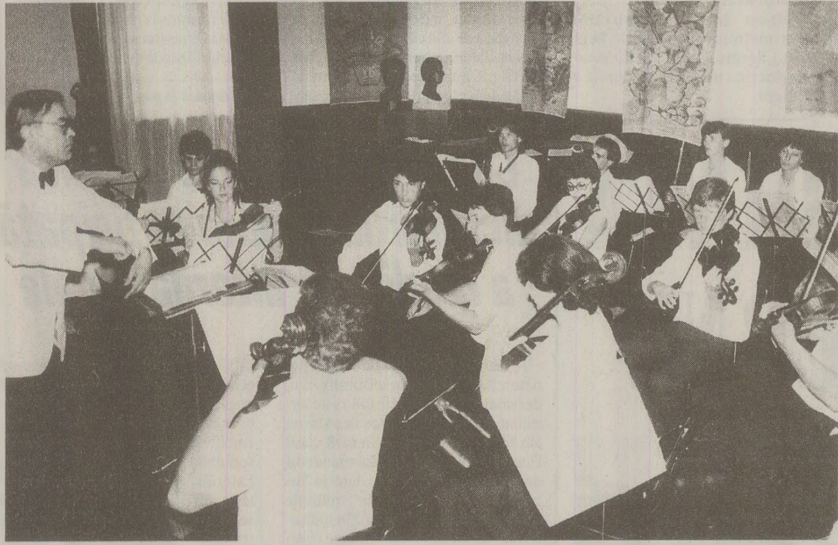
Studenții se întrecuau la mai multe secțiuni: muzică corală, vocal instrumentală, populară, satiră și umor