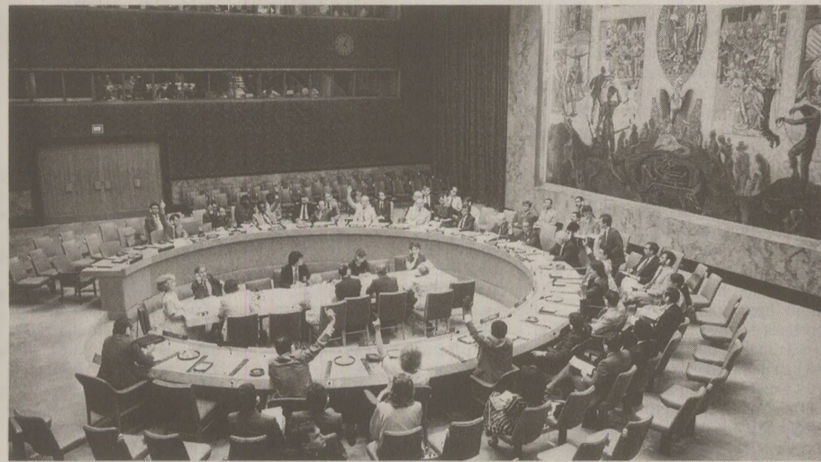
Sistemizarea și situația minorităților din România erau în atenția Comisiei pentru drepturile omului a ONU, care a cerut o anchetă la fața locului