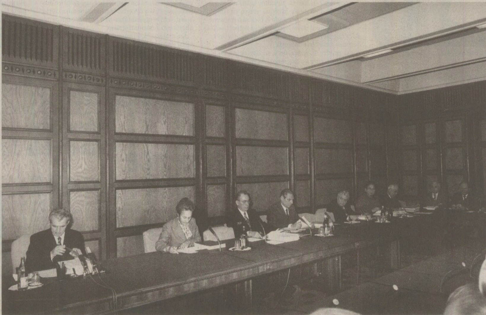
După achitarea datoriei externe, Ceaușescu nu avea de gând să anuleze programul de austeritate inițiat la începutul anilor '80

Noi avem însă creanțe, mai avem de încasat 2,5 miliarde de dolari, adică, credite pe care le-am acordat noi și trebuie să le plătească.