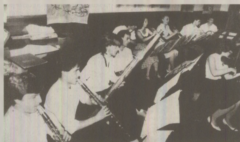
În martie, la Iași s-a ținut una dintre etapele pe țară ale Festivalului Artei și Creației Studențești

„Magistrală a devenirii studențimii române.” Așa numeau autoritățile comuniste Festivalul Artei și Creației Studențești (FACS). Una dintre etapele pe țară s-a desfășurat în martie la Iași. Urmat în aprilie la Craiova și în alte centre universitare Organizată cu fast, un adevărat spectacol de sunet și lumină, „șueta” studențească era una destul de costisitoare. Existau etape de calificări, la nivelul fiecărei facultăți, universități, după care se fixa (pentru martie și aprilie) câte un centru universitar pentru fiecare „breașă” a artiștilor: muzică corală, formații vocal-instrumentale, de muzică populară, trupe de satiră și umor și așa mai departe. Plecarea în locația cu pricina se făcea cu trenul, aglomerație de neînchipuit, cazarea în cămine, la îngărâdeală, mâncarea la cantină, imbulzeală în orașul cu pricina în tramvaie, în sălile unde se așteptau spectacolele. Însă studenții erau și pe atunci dornici să se întâlnească între