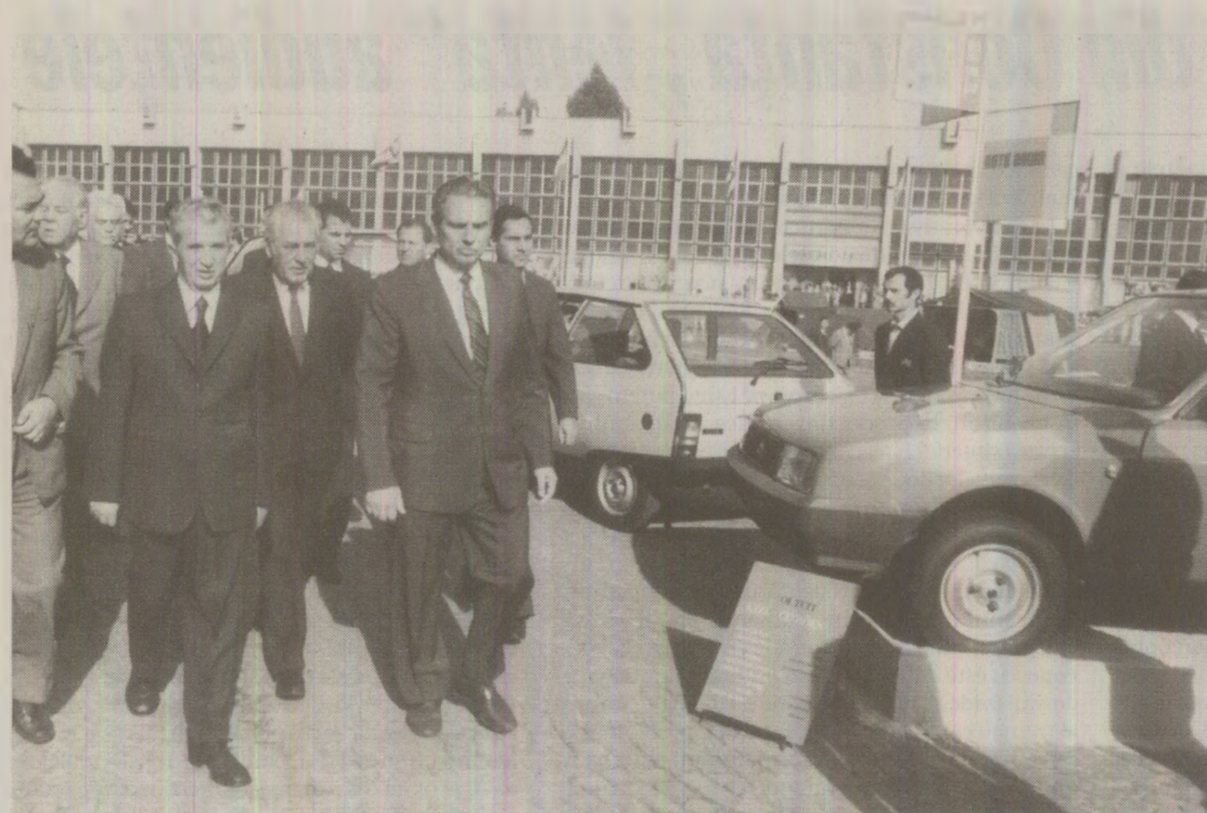
Pentru a obține valuta necesară plății datoriei, majoritatea produselor românești expuse la târguri și expoziții luau apoi calea exportului

Ati citit articolul din ziarul austriac al Partidului Comunist? În agricultură trebuie să pornim de la producție globală agricolă la hectarul arabil de 50.000 de lei, în elaborarea în întregime a programului; vom avea și programe pe fiecare comună și oraș, program de dezvoltare economică-socială a tuturor localităților de la început, în cadrul autoconducerii. Deja avem acum în toate comunele și autofinanțare, deja sunt județe unde toate cooperativele sunt rentabile, și anul acesta vrem să realizăm în toate unitățile cooperatiste și programe de dezvoltare economică-socială,