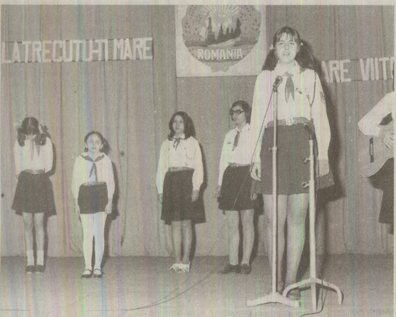
În aprilie 1989, Organizația Pionierilor a sărbătorit patru decenii de la înființare.