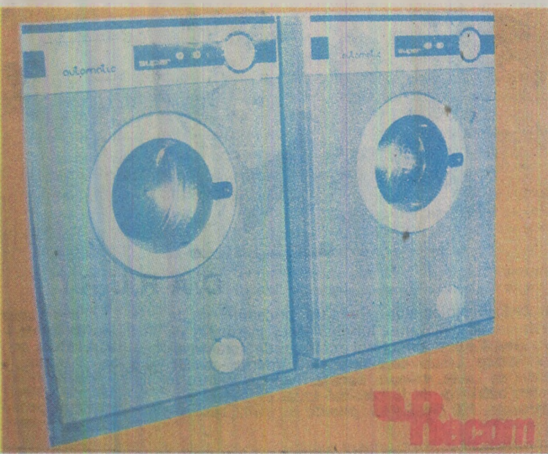
Automatic și Automatic Super - primele mașini de spălat automate produse în România