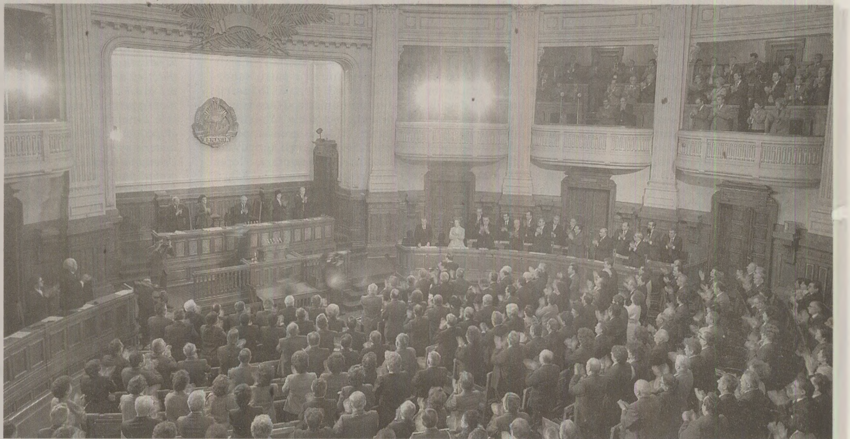
Nicolae Ceaușescu a anunțat, în cadrul Marii Adunări Naționale, restabilirea județelor, municipiilor și comunelor țării. ca un nou pas de implementare a planului de sistematizare