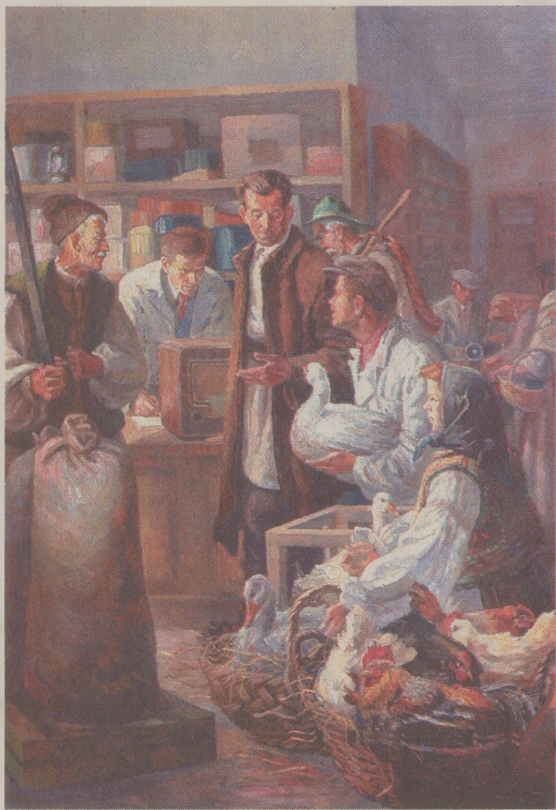
În anii '50, colectivizarea agriculturii începuse printr-o însuflețită campanie propagandistică despre binefacerile pe care le vor aduce CAP-urile țărănilor. După 40 de ani s-a constatat colapsul total

În vremea aceasta, vechile CAP-uri, lipsite de forță de muncă