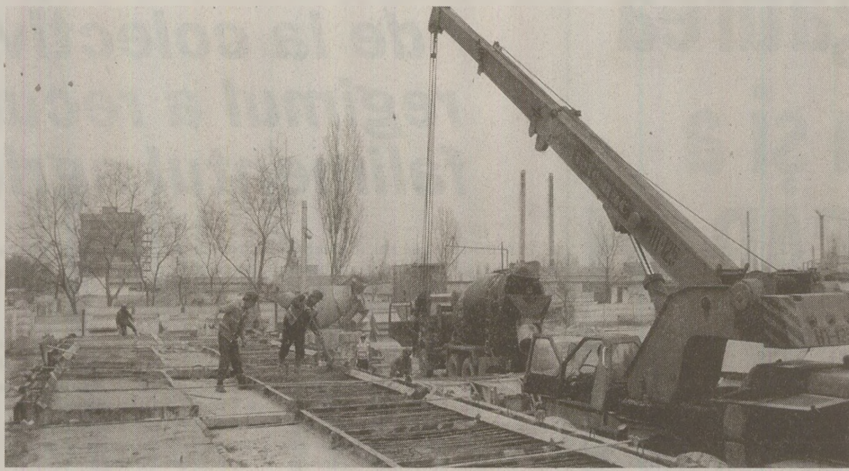
Emisiunile Radioului difuzau programe despre realizările socialismului și eroismul oamenilor muncii

Comitetul muncitoresc București al Uniunii Tineretului Comunist, împreună cu Centrala de Antrepriză Generală Construcții Montaj București a organizat, încă din noiembrie 1984, activitatea șantierului. Cu alte cuvinte, brigadierii, muncitorii, organizații în echipe și lucrând în schimburi, puneau umărul pentru îndeplinirea obiectivelor trasate generos de conducător: ridicarea complexului agroalimentar din Piața Unirii (denumire elaborată pentru un spațiu căruia îi lipsea mai degrabă rostul – de unde bogățiile de alimente în „iarna” veșnică pe care o traversa cu încrenă – cenare România!), ansamblul de locuințe și magazine de pe Strada 13 Septembrie, Complexul Aviației și Floreasca (de fapt, apartamentele, acele cutii de beton cu ochi și urechi, nu puteau proteja intimitatea personală, devenită o utopie), pasajul subteran Mărășești. Cu lopata și cazmaua, brigadierii creau – și nu doar construiau – însemnele României moderne.