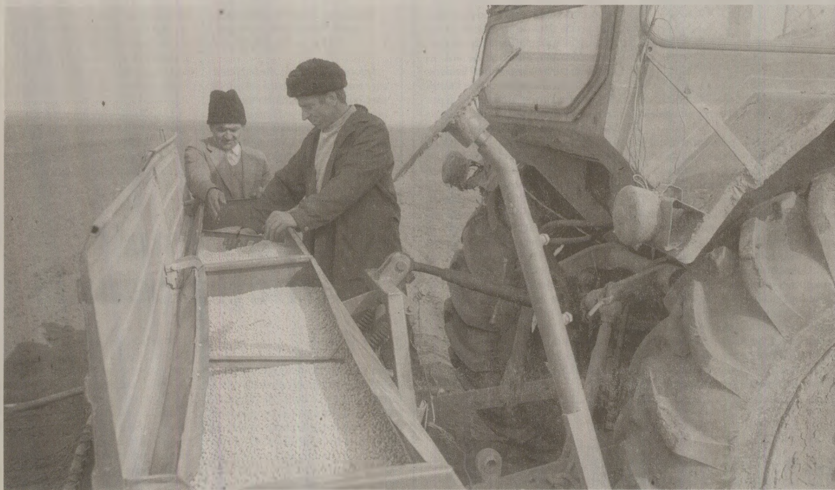
În vreme ce presa oficială publică sute de articole referitoare la succesele agriculturii după 40 de ani de la începutul colectivizării, în discuțiile CPEx Nicolae Ceaușescu încerca să cărească falsurile privind performanțele CAP-urilor

În ziua de 7 aprilie 1989 s-a întrunit Comitetul Politic Executiv al CC al PCR într-o ședință prezidată de Nicolae Ceaușescu. Reproducem fragmentele din stenogramă referitoare la pregătirea ultimului congres al PCR și la propunerile privind anularea și eşalonarea unor datorii ale cooperativelor agricole de producție. Reiese din discuții în mod clar falimentul cooperativizării agriculturii: din 3.895 de CAP-uri existente în România anulul 1989, doar 413 nu aveau datorii.