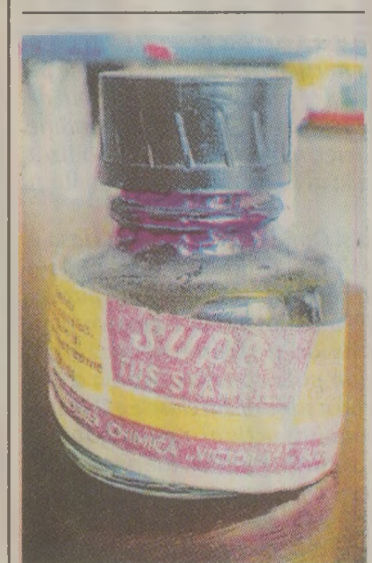
Întreprinderea chimică „Victoria” din București fabrica și tuș „Super” pentru ștampile