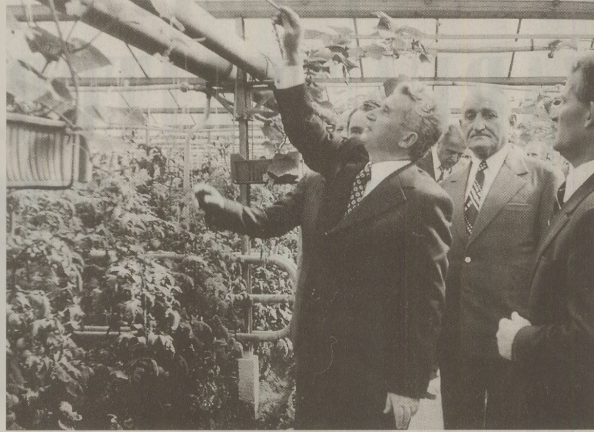
În timp ce propaganda oficială relata realizările mărețe din agricultură, piețele agroalimentare erau goale

Exporturi de produse alimentare românești în alte state, realizate pentru obținerea unor devize convertibile Situație statistică privind o parte din produsele exportate în anul 1988 de Ministerul Industriei Alimentare, în contul anului 1987: