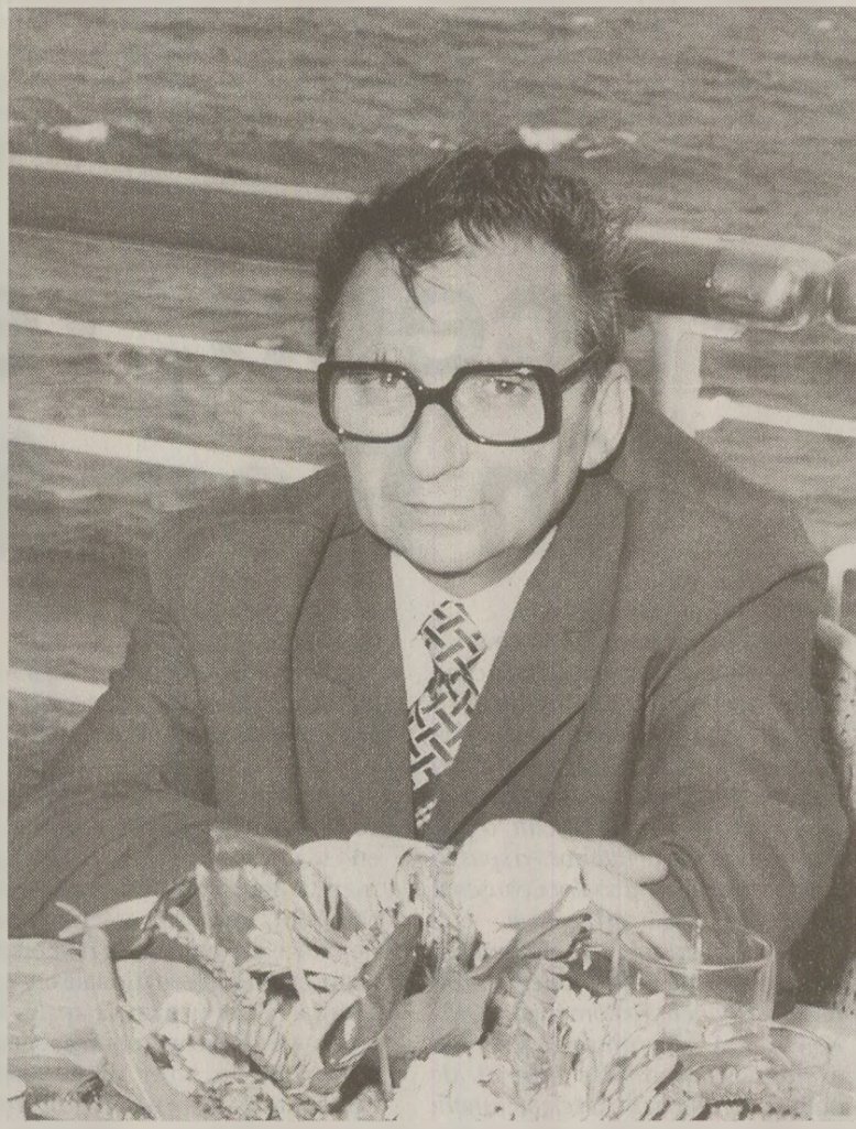
De la plecarea sa din 1978, I.M. Pacepa, „defectorul” cu cea mai înaltă funcție din Est, a revenit în România doar prin cărțile sale

Era anunțată ca apariție de ultimă oră, avea copertile roșii și era destul de voluminoasă. Cum librăria era închisă, m-am înființat a doua zi la prima oră a deschiderii, ca nu cumva să mi-o ia cineva înainte. M-am întors la Misiune, unde tot personalul, inclusiv ambasadorul, avea birourile și apartamentele în aceeași clădire. Pentru a nu ne rupe de țară, aici iarna era frig, iar vara cald. Am ascuns cu grijă cartea până m-am întors de la ONU. Nici nu am mai mâncat, fiind adânc cufundat în lectură până seara târziu. De fapt, m-a apucat lumina zilei citind cu înfrigurare povestirile lui Pacepa. Nu am terminat-o, astfel că a doua zi m-am învățat puțin pe la birou – să mă vadă lumea – și iar m-am întors la lectură mea palpitantă. În fine, am terminat-o și parcă mi-a părut rău.