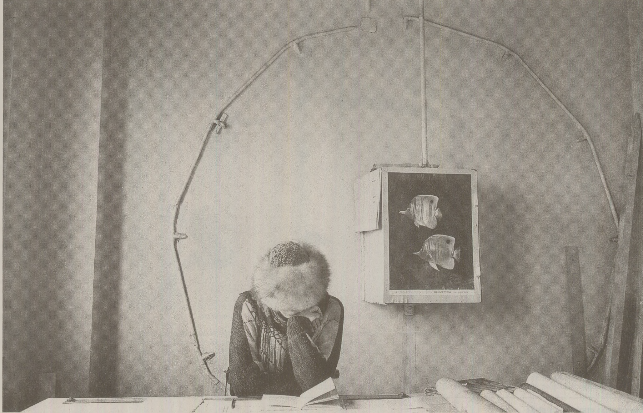
Din cauza reducerii consumului de energie românii îndurau frigul atât acasă, cât și la serviciu

câte patru ore pe zi (intervalele orare: 05:30-07:00; 18:00-20:30) – în perioadele 15 octombrie-15 decembrie 1988 și 1 martie-31 martie 1989;