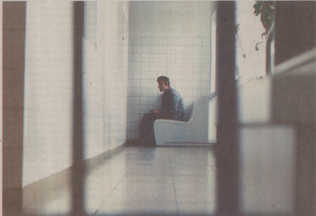
Democrație patologică: bolile psihice îi afectau în mod egal și pe nomenclaturişti și pe oamenii simpli.

„Bă, Ceaușcă asta a înnebunit de tot, fir-ar mama lui a dracu' de paranoic. Dar las' că nici nevastă-sa nu-i mai teafără. Aia măcar a fost neună dintotdeauna.” Vorbe pline de năduf, care începuseră să se audă, din ce în ce mai des, în ultimeluni ale „Epoicii de Aur”. Dar, în același timp, și Ceaușescu însuși afirma adeseori că doar nebulii nu cred că socialismul este cea mai bună și cea mai dreaptă orânduire din istoria omenirii. Două opinii aflate la extremele unui soi de folclor care, pe atunci, făcea din ce în ce mai des trimitere la psihiatrie. Pe de o parte, la psihiatria „lor”. Dar pe de altă parte, la cea a poporului obligat să participe de voie, de nevoie la construirea societății socialiste multilateral dezvoltate. Știm cu toții ce credeam despre „nea Nicu” și despre „Leana”. Dar oare noi, oamenii obișnuiți, poporul muncitor cum stăteam din punct de vedere al sănătății mintale? Este o întrebare pe care atunci, la fel ca și acum, ne-o punem foarte rar. O întrebare probabil neplăcută, al cărei răspuns poate fi dat doar de specialiștii care au muncit în acest domeniu al sănătății publice.