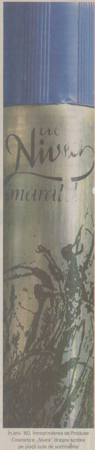
În anul '80, Întreprinderea de Produse Cosmetice „Nivea” Brașov scoate pe piață sute de sortimente