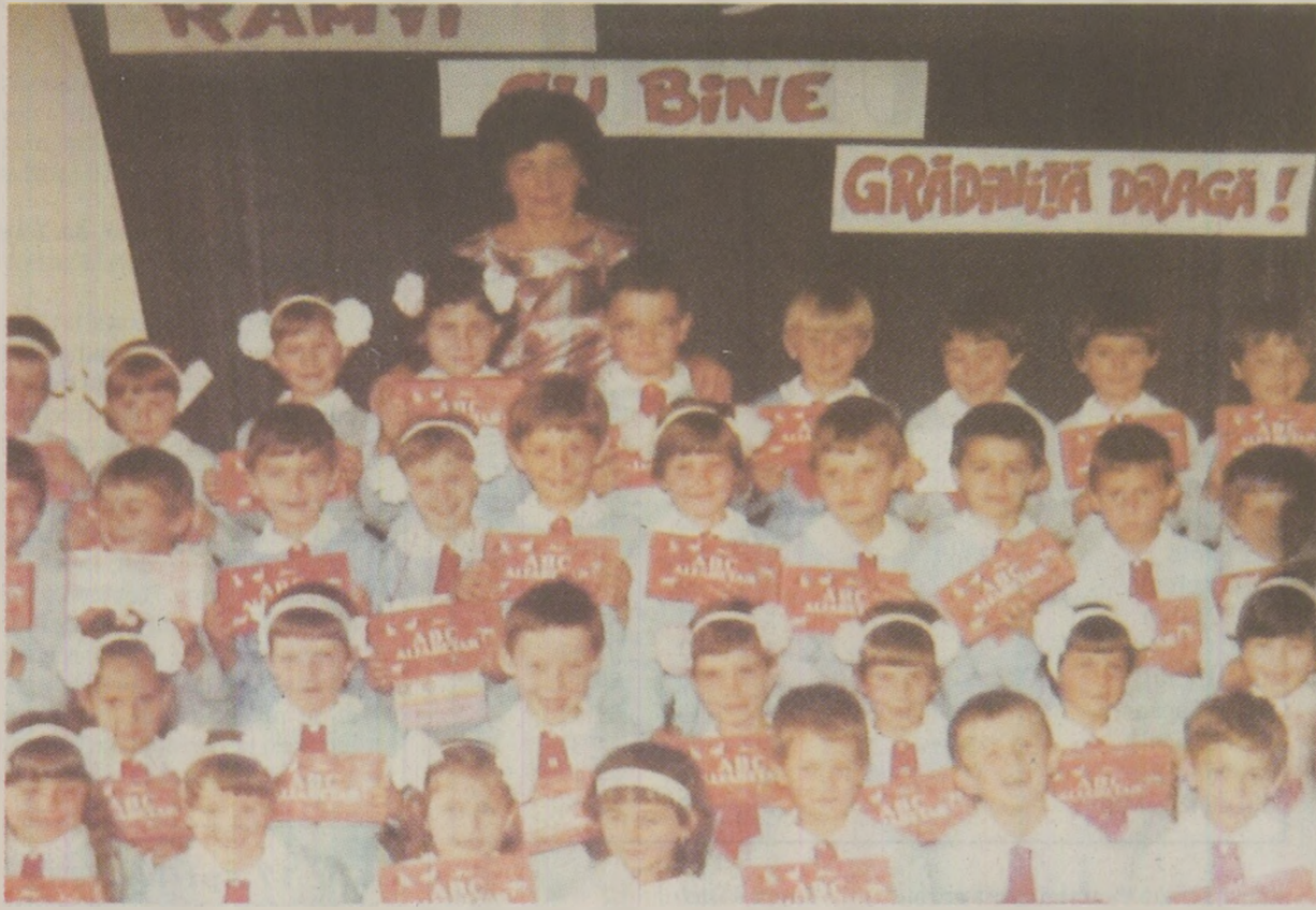
Dintre scrierile lui Octav Pancu Iași, cea mai cunoscută de școlarii din ciclul primar era „Fetița care l-a luat pe Nu în brațe”

„Era cu adevărat un tip incântător. În 1949, tinându-se seama de oarecare apăsătoare mele scriitoricești am fost solicitat să lucrez la emisiuni pentru tineret, care erau groaznice, erau proletcultiste, spre deosebire de emisiunile pentru copii, pe care le conducea Octav Pancu Iași, care erau pline de farmec și aveau o audiență extraordinară.