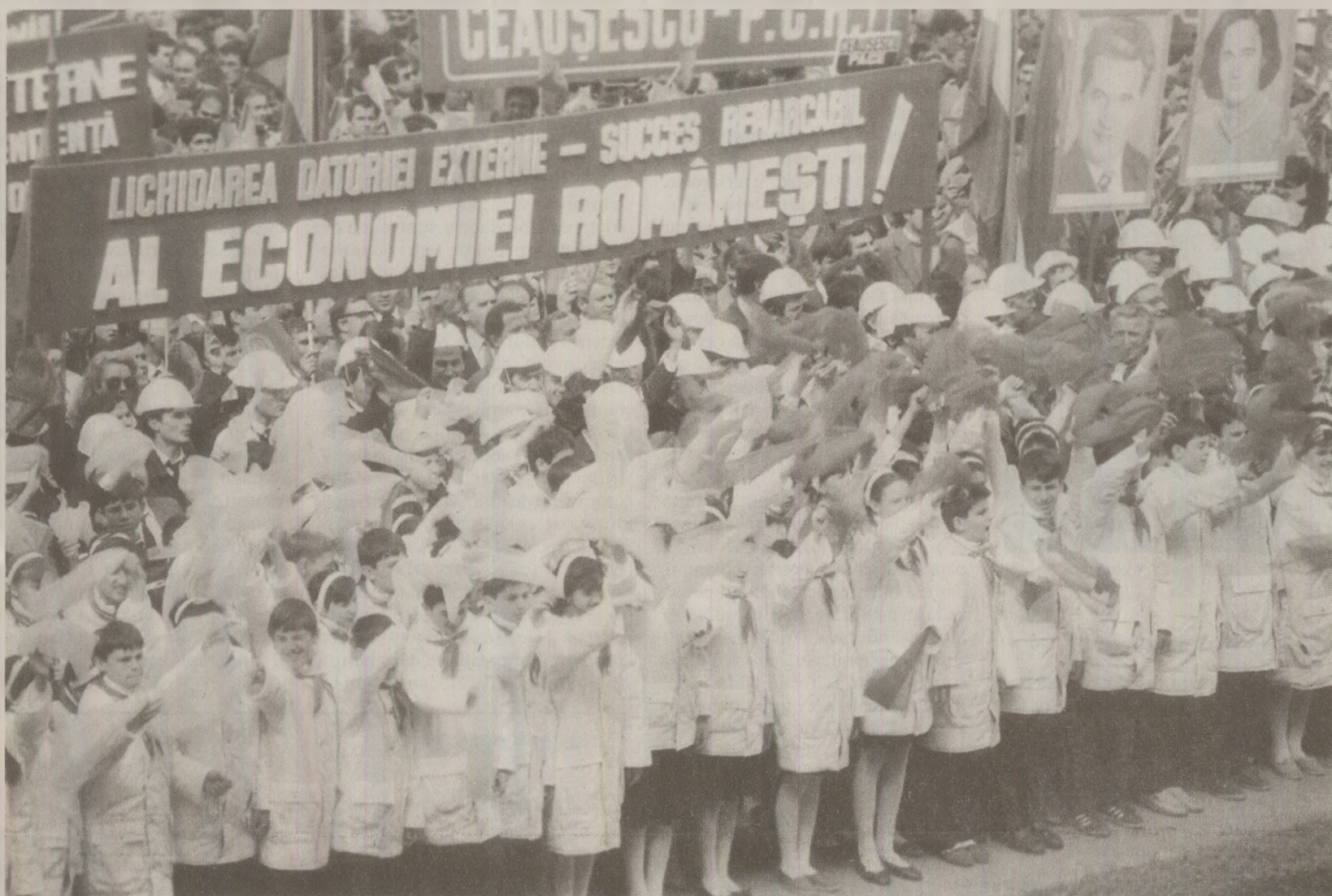
120.000 de bucureșteni au participat la mitingul din Piața Republicii organizat în cinstea lichidării datoriei externe