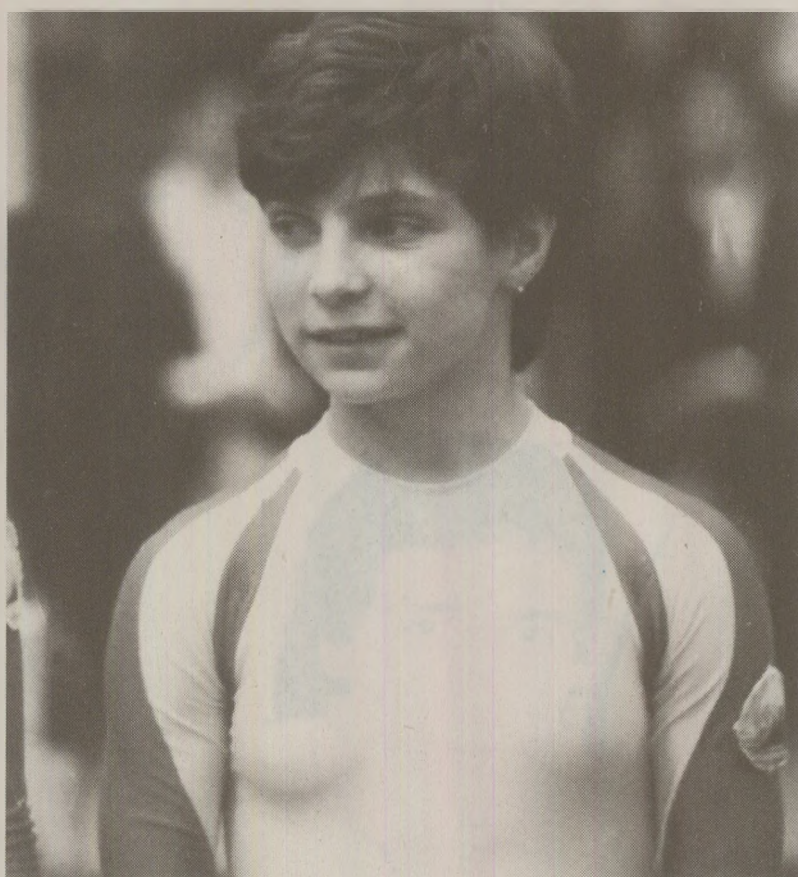
La 16 ani, la Jocurile Olimpice de la Seul din 1988, Daniela Silivas a cucerit șase medali, dintre care trei din aur.

Nu mi-e greu să spun de ce așa alege o fotografie cu echipa. Poate în nici un alt sport evoluțiile individuale nu sunt atât de legate de atmosfera și de starea de spirit a întregii echipe. Fiecare dintre noi a început gimnastica într-o clasă de elevi și de pe băncile unei școli. Poate de aceea, concursurile, oricât de dificile și pretențioase ar fi, nu schimbă cu nimic purtarea ce trebuie să o avem. Chiar așa spune că, în școală, degeaba ai 10 la tezele de matematică și română dacă ai nota scăzută la purtare. În gimnastică, această notă face parte din concurs, orice probă începând și sfârșind, de fapt, cu salutul către arbitri și public. Adică ceea ce în alte sporturi poate fi un gest formal, adesea uitat, la noi este inclus în competiția propriu-zisă: ne întrecem și în modul în care știm să fim politicoși față de cei care ne apreciază evoluția — cu note sau cu aplauze.