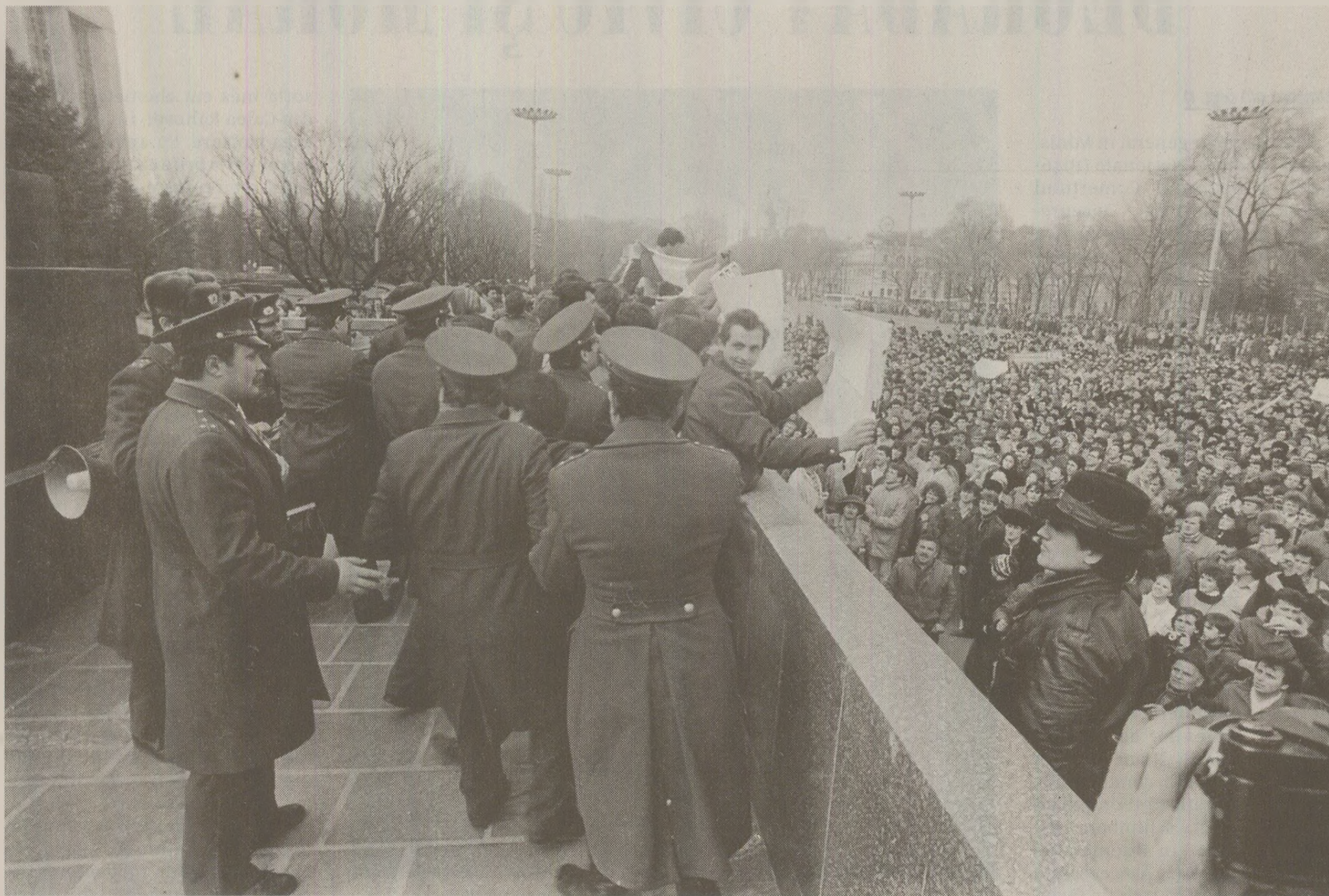
Pentru a împărșia demonstrații strănsi în fața clădirii Comitetului Central de la Chișinău, forțele de ordine moldovenești „au recurs ilegal la gaze”

Anterior unui incident de la Tbilisi (Georgia), în care se pare că trupele au utilizat gaze toxice împotriva demonstrațiilor, unități ale Ministerului de Interne al URSS, echipate cu gaz, au fost desfășurate la demonstrațiile de la Chișinău, capitala RSS Moldovenești. Potrivit unor acuzații care s-au făcut auzite pentru prima dată la 15 aprilie, trupele Armatei Sovietice din Ministerul de Interne au folosit gaze toxice împotriva demonstrațiilor de la Tbilisi, Georgia, la 9 aprilie; la fel anterior, în Chișinău. Nici o urmare nu a fost însă raportată. Trupele din Chișinău se pare că au aparținut tot Ministerului de Interne sovietic (MVD). Relatarea de la Chișinău a apărut pentru prima dată în săptămânalul Uniunii Scriitorilor