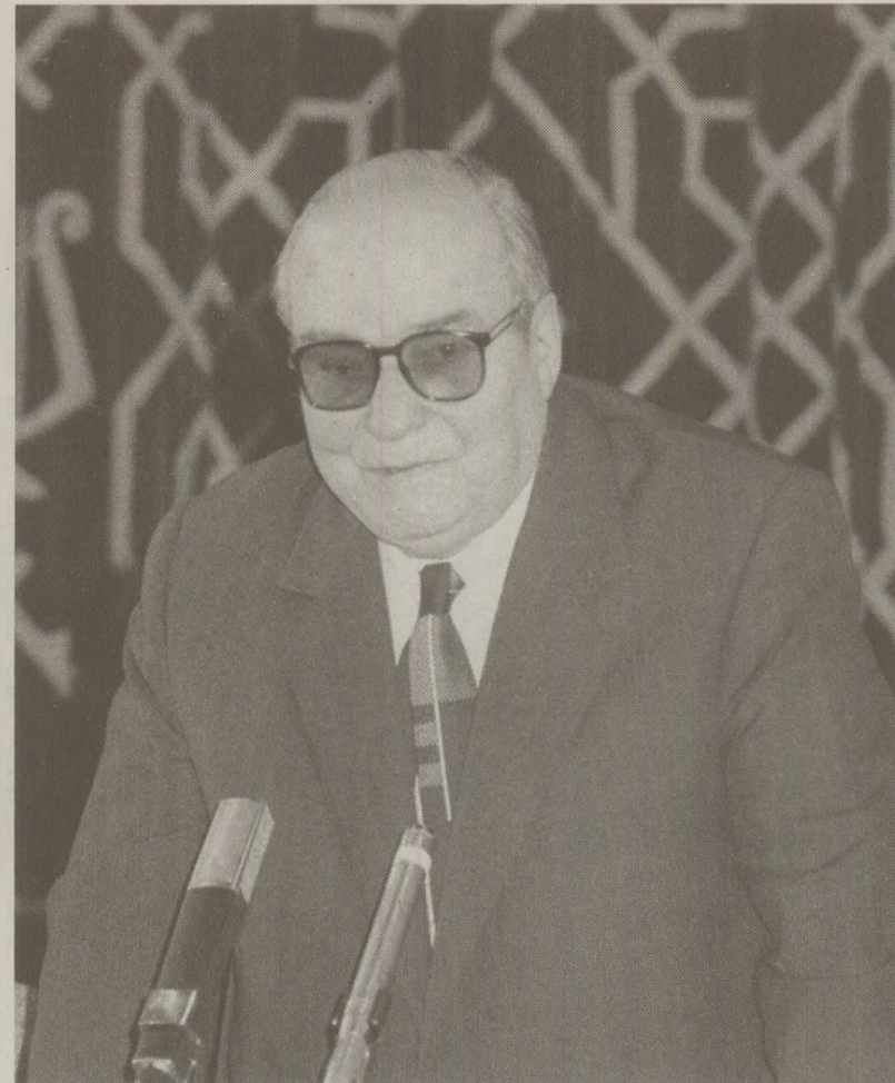
Fostul reprezentant al României în CAER în etapa desprinderii de sub controlul sovietic era un proscris în 1989

De altfel, difuzarea scrisorii la Radio Europa Liberă a fost pentru