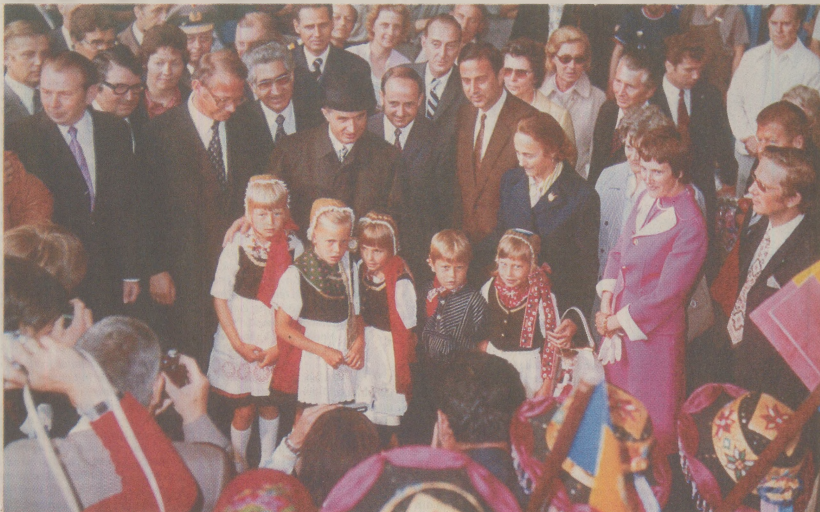
Ziaristi de la Der Spiegel îl suspectau pe Ceaușescu că în timpul vizitelor în RFG semnase contracte de fabricare a rachetelor cu firme vest-germane

În revista săptămânală Der Spiegel din Republica Federală Germania au fost publicate în primăvara anului 1989 două articole referitoare la o acțiune strict secretă desfășurată în România, în care au fost implicați specialiști ai companiei vest-germane „Messerschmitt-Bölkow-Blohm” (MBB). Conform celor care au lansat știrile respectivă (falsă, în opinia noastră), Nicolae Ceaușescu a primit ajutor din partea firmei MBB pentru construirea unei fabrici de rachete „Condor II” în România.