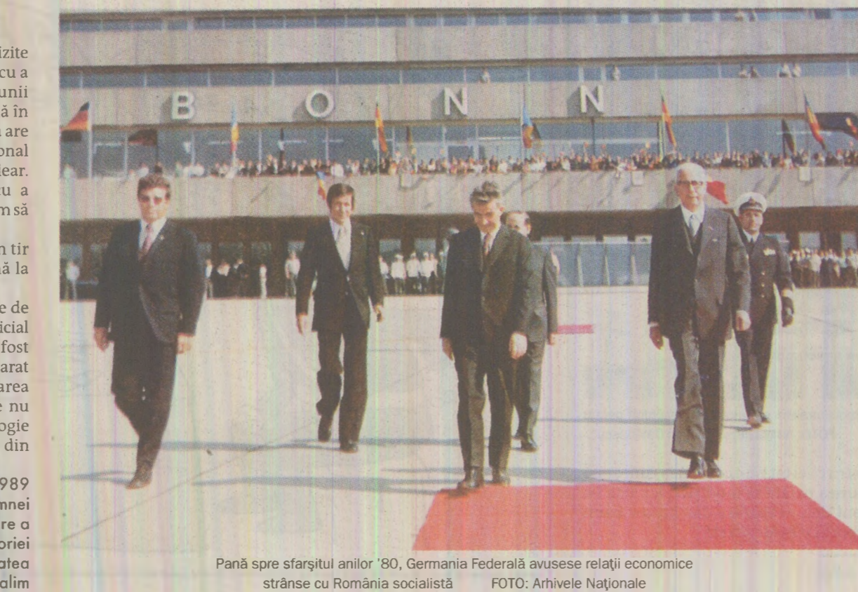
Până spre sfârșitul anilor '80, Germania Federală avusese relații economice strânse cu România socialistă

„Der Spiegel” scrie că în timpul unei vizite oficiale la Cairo, președintele Ceaușescu a tratat cu egiptenii construirea versiunii românești a rachetei „Condor-2”. Până în prezent se consideră că această rachetă are un tir de 1.000 km și un focos convențional în greutate de 500 kg, sau un focos nuclear. La 14 aprilie, președintele Ceaușescu a declarat că „România este capabilă acum să producă armament nuclear”. „Der Spiegel” scrie că racheta are un tir care îi dă posibilitatea să ajungă până la Moscova. Aceste dezvăluiri au provocat o stare de derută la Bonn. Un purtător de cuvânt oficial a dezmințit că tehnologia germană a fost vândută României. Comentarii au declarat că acest scandal intensifică indignarea Statelor Unite față de Germania care nu împiedică transferarea de tehnologie nucleară blocului răsăritean și țării din „lumea a treia”. Viața noastră (Israel), mai 1989. Articol primit prin bunăvoința doamnei Ditzo Goshen, coordonatoarea a Centrului de Studiu și Cercetare a Istoriei Evreilor din România de la Universitatea Ebraică din Ierusalim