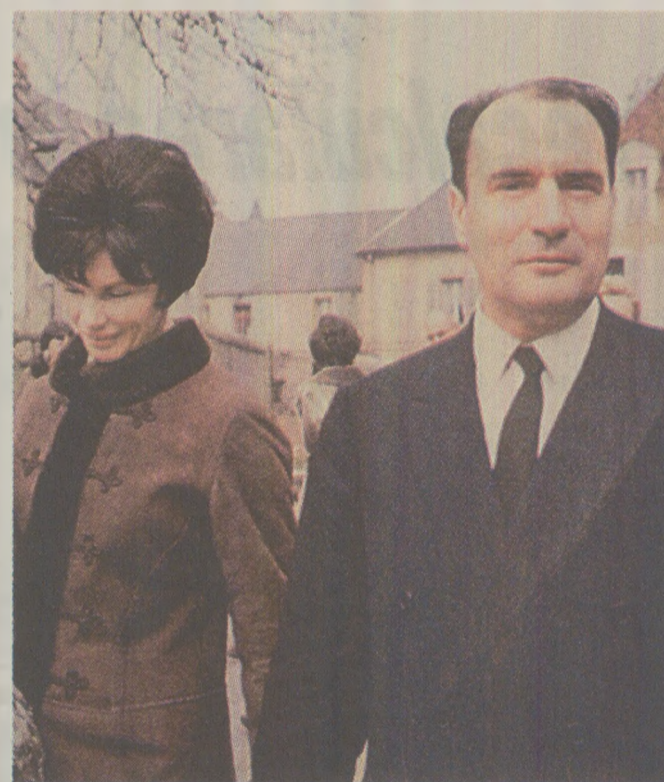
Prin organizația France Liberté, Danielle Mitterrand (foto stânga) miilita pentru respectarea drepturilor omului în țările din „blocul comunist”

Mecanismul de care e vorba mai sus, înființat în ianuarie, prevede că un stat poate atrage atenția celorlalte state membre ale CSCE asupra unor situații și cazuri, ținând de dimensiunea umană”. Astfel, Alois Mock, ministrul de Externe al Austriei, va evoca violarea drepturilor omului - cu exemple concrete - în fața reuniunii care va avea loc la Paris, la 30 mai a.c. Lupta (Paris), nr. 122/1989