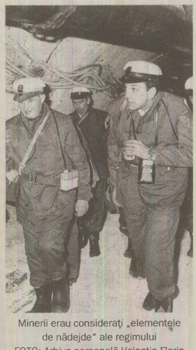
Minerii erau considerați „elementele de nădejde” ale regimului