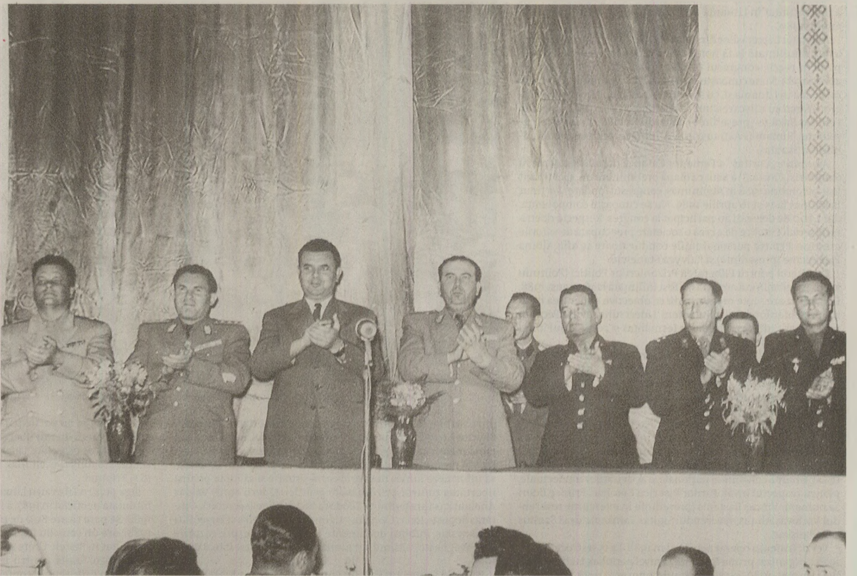
În urmă cu trei decenii, în 1958, sovieticii decisese să retragă armatele staționate în România. Profitând de această situație, în anii '80, Nicolae Ceaușescu propunea, ori de câte ori avea prilejul, „desființarea concomitentă a tuturor bazelor militare străine existente pe teritoriul altor state”

În concluzie, putem afirma faptul că nu a existat o