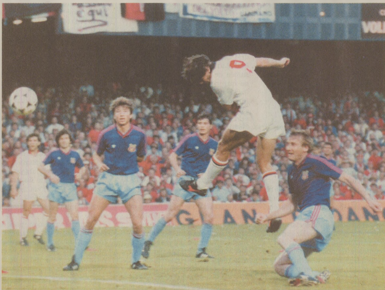
Van Basten a făcut ce a vrut cu defensiva steliștă

La ora finalei de la 24 mai, peste 97.000 de suporteri, majoritatea ita-