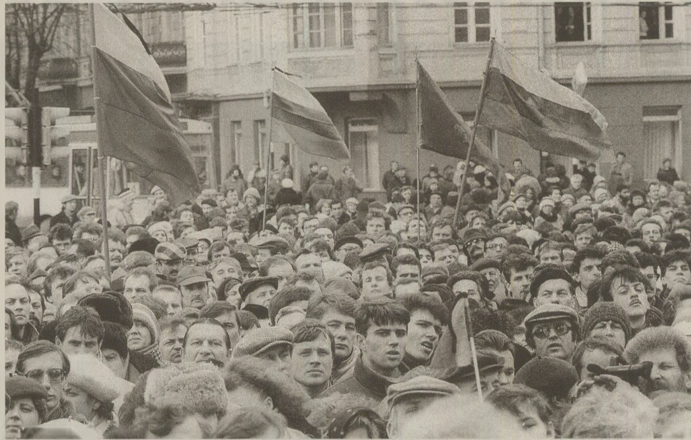
Majoritatea mișcărilor independente din Lituania erau concentrate în capitala țării, Vilnius

Asociația Internațională pentru Drepturile Omului, Biroul