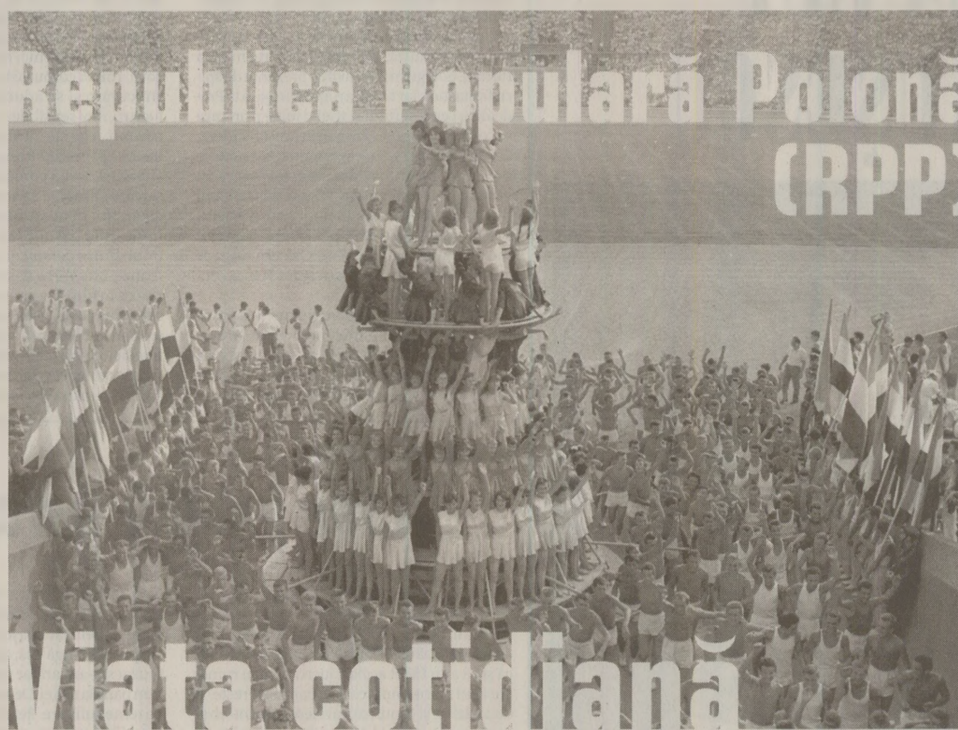
În timp ce oficialii regizau spectacole propagandistice, polonezii s-au grupat în mai multe organizații de opoziție

Comitetul pentru protejarea drepturilor pensionarilor și ale persoanelor cu dizabilități (Komitety Obrony Praw Emerytow, Rencistów i Niepełnosprawnych) a fost înființat la 14 mai 1985 la Katowice.