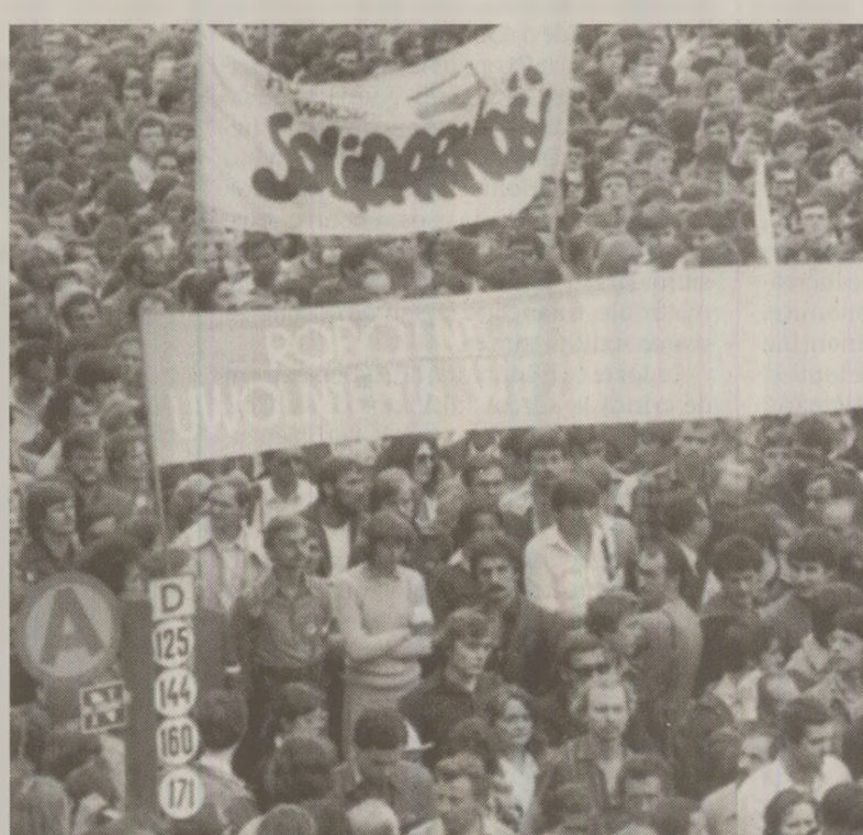
Diplomații români informau Centrala de la București că „Solidaritatea” este finanțată din fonduri occidentale

Document din volumul: Dosarul Brucan. Documente ale Direcției a III-a Contraspioaj a Departamentului Securității Statului (1987-1989), Iasi, Editura Polirom, 2008, p. 656-657