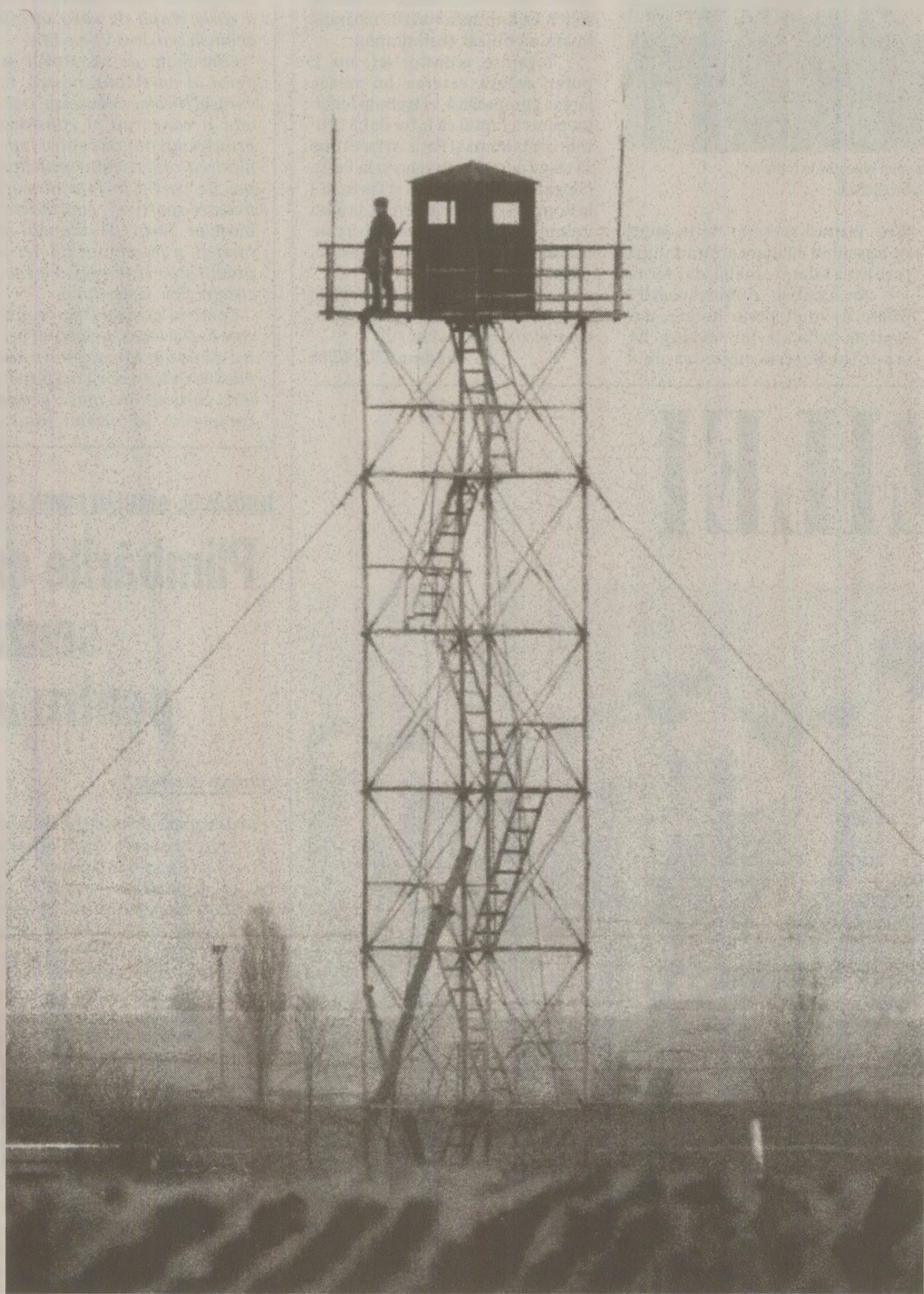
În 1989, trupele de grăniceri nu aveau de înfruntat doar tentativele de trecere frauduloasă a frontierei de către „trădătorii de țară”. Uneori, chiar colegii lor erau atrași de „mirajul” capitalismului.