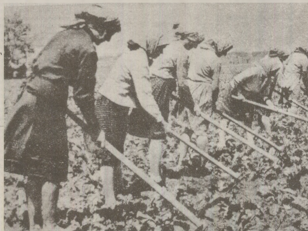
Ziarele susțineau că lucrările agricole de vară erau în toi