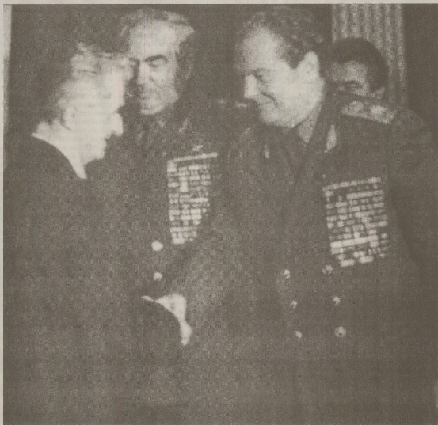
La întâlnirile cu liderii Tratatului de la Varșovia, Nicolae Ceaușescu încerca să se remarce promovând o „politică de pace”