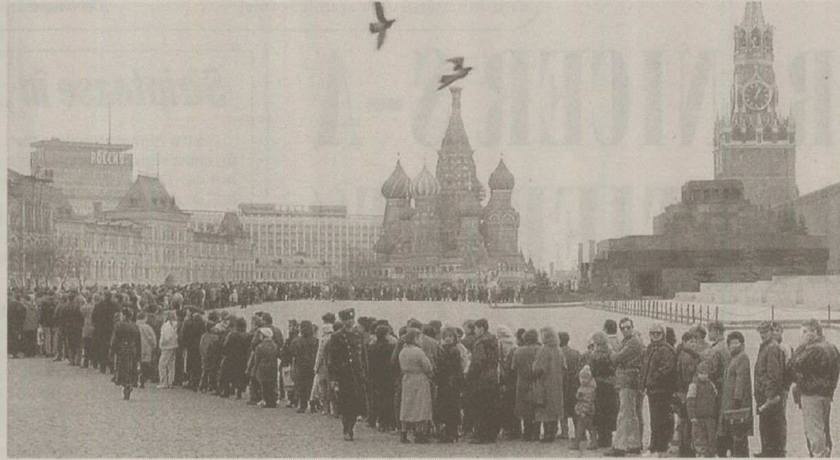
Din lipsă de fonduri, jurnaliștii de la „Scinteia tineretului” făceau reportaje despre obiectivele turistice ale Moscovei din birourile lor de la București