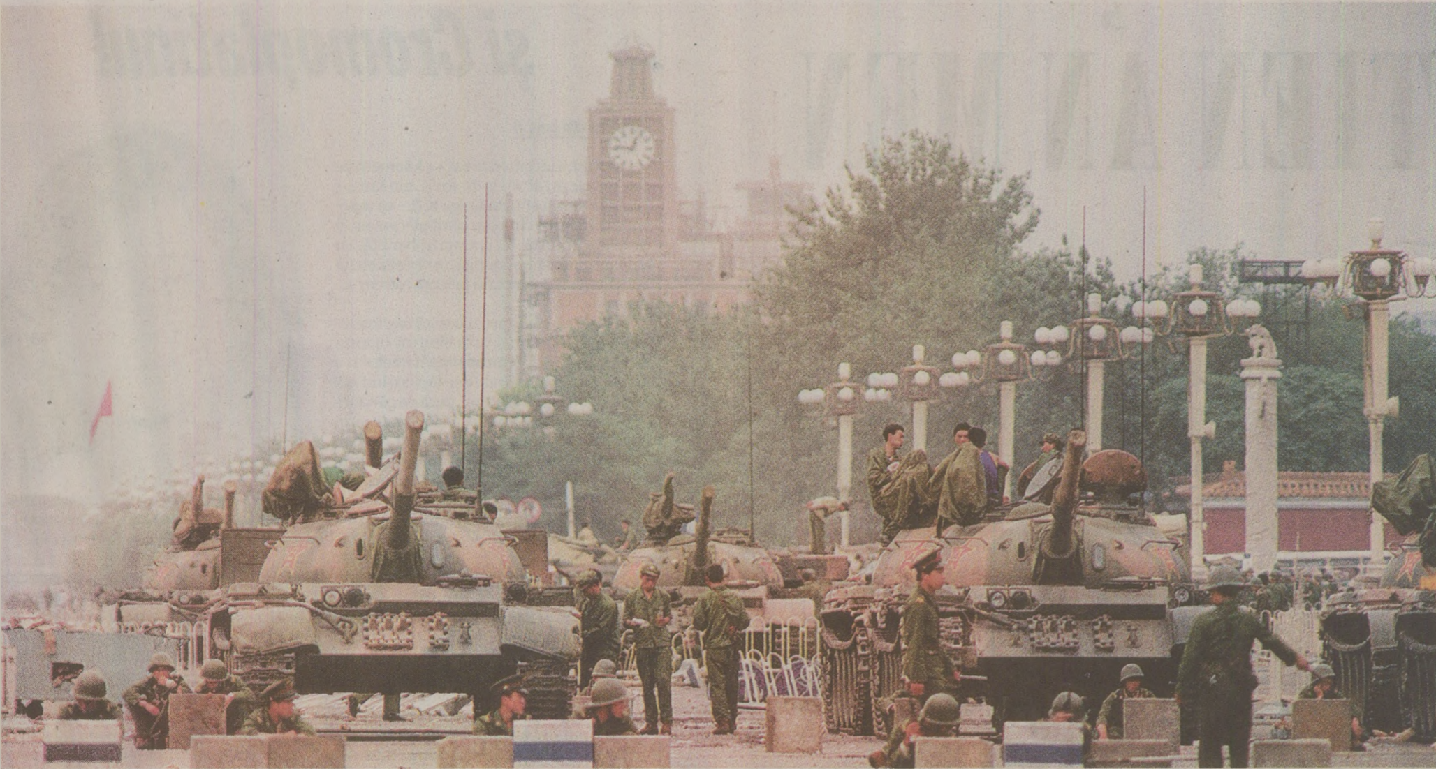
A treia primăvară de la Beijing a fost reprimată cu tancurile, după modelul folosit de Uniunea Sovietică, în 1968, cu Cehoslovacia