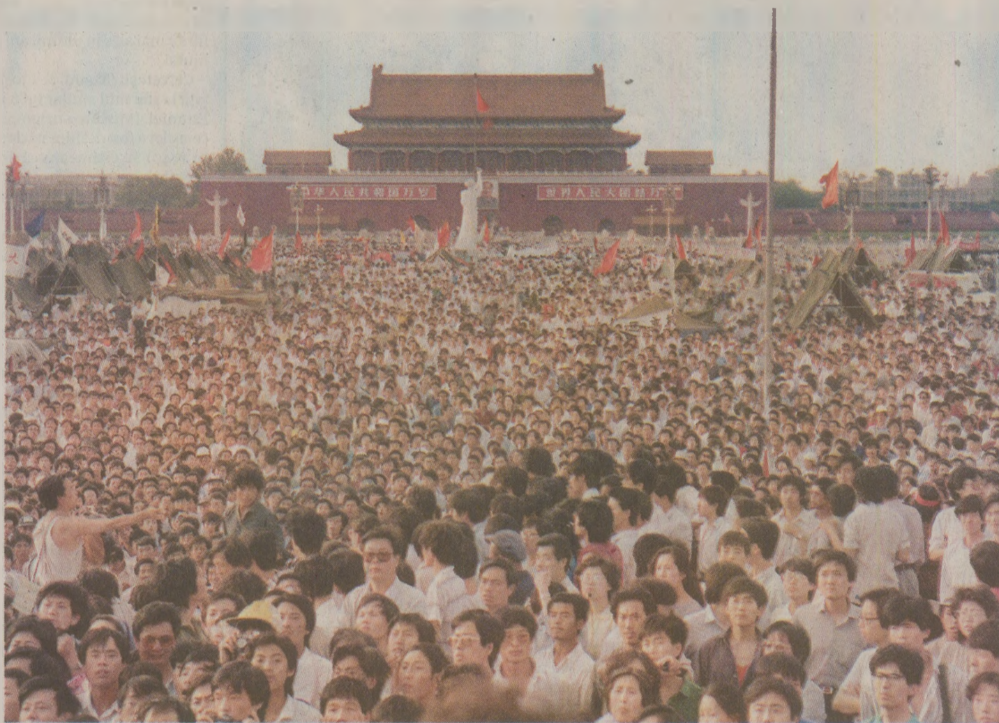
În opinia lui Ceaușescu, revendicările democratice ale chinezilor erau o „rebeliune contrarevoluționară organizată după un plan prestabilit”

Problemele sunt destul de complexe, acum în unele țări sunt multe teze, multe discuții care, din nenorocire, dăunează ale tuturor – nu în diferite colective. Organul care hotărăște este consiliul de conducere și se poate specifica chiar că s-a discutat în consiliul de conducere, că s-a aprobat în unanimitate sau cu majoritate, dacă au fost obiective și o poziție mai fermă față de teze și concepții capitaliste, lichidatoriste, cum este și aceea despre așa-zisa de ideologizare a relațiilor internaționale, despre faptul că lupta de clasă nu mai are aceeași importanță ca în trecut, nevăzându-se faptul că cercurile imperialiste tocmai chiar inten-