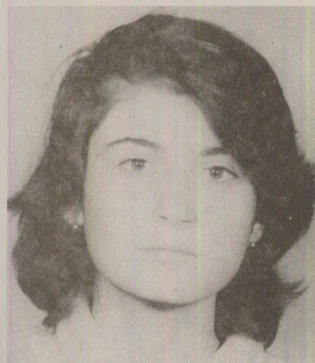
În lipsă de produse cosmetice, domnișoarele epocii se făceau frumoase după posibilități. Nu întotdeauna improvizările reușeau...

După vreo lună, într-o pauză, în timp ce stăteam la taifas cu colegele, mi-a trăsniț altă idee – ce-ar fi să-mi fac părul violet? Le povesteam despre iaiaca – bunica mea grecoaică, mama lui tata. Aveam 7 ani când s-a dus, dar tot îmi amintesc cât îmi plăcea părul ei buclat, argintiu-violet, care se zărea de sub