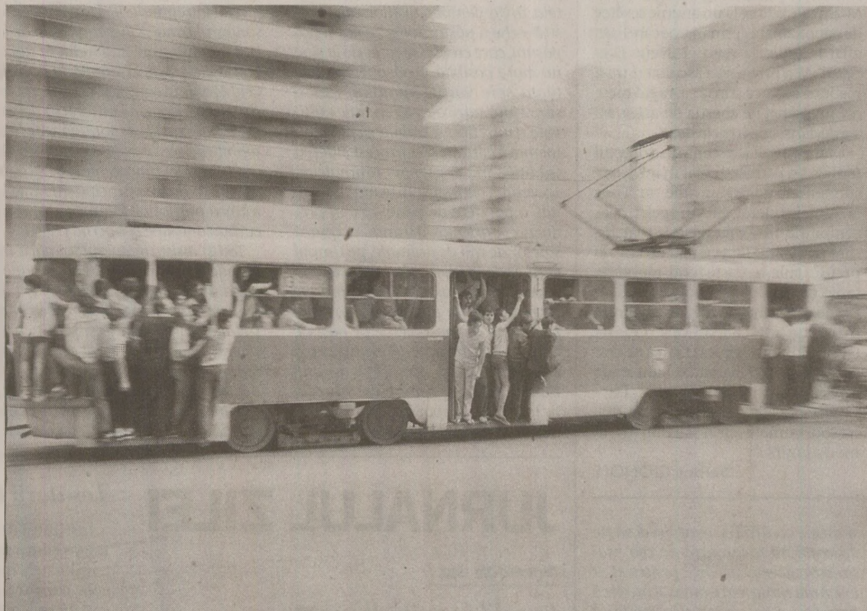
În 1989, transportul public din București era plin de neajunsuri: parcul de mașini era învechit, piesele de schimb erau raționalizate, iar din cauza economiilor la energie călătorii mergeau pe scara tramvaiului, cu ușile deschise.