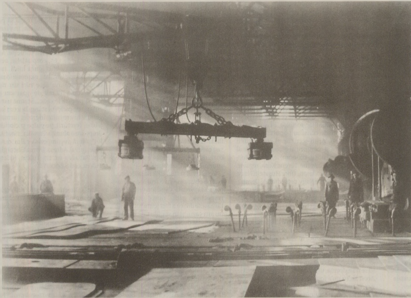
Uzinele 23 August, Faur, Republica erau considerate simboluri ale industriei românești. În 1989, nu se mai spunea că inițial îi aparținuseră lui Nicolae Malaxa