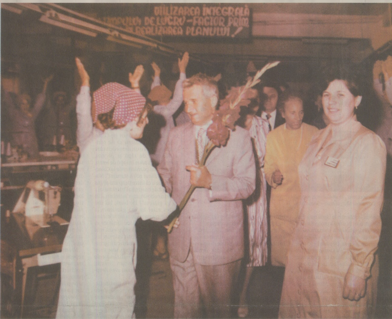
În iunie '89, atât naționalizarea cât și succesele industriei românești erau prezentate ca fiind meritele exclusive ale lui Ceaușescu.