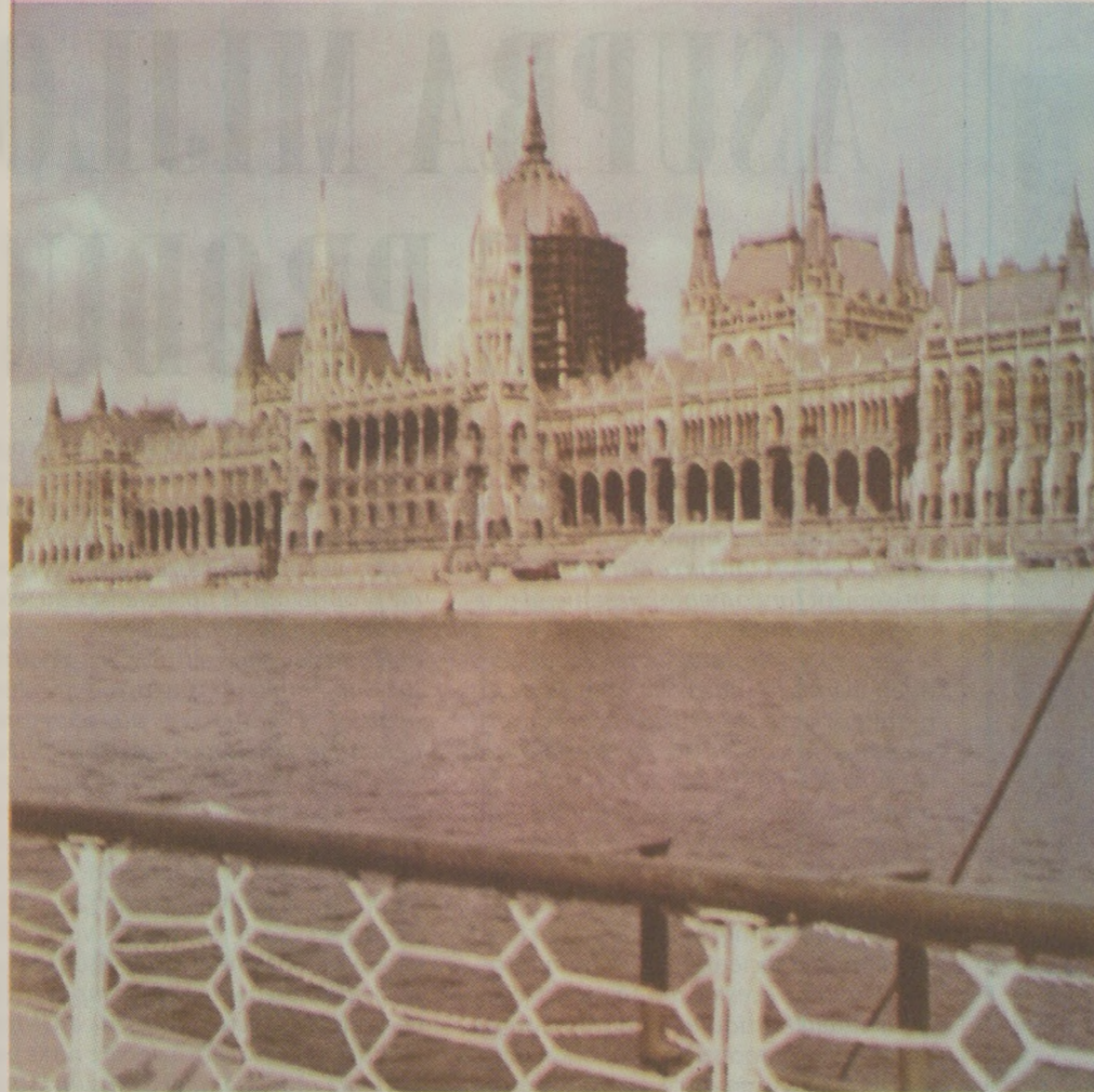
În iunie 1989, la Budapesta, membri din conducerea partidului comunist participau la ședința de constituire a unei formațiuni intitulată „Mișcarea pentru o Ungarie Democratică”

Vorbind despre noua organizație ca despre o mișcare chemată să sprijine crearea noului stat al democrației și justiției, sub semnul alegerilor libere, ministrul de stat a îndemnat să nu se ofere teren de acțiune forțelor extremiste și celor care doresc răzbușarea, dar nici înclinărilor dictatoriale. El a subliniat că „în Europa nu este permisă folosirea forței în atingerea nici unui scop”, arătând că „deși numeroase persoane sunt cuprinse de amărăciune, trebuie să le se atragă atenția că răzbușarea nu este compatibilă cu maturitatea politică a poporului”. „Mișcarea pentru o Ungarie democratică”, a declarat vorbitorul, își propune să acționeze sub egida împăcării generale, libertății și solidarității. Ea nu este propice și nu trebuie folosită în slujba unor dispute între partide, nu dorește să devină