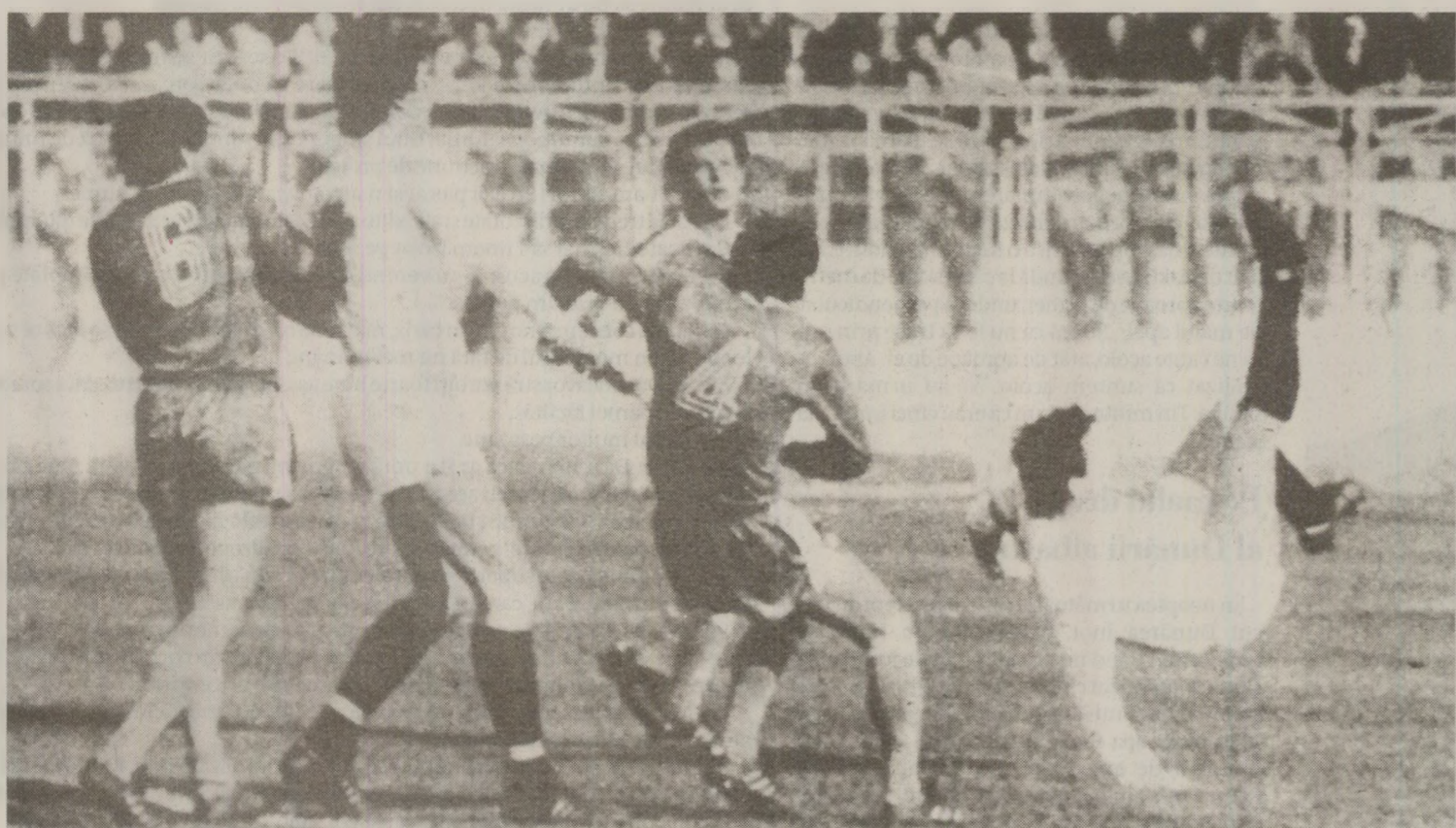
Lupta pentru promovare în Divizia A s-a dat până spre finalul sezonului

Șsalonul secund a avut dintotdeauna farmecul lui. Poveștile susțin că au existat câteva echipe care nu și-au dorit să promoveze pe prima scenă. Este vorba despre Metalul București și Gloria Bistrița, însă ultima a făcut în cele din urmă pasul cel mare în primăvara anului 1990. Metalul însă nu, în momentul de față nemaiexistând ca echipă, deși s-ar fi putut duela lejer cu Steaua, Dinamo și Rapid. În cele din urmă, Metalul, echipa cartierului Panteimon, a ajuns în „C” și, în final, s-a desființat. Dar până atunci, la finele sezonului 1988-1989, la capătul unor dispute strâns, în Divizia A, din cele trei serii, au urcat Petrolul Ploiești, Jiul Petroșani și Politehnica Timișoara. În Seria I, ploieștenii au avut opoziție din partea Progresului Brăila până spre final, însă s-au impus în cele din urmă. Retrogradeate au fost FEPA 74 Bărlad, ASA Câmpulung Moldovenesc și Delta Tulcea, ultima reușind totuși, după 20 de ani, să revină în prim-planul fotbalului românesc,