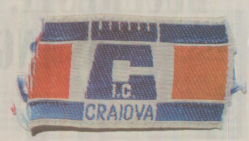
I.C. Craiova producea îmbrăcăminte accesibilă tuturor buzunarelor românilor