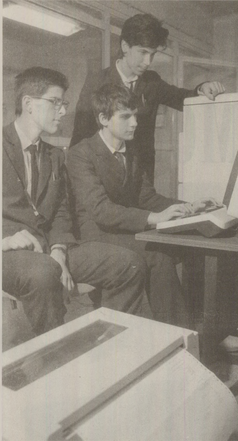
Programatorii erau atenți la fiecare octet și instrucțiunile, iar programele erau testate și verificate de mai mulți specialiști.