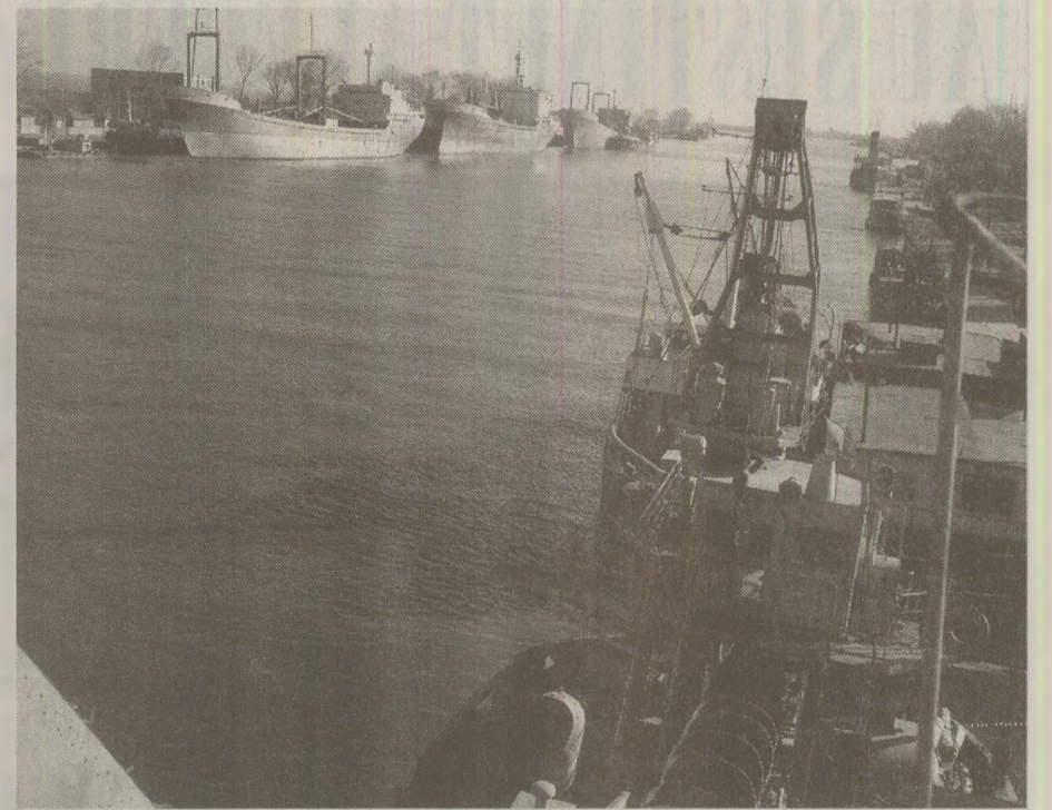
La Sulina, poți ajunge doar pe Dunăre sau Marea Neagră