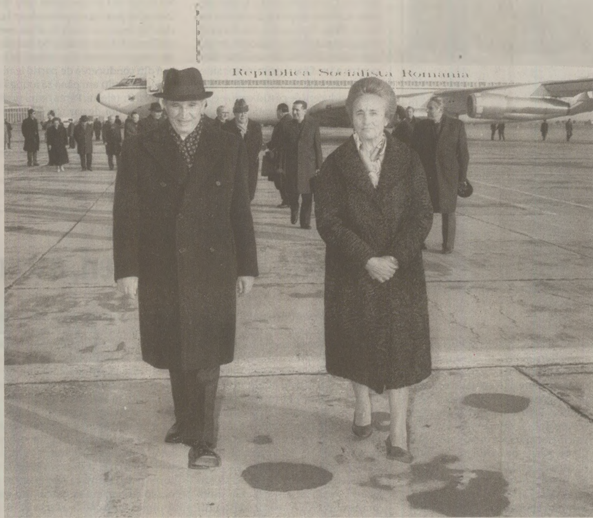
Nicolae și Elena Ceaușescu pe aeroport, imagine clasică în presa comunistă

Exercițiu de imaginație: închipuți-vă un Nicolae Ceașescu transpirat, târând după el geamantane imense cu bagaje, cu bilețul de avion în dinți, înghesuit printre călătorii din Aeroportul Internațional Otopeni în așteptarea unui avion care să-l ducă într-o țară de la capătul lumii. O scenă de teatru absurd care nu s-a petrecut, bineînțeles, niciodată. „Nea Nicu” era șef de stat și niciăieri în lumea asta șefii cei mari nu se amestecă, pe aeroport, cu oamenii obișnuiți. Ne place sau nu, în fața lumii, el era pe atunci cel mai înalt reprezentant oficial al țării noastre. Poziție de vârf ce-i oferea un statut aparte. Aici, acasă, momentul în care „avionul prezidențial” își desprindea roțile de pe betonul pistei marca încheierea unor proceduri complexe care,