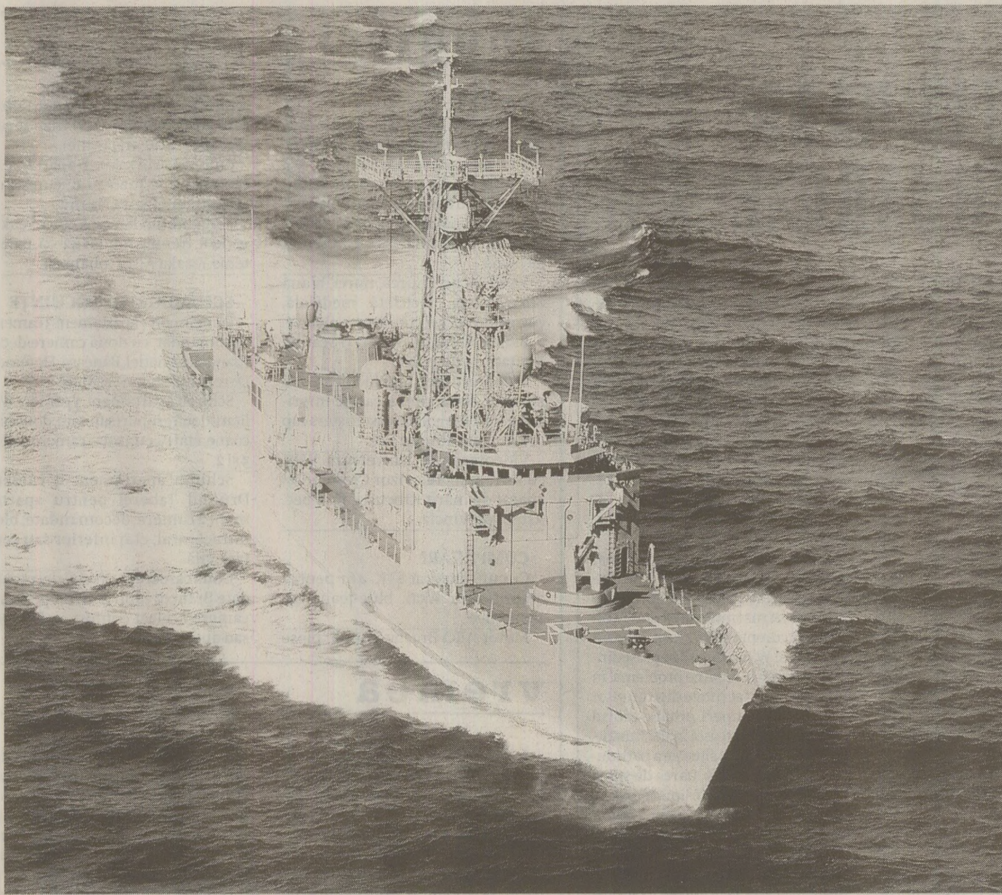
În 1989, fregata americană Klaking a acostat și în portul Constanța