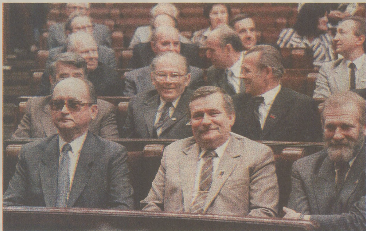
W. Jaruzelski (primul din stânga) și L. Walesa (în mijloc), „elevii” sărguincioși la „școala” democrației poloneze. Fotografie-document din timpul alegerilor din iunie 1989

Când Seimul nu acceptă propunerea Senatului acest lucru se va putea face cu condiția să obțină votul a 2/3 din deputați, în prezența a cel puțin jumătate din numărul total de deputați. După alegeri și publicarea rezultatelor lor, a diferitelor aprecieri și declarații ale forțelor ce au participat în campania electorală, toată atenția se îndreaptă asupra alegerii președintelui țării, a numirii primului-ministru și formării guvernului, probleme deosebit de complicate ca