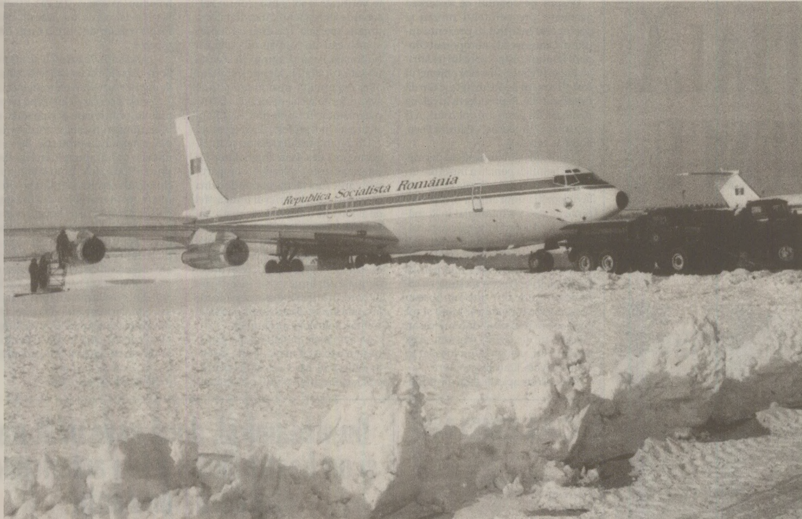
Aeronavele „Flotilei Speciale” l-au purtat pe Nicolae Ceaușescu pe mai toate meridianele globului