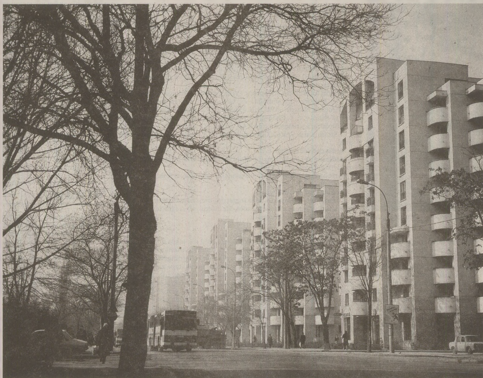
Pentru că municipiile reședință de județ erau orașe „închise”, nici CEC-ul nu mai dădea credite pentru cumpărarea de locuințe în respectivele localități

Mulți români și-au cumpărat apartamente cu banii de la CEC până în 1989. Între 1970 și 1987, statul a încurajat și proprietatea particulară, prin reglementarea construirii de locuințe proprietate personală cu sprijinul statului, conform articolului 2, legea 4/1973 referitor la vânzarea de locuințe din fondurile statului. În privința prețurilor acestea au fost reglementate inițial prin HCM nr.146/1960, privind unele măsuri de proiectare și execuție a construcției de locuințe și HCM nr.127/1968 prin care se fixau prețuri plafon pentru apartamente. În anul 1976, prin Decretul nr.447 se stabileau prețurile limită ale locuințelor care se construiau din fondurile statului, cât și prețurile de contractare a locuințelor proprietate personală care se executau cu sprijinul statului prin creditul acordat. În decret se stabilea că prețurile sunt unice, determinate pe tipuri de apartamente cu numărul de camere stabilite prin decizia Consiliului de Stat nr.68/1975. Erau precizate clar fi-nisajele și suprafețele aferente. De asemenea se limita beneficiul maxim al întreprinderii constructoare de locuințe la 6% din valoarea totală a cheltuielilor din deșez, iar comisionul unității prin care se contracta apartamentul era de 1% și se includea în prețul locuinței. Imediat după 1977, apare împărțirea apartamentelor după gradul de confort, începând de la „sporit” și până la confort de gradul 3. Pe de