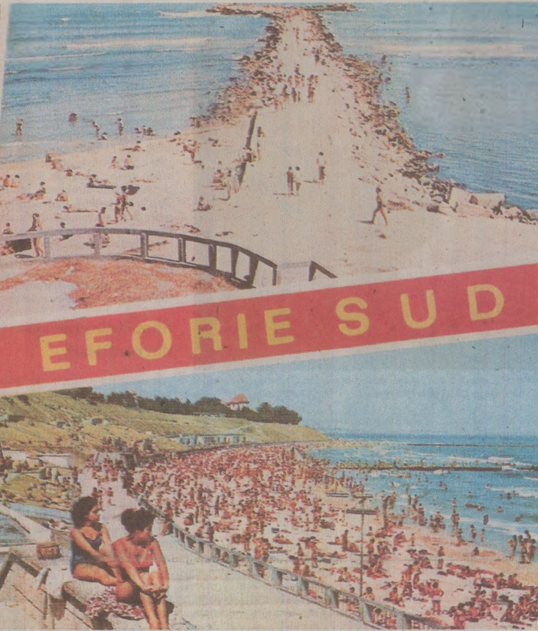
Turiști români și străini ajungeau în stațiunile de la malul Mării Negre prin intermediul Organizației Naționale a Turismului-Litoral, cea mai mare agenție turistică de stat

În 1989, ministru al Turismului era Ion Stănescu. Își începuse mandatul în octombrie '84, după ce anterior deținuse alte funcții importante: prim-secretar al Comitetului regional de Partid Oltenia (1964-1967), președinte al Consiliului Securității Statului (1968-1972), ministru de Interne (1972-1973), președinte al Comitetului executiv al Consiliului popular al județului Dâmbovița (1974-1977). Înainte de a ajunge la Turism ocupase funcția de șef al Departamentului pentru Construcții în Străinătate.