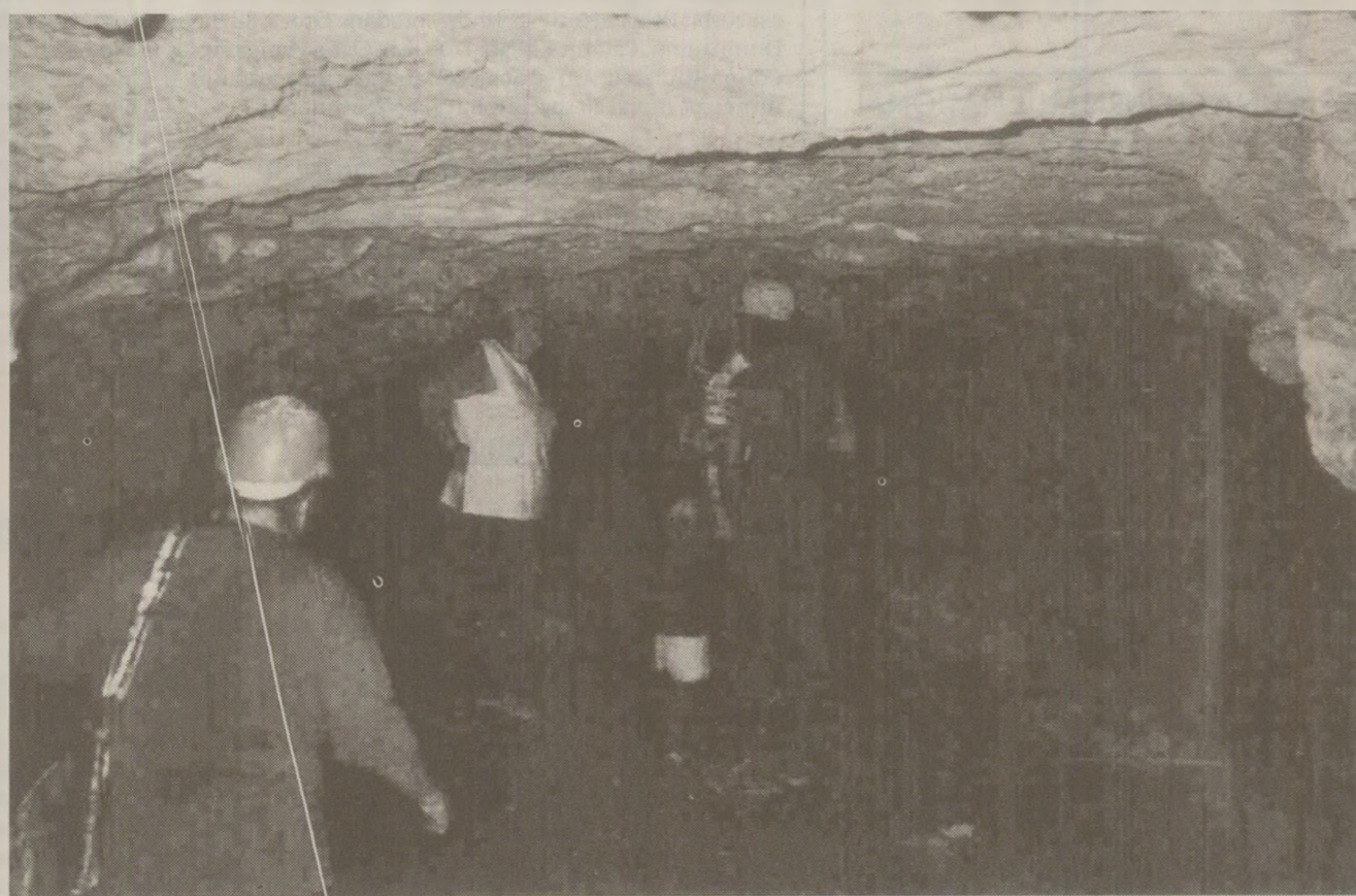
Vizitarea Peșterii Limanu se afla printre puținele curiozități pentru care turiștii din Vama Veche părăseau plaja