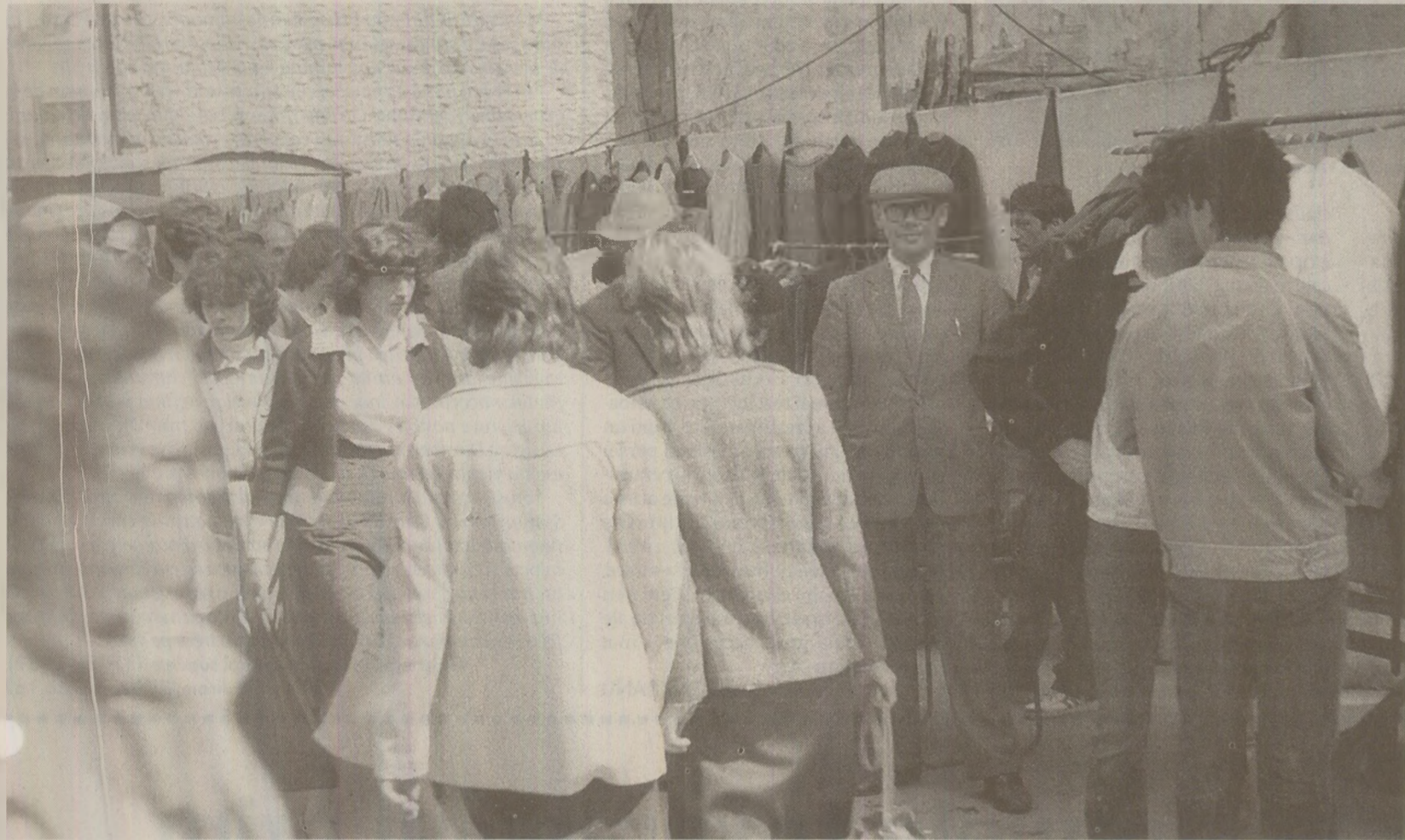
În talciocuri, printre vânzătorii de mărunțișuri, iubitorii lecturii își procurau „la negru” ediții rare și cărți interzise