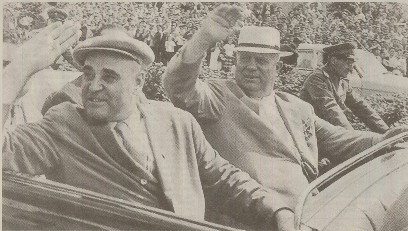
După moartea lui Stalin și venirea la putere a lui Hrușciov (foto dreapta), sovieticii au aprobat desființarea Sovromurilor