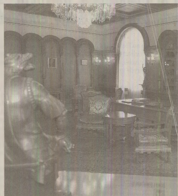
Reședința de la Snagov era preferata lui Ceaușescu pentru primirea delegațiilor străine

La Combinatul de Industrializare a Lemnului Pipera s-a ținut Adunarea Generală a Oamenilor Muncii. Din cei 30 de indicatori economici, 27 au fost realizați și depășiți, s-a