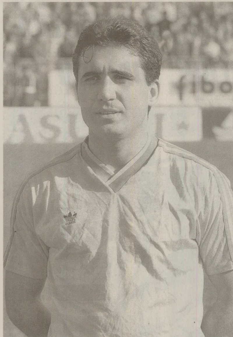
Gică Hagi a fost împiedicat de oficialii români să plece la clubul italian Bologna

multe săptămâni în anticameră un om de încredere, pe Vinicio Fioranelli; are fir direct cu Valentin Ceaușescu. Fiul, desigur. Astfel l-a curtat Bologna timp de o lună pe Hagi; când te gândești că nimic din toate acestea nu a contat. La ora actuală Bologna a renunțat la tratativele pentru Dertycia și Caniggia, a refuzat oferta specială pentru Zavarov, are doi strănieri (Iliev și Geovani), un tehnician care cere un al treilea strănieri valoros, un președinte care ar vrea să facă ceva, chiar dacă campania de abonamente a atins cota de 10.000 de carduri și se așteaptă un miliard de la sponsor. Singura lui speranță este să sune telefonul și Bucureștiul să schimbe placa. Dar cum să mai crezi așa ceva?