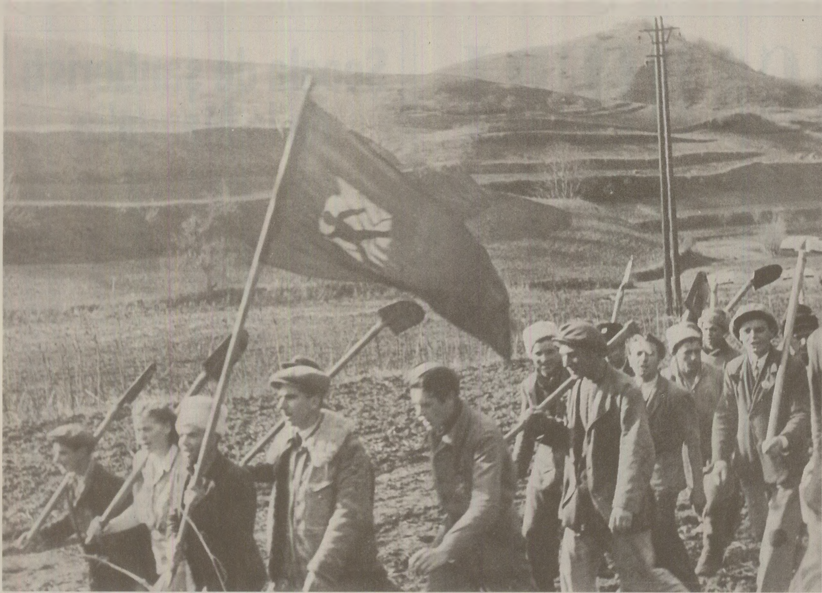
În primii ani ai comunismului, scriitorii trebuiau să-și aleagă subiectele din „realitățile patriei”, deplasându-se adesea pe „șantierul tineretului”

Asemeni gloatei peștrele plecate să cucerească vestul sălbatic al continentului american, pe șantierul declarat „ale tineretului” au mers țărani, muncitori, elevi și studenți, femei și bărbați, oameni sărmani alungați de-acasă de sărăcie, adolescenți mânați de gustul aventurii. Fiecare a perceput și a transmis mai departe experiența șantierului în funcție de ce lăsaseră acasă. Pentru unii, obișnuți cu un minimum de confort, condițiile de „baracamant”, după cum se numeau spațiile de dormit, erau iadul pe pământ. În vara lui 1948, scriitoarea Lucia Demetrius a răspuns chemării Uniunii Scriitorilor, Artiștilor și Ziaristilor și a plecat, în documentare „la Salva Vișeu. Era perioada când scriitorilor li se cerea să-și găsească subiectele „în viață”, să reflecte în opere noile realități. Călătorind cu clasa a III-a și schimbând mai multe trenuri, drumul din București până-n Maramureș a durat două zile și două nopți. La destinație, grupul format din „tovarășii artiști” a ajuns noaptea. Scriitoarea Lucia Demetrius a fost impresionată de o brigadă formată