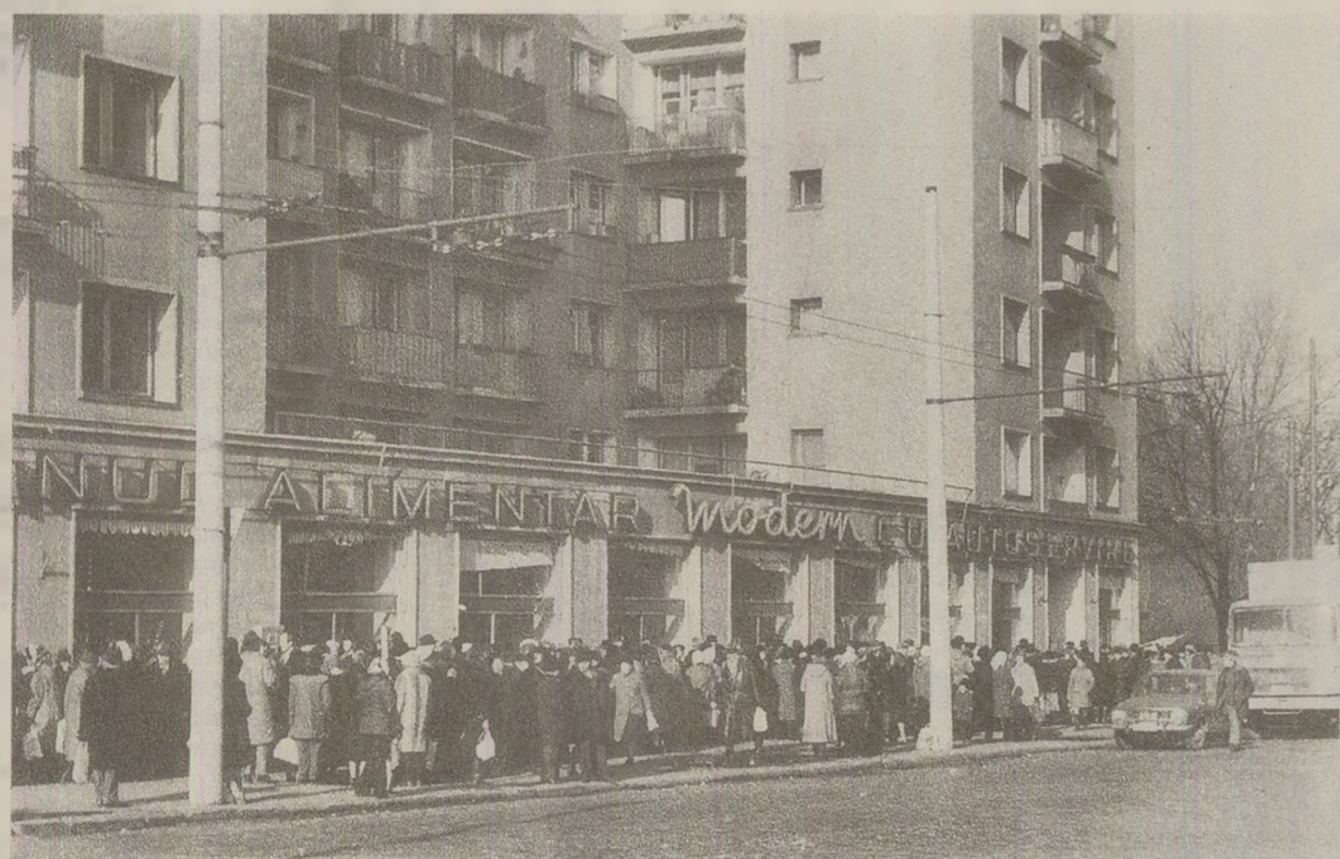
Ziarștii occidentali prognozaau că România nu va ieși prea curând din criza alimentară, iar cozile vor rămâne un „ingredient” al vieții cotidiene a românilor.

În concordanță cu această nouă politică, se planuiește ca banii destinați programelor de dezvoltare eco-