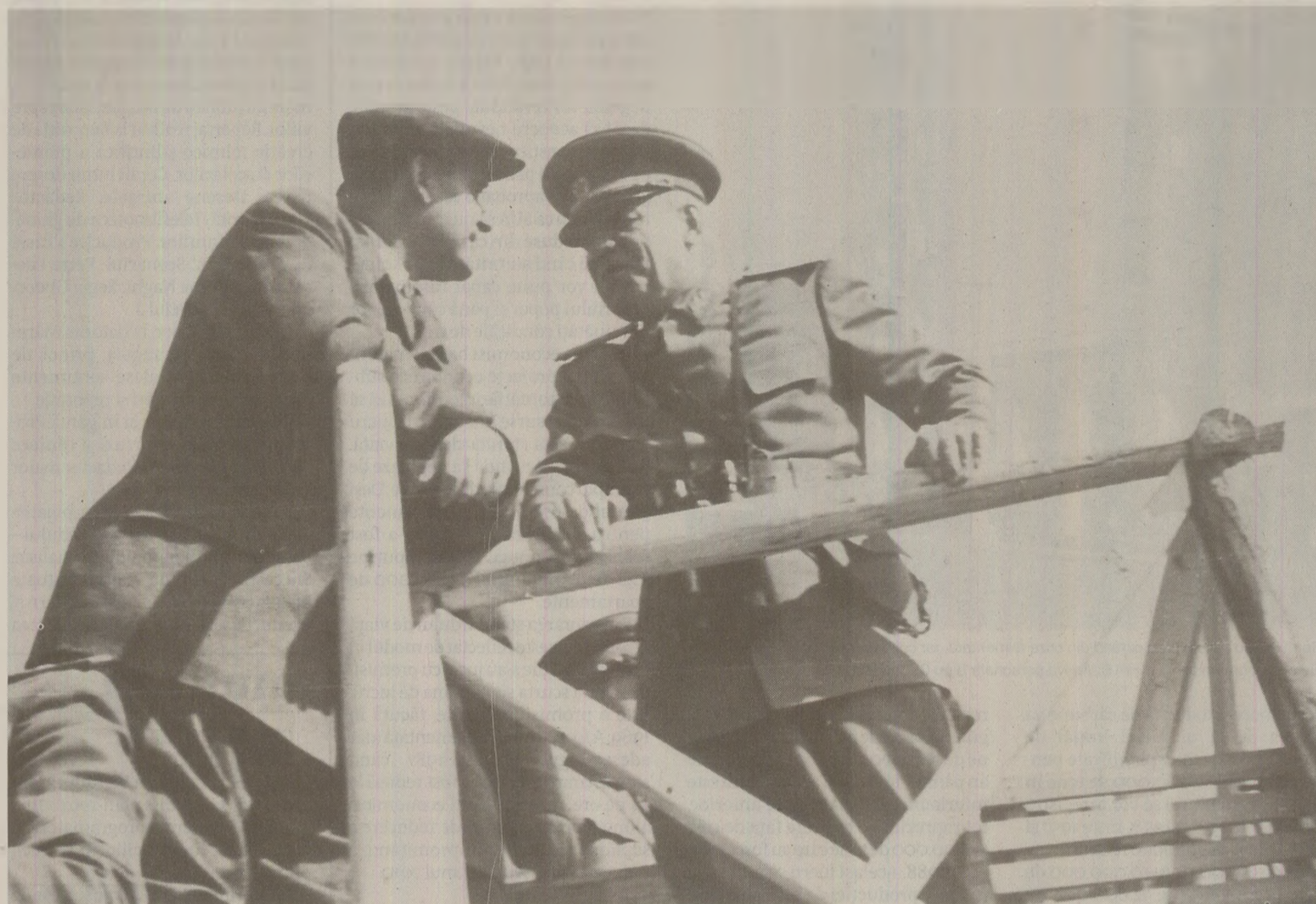
Cu ajutorul „tovarășilor sovietici”, Emil Bodnăraș și Gheorghe Gheorghiu-Dej au pus la punct un sistem de fortificații la granița cu Iugoslavia