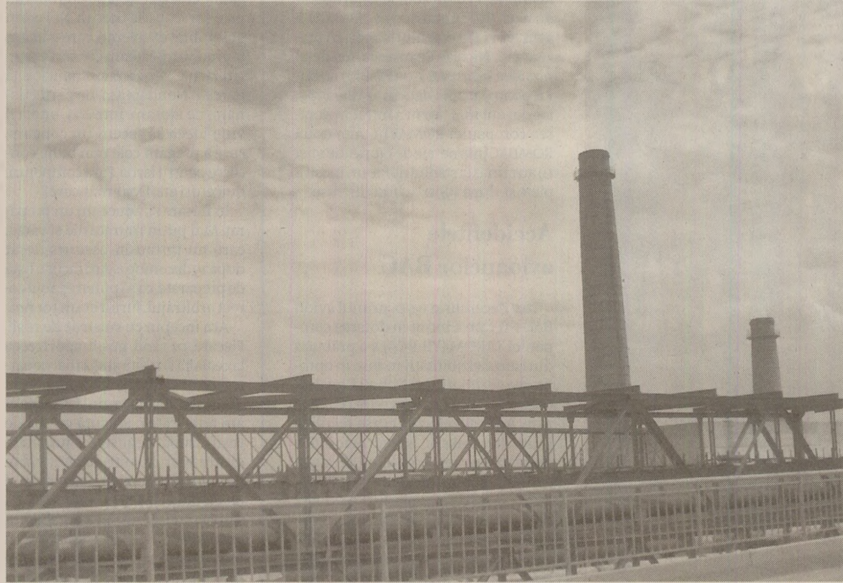
Pentru a răspunde tendințelor autonomiste manifestate de mișcarea națională a românilor din Moldova Sovietică, directorii de fabrici și-au mobilizat pe etnicii ruși din Transnistria, care au intrat în grevă cu intenția de a bloca economia

Pare ciudat, dar în Moldova Sovietică niște directori de fabrici au organizat, ieri, o grevă. Ei îi îndeamnă pe muncitorii lor să facă în curând și alte greve. Iar secretarii de partid ai fabricilor respective încurajează la rândul lor grevele. Organizatorii grevelor și participanții la ele sunt personalul de naționalitate sau de limbă rusă. Ei protestează contra proiectelor de lege care prevăd proclamarea limbii materne a moldovenilor drept limbă de stat a republicii și revenirea la grafia latină. Greva de ieri a durat două ore și a avut un caracter de avertizare. O nouă grevă de avertizare a fost anunțată pentru zilele de vin; aceasta va dura o zi întreagă. Organizatorii au mai amenințat cu greve de mare amploare în cazul în care Sovietul Suprem al republicii nu ar da curs protestului lor în chestiunea limbii de stat.