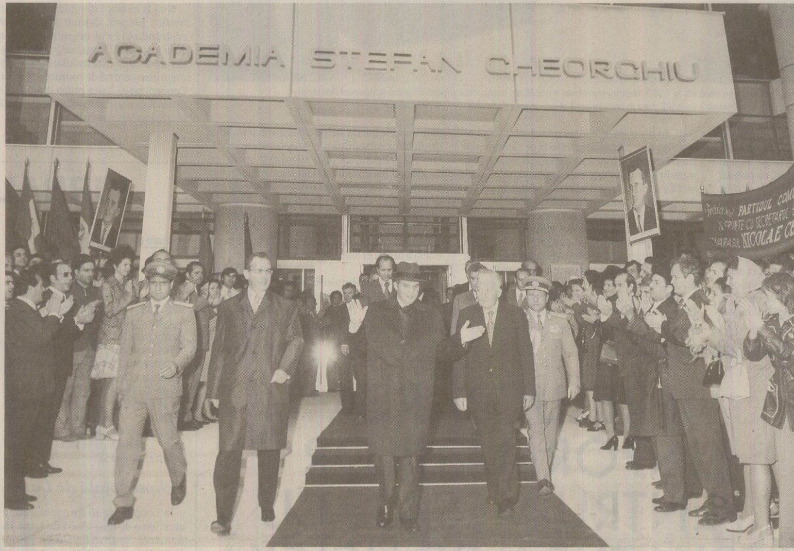
În anii '80, Academia de Înalte Studii a Partidului era cea mai bine dotată instituție din România la capitolul documentare socio-politică

Programul de lucru era foarte flexibil: nu veneai la serviciu decât în zilele de salariu, când se făceau ședințele de partid, de producție și de ODUS – o organizație care cuprindea nemembrii de partid. Ședințele durau o oră, apoi veneau banii de salarii și fiecare pleca la treaba lui. Temele de cercetare se stabileau anual, prin negocieri cu finanțatorul, Academia de Științe Sociale și Politice. Puteai face absolut ce voiai. Eu am avut teme de cercetare privind populația și așezările din Delta Dunării și nordul Dobrogei, pentru că voiam să merg la pescuit în Delta și mă interesau populațiile de lipoveni, tătari, macedoneni și turci care mai rămăseseră prin zonă. Manuscrisul mi-a fost confiscat la prima percheziție domiciliară, în iulie 1988, și n-am reușit să-l mai recuperez. În general nu aveai decât o singură temă de cercetare pe an – comparativ cu 10-12 teme pe lună, câte predăm acum la IMAS. O „temă de cercetare” însemna că trebuia să scrii 20-30 de pagini pe an despre subiectul respectiv. Pu-