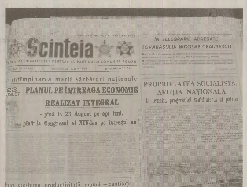
Prin creșterea productivității muncii - cantități

specific tinerele. Se recomandă, pe lângă igiena absolut necesară a pielii întregului corp, să căutam în magazine, încercând să o folosim corect, noua gamă de produse „Suav”. Este o gamă special studiată pentru această vârstă, cuprinzând o loțiune, o cremă, dar și pudră și un fond de ten pentru machiajul acestui tip de piele greu în genere de machiat. Tineretele erau sfătuite și să-și spele de părul, „fără prea mult șampon, uneori trecând doar jetul de apă caldă al dușului”. În plus, era recomandată o tensoare scurtă sau foarte scurtă, „pentru că e ușor de întreținut și pentru că reprezintă o tensoare de ultimă modă”.