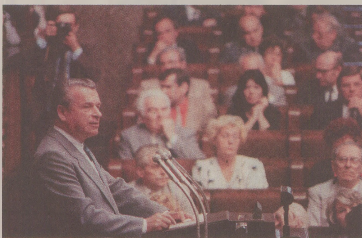
După numeroase runde de negocieri, generalul Jaruzelski a acceptat candidatura unui lider al lui Nazowiecki pentru funcția de prim-ministru

Acceptarea de Partidul Tărănesc și Partidul Democrat de a intra în noua coaliție cu opoziția pentru a forma un nou guvern a accentuat și mai mult starea de spirit din rândul membrilor de partid care au primit