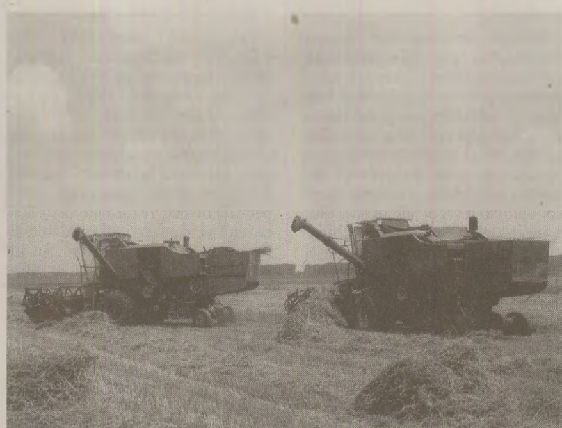
Secretarul general era informat și despre cifrele de producție nesatisfăcătoare

Din cercetarea unor sesizări a rezultat că această situație se datorează nerespectării tehnologiilor pentru fiecare cultură, neexecutării la timp a lucrărilor de întreținere și recoltare, a activității necorespunzătoare a factorilor de conducere din comună.