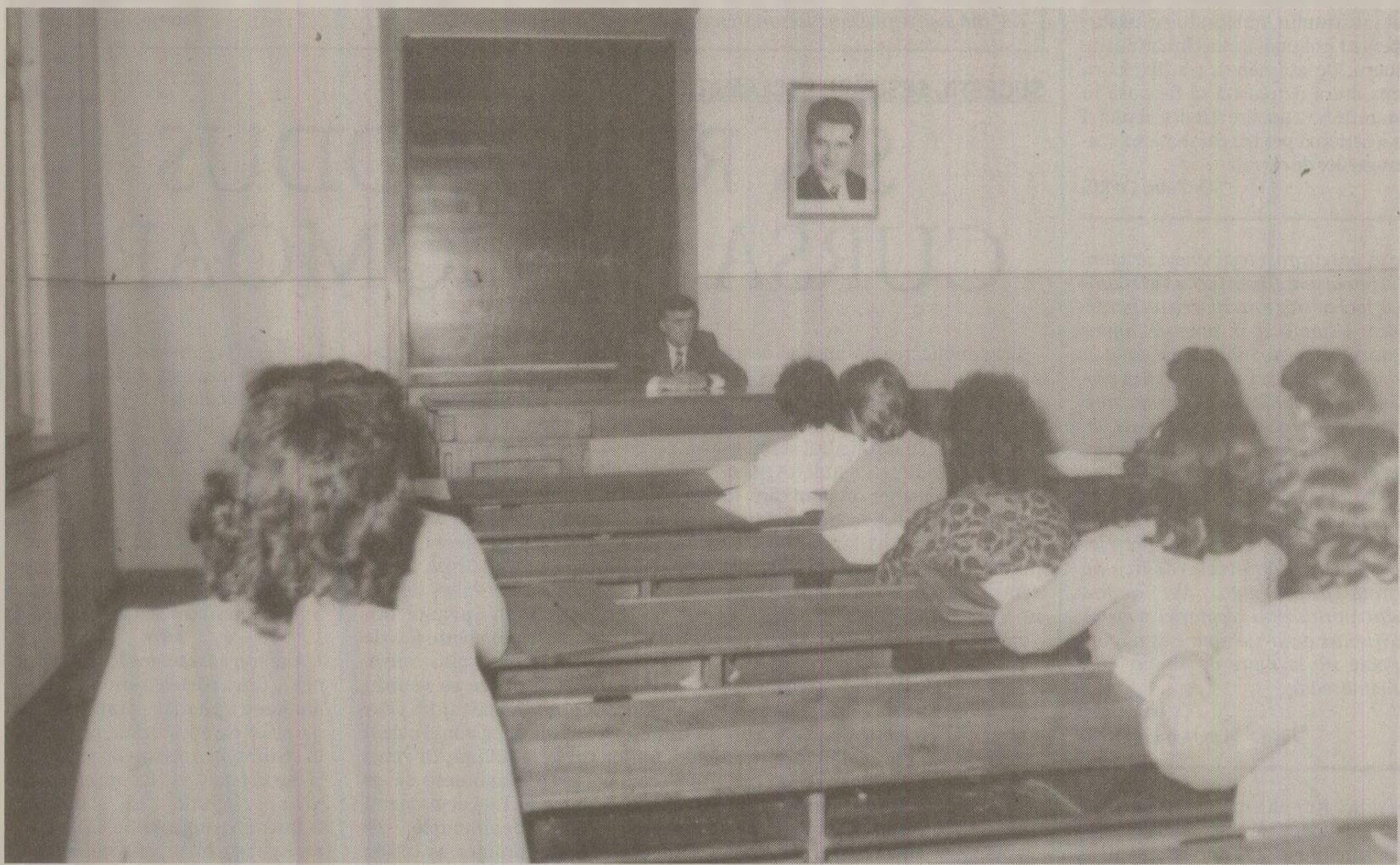
Statutul de student se dobânda după un examen la care concurența era de peste 10 candidați pe loc