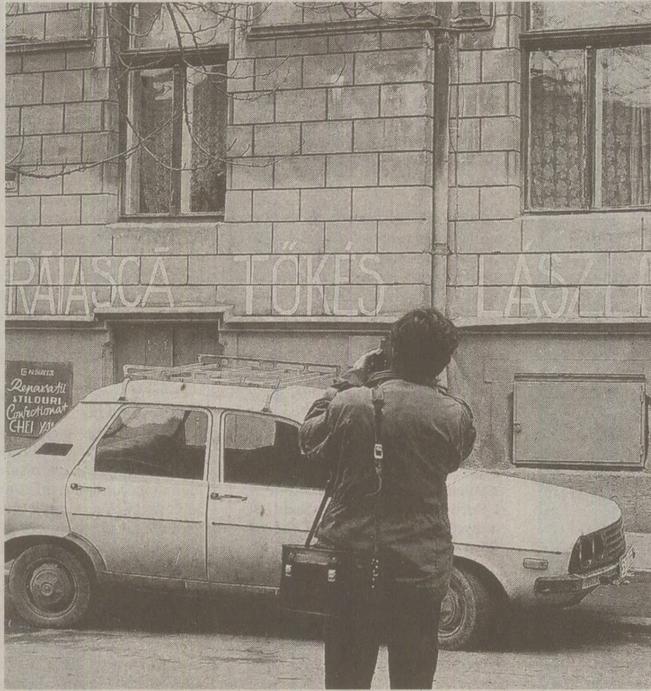
Laszlo Tokes este considerat eroul de la care s-a aprins „focul” Revoluției din 1989.

O scurtă telegramă de la Ambasada României la Budapesta precizează interpretarea: „După opinia noastră, readucerea în obiectivul televiziunii ungare a «cazului Tokes», confirmă cele menționate de noi anterior privind preocuparea unor cercuri