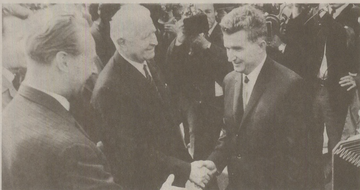
Bunele relații dintre Ceaușescu și Dubcek au avut consecințe multiple după invadarea Pragăi în 1968. Serviciile de informații din Organizația Tratatului de la Varșovia au perceput România ca stat potențial inamic