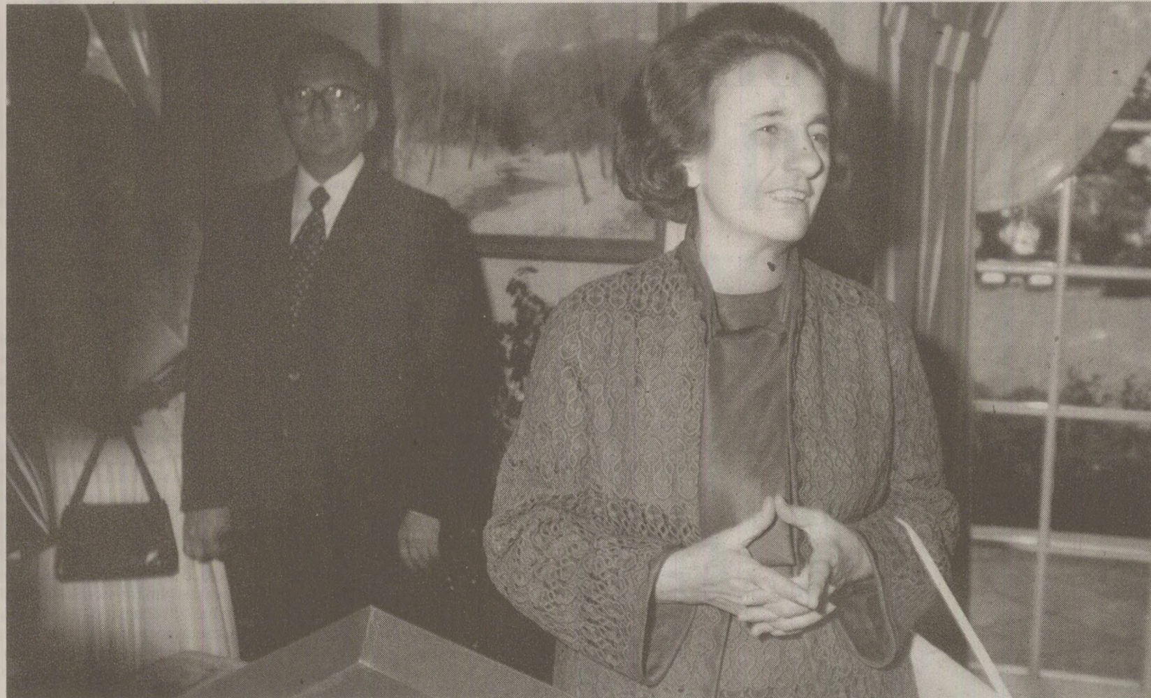
Potrivit memoriilor lui Ion Pacepa, vinerea dimineața, Elena Ceaușescu se delecta cu ultimele noutăți culese de Securitate de la vârful nomenclaturii

Continuăm seria „dezvăluirilor” lui Ion Mihai Pacepa, fost șef adjunct al Departamentului de Informații Externe al Securității, fugit în Occident, cu o istorisire din intimitatea Elenei Ceaușescu. Vinerea dimineața mi-o rezerva întotdeauna mie Elena, ca să-i spun ultimele noutăți furnizate de microfoanele instalate în birourile și locuințele vârfurilor nomenclaturii. Biroul ei, doar cu puțin mai mic decât al lui Ceaușescu, avea stema PCR în locul celei a României. Pe peretele din față era un portret al lui Ceaușescu în mărime naturală. Pe unul dintre pereți erau câteva rafturi de cărți pline cu operele lui Ceaușescu, legate în piele roșie, și câteva exemplare ale cărții ei despre chimie. Pe birou era numai fotografia lui, într-o ramă de aur. Nu se aflau nici dosare, nici alte hârtii. Elenei nu-i plăcea să citească. Singura excepție pe care am remarcat-o vreodată a fost dosarul lui Iosif. Îi plăcea la nebunie, chiar dacă pentru a-l citi trebuia să-și pună pe furis ochelarii, cu care nu se afla niciodată în public. – Arată-mi, a spus Elena, încercând să găsească o poziție confortabilă în fotoliul său uriaș. Ce noutăți ai despre Violeta? Violeta era soția lui Ștefan Andrei, ministrul Afacerilor Externe. Era o păpușică pictată, o tânără acrită afectată, care întotdeauna mergea tanțoșă de parcă ar fi fost pe scenă. De îndată ce Elena a hotărât ca Violeta să fie supravegheată cu microfoane, cu