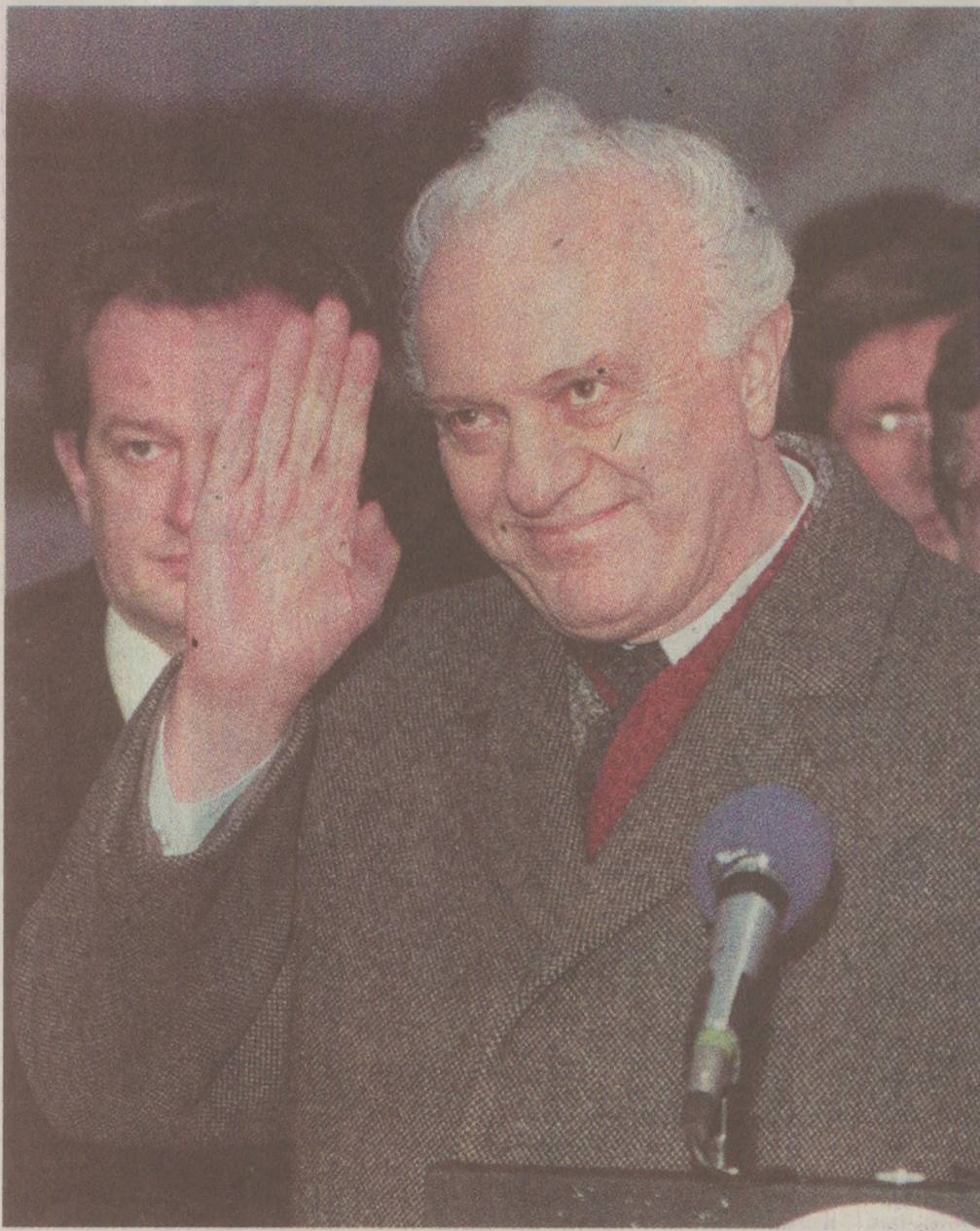
Eduard Șevardnadze, ministrul sovietic al Afacerilor Externe, a fost invitat de Nicolae Ceaușescu la București pentru a discuta criza politică din Polonia.