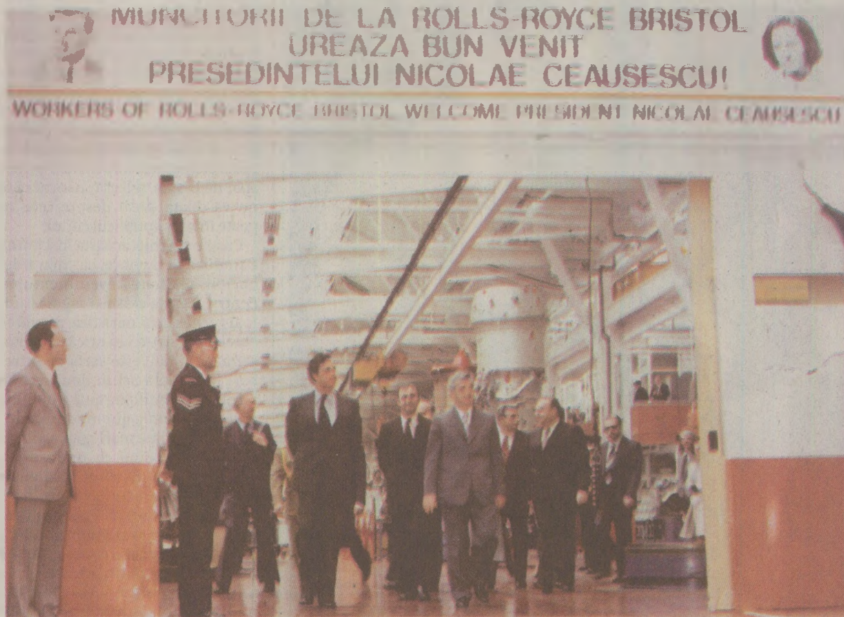
Contractul derulat între România și Marea Britanie, prin care cea din urmă furniza motoare de avioane fabricate de firma Rolls-Royce a determinat, probabil, includerea fabricii din Bristol în vizita oficială făcută de Ceaușescu în 1978.

Unul dintre cele mai cunoscute programe militare dezvoltate de România cu Iugoslavia a fost cel privind fabricarea în serie a avionului bimotor de vânătoare-bombardament IAR-93, subsonic (Soko J-22 Orao, în Iugoslavia). Primul act oficial al programului YUROM a fost acordul încheiat între guvernele celor două state privind proiectarea în comun, execuția, încercarea prototipurilor și fabricația de serie a avionului de