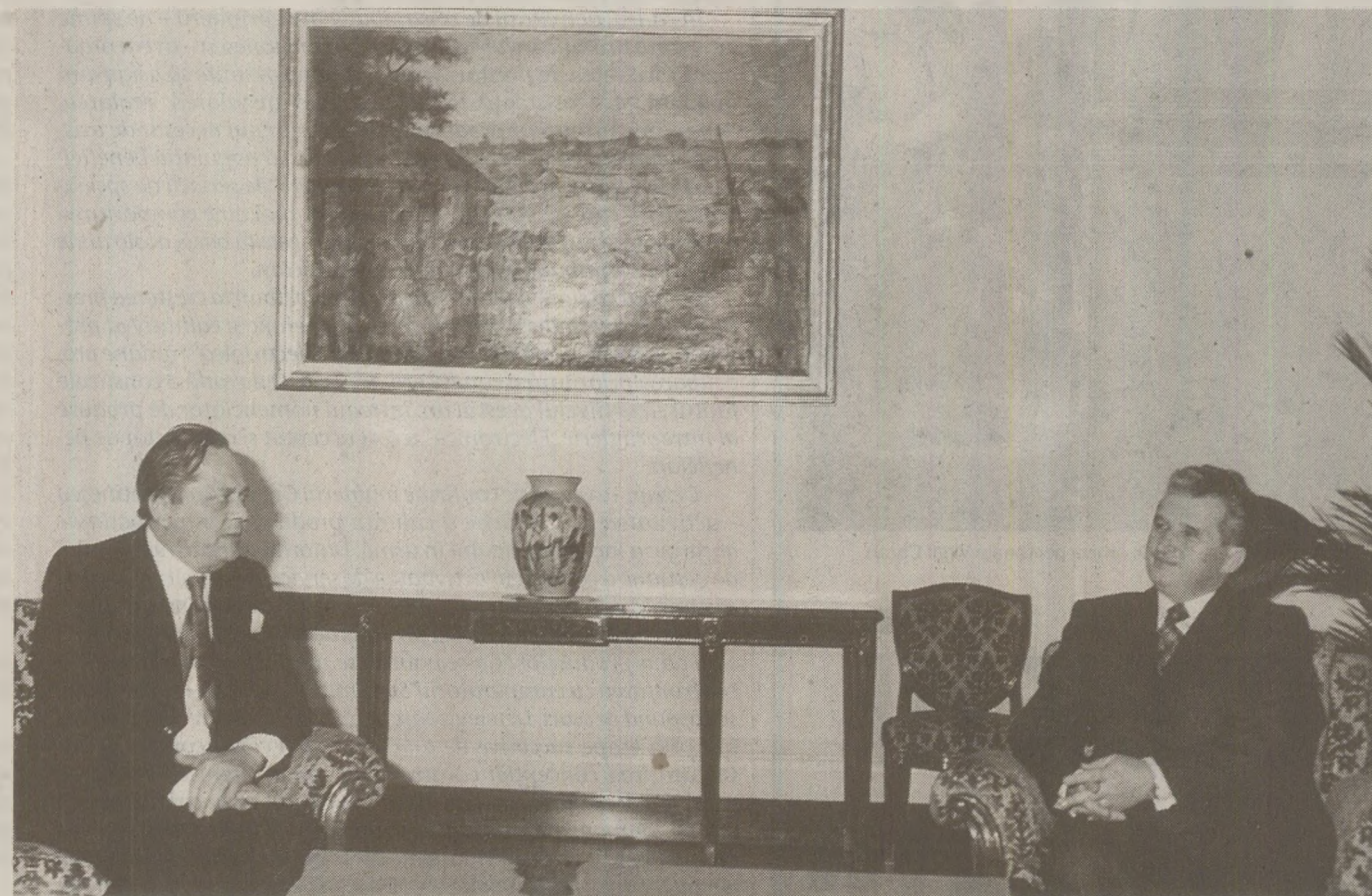
Nicolae Ceaușescu era un mare amator de interviuri în presa străină. În toamna anului 1989, prin întâlniri cu gazetari străini, a căutat să infirme zvonurile privind deteriorarea stării de sănătate

Spre surprinderea observatorilor, totuși, într-un interviu pentru săptămânalul american Newsweek, Ceaușescu a fost de acord să răspundă la o întrebare care s-a referit la posibilitatea ca fiul său să preia conducerea. A fost pentru a doua oară când