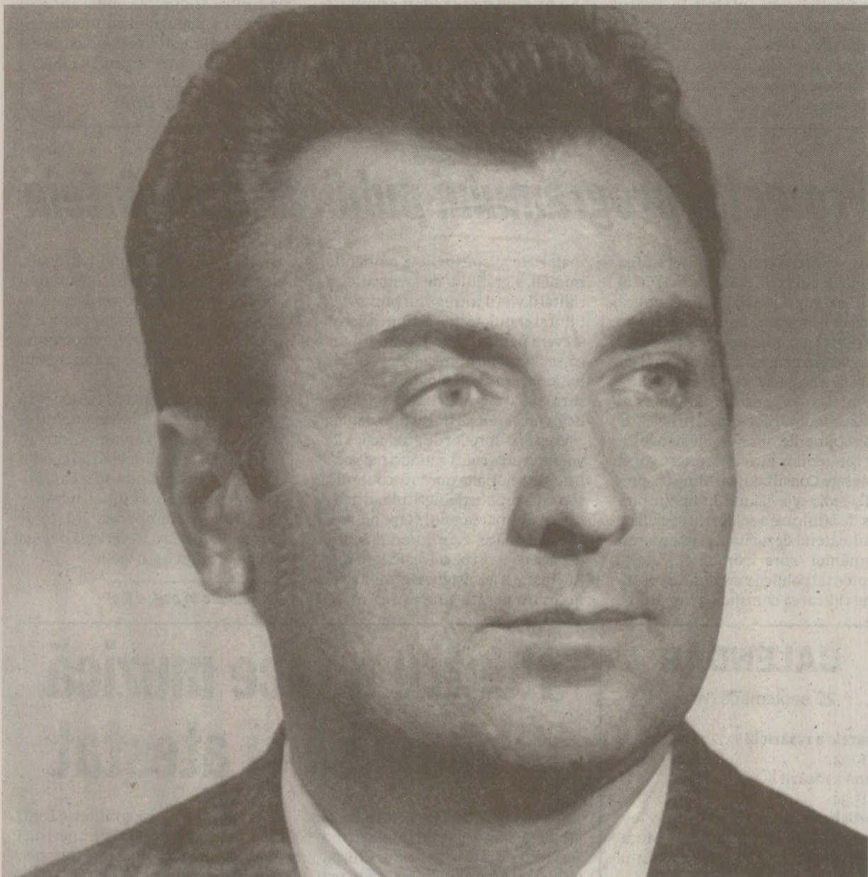
Scuțiți de ani grei de pușcărie, inculpați nu și-au plătit expertul salvator