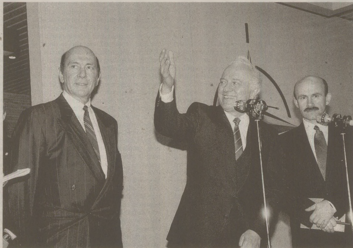
„Războiul rece” părea a se încheia. În decembrie, Eduard Șevardnadze a vizitat chiar și sediul NATO

2. Fără a face cunoscut în detaliu conținutul scrisorii transmise de M. Gorbaciov lui G. Bush, oficialitățile americane afirmă că aceasta conține propuneri importante în domeniul controlului armamentelor și dezarmării, care ar putea duce la un acord