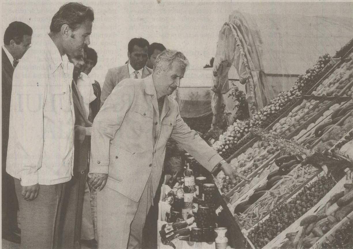
Ceaușescu a impus „programul rațional de alimentație”. La vizitele de lucru însă, erau prezentate produse „din belșug”

Când dobândise întreaga putere, i se mai domolise credința: viltorul promis nu-l putea vesti pe curând. În ani-i-au tot judecata otrava linguşelii celorlalți, aerul rarefiat din singurătatea înălțimii, iluzia veșniciei regimului comunist și a poziției de pion în politica mondială... Nu mai era apostolul lumii noi, se închipuia chiar demiurg! Un zeu intangibil, diferit de suptu, ca ziua de noapte. Din măturile apropiatilor săi poate fi înțeleasă și relația sa cu poporul. Cu înțeașă scriitorului și cunoașterea sprijinului ce i-a fost lui Ceaușescu în chestiuni de ideologie și propagandă,