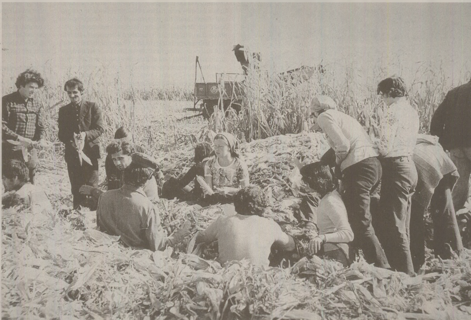
În primele săptămâni sau chiar luni ale anului școlar, studenții și elevii erau obligați să facă practica agricolă

În anii '80 însă, în România, munca forțată îmbrăca formele cele mai tradiționale. Oamenii care lucrau în cu totul alte domenii economice