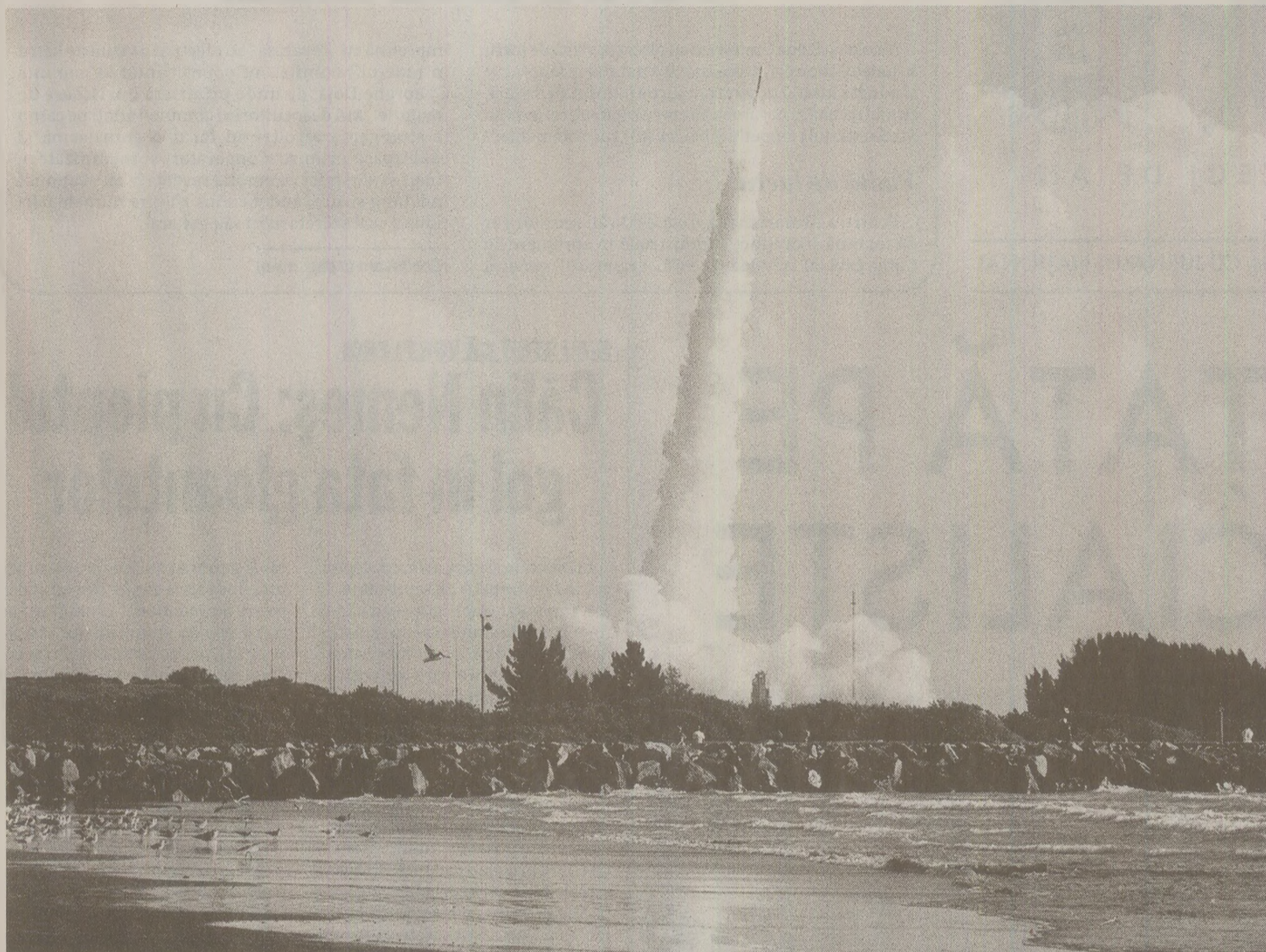
Direcția Topografică Militară română aflate despre sistemul GPS creat și implementat de americani în anii '80. Sistemul era format din 18-24 sateliți lansați pe orbita Pământului, care furnizau permanent informații la sol