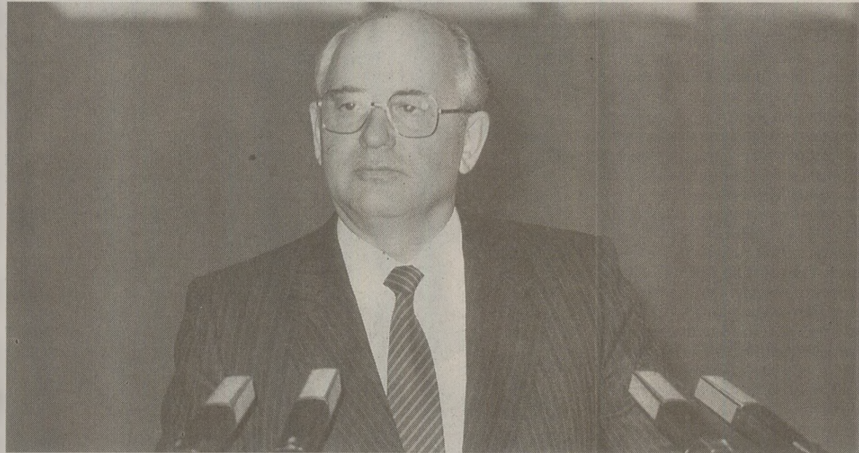
Se gândește oare Gorbaciov la transformarea Pactului de la Varșovia?

Un articol dintr-o publicație sovietică a subliniat că de-a întâi latura politică a Pactului de la Varșovia prin înființarea unor agenții care să arbitreze neînțelegerile intrabloc și să coordoneze politica la nivelul blocului estic. Acest articol din Novoe Vremya a sugerat ca Pactul de la Varșovia să se transforme într-un centru de coordonare a politicilor și de management al crizelor din Europa de Est. În acest fel, s-a spus, pactul ar putea ajuta la găsirea unor soluții pentru conflictele care izbucnesc între membrii Europei de Est și care îmbracă o tot mai mare diversitate. În articol se susține că un astfel de rol ar trebui să fie în consens cu declarata intenție a lui Mihail Gorbaciov de a face din pact un organism mai ales politic și mai puțin militar.