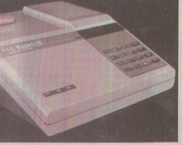
Tic 900 plus, un „vâr” al tehnologiei „Epooci de Aur”