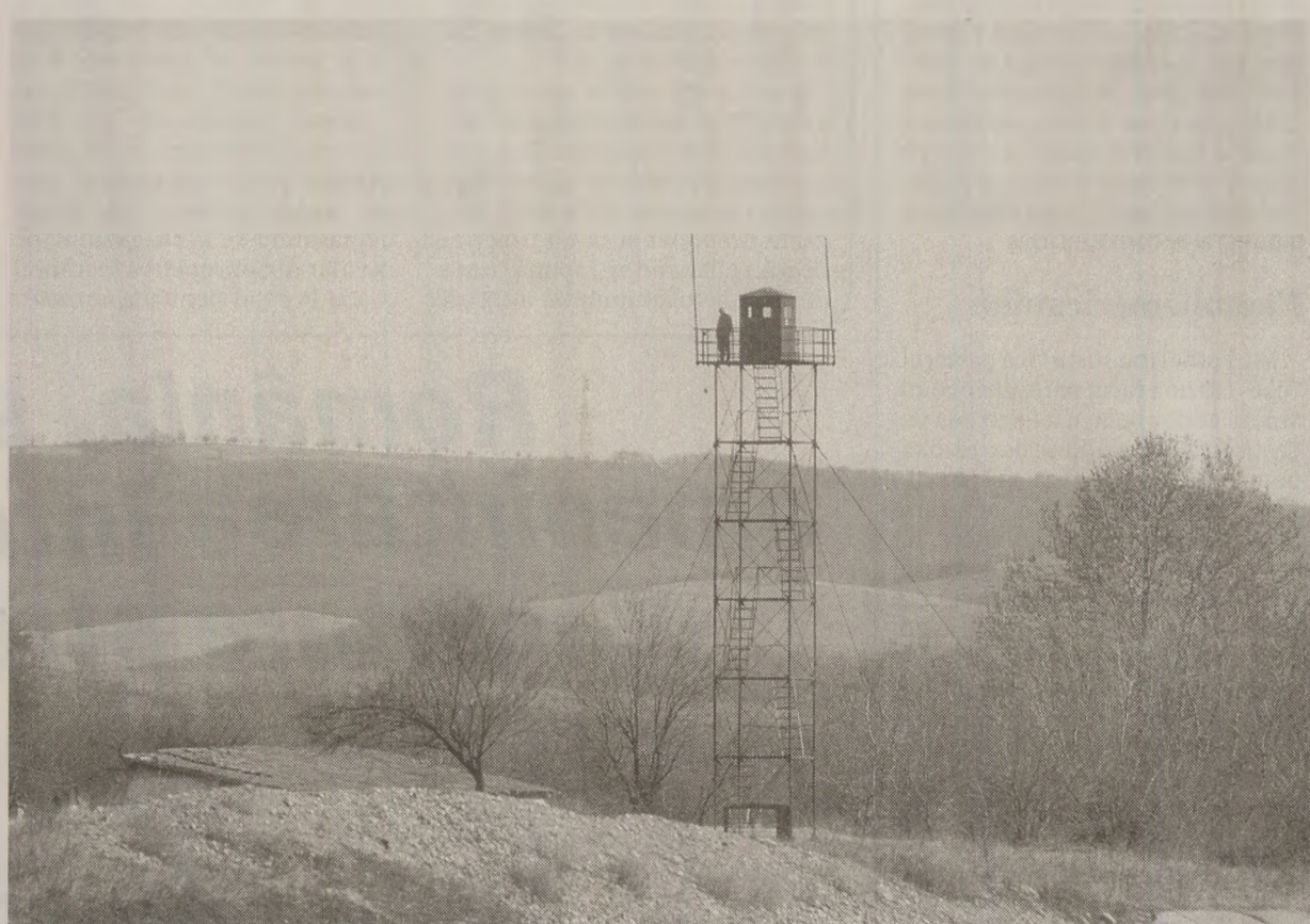
Granițele erau drastic păzite pentru ca nu cumva românii nemulțumiți de regim să emigreze ilegal. De cealaltă parte însă, să pregătească infiltrarea unor agenți ai serviciilor secrete din statele vecine pentru a strâni revolta populației

Răsturnarea regimului comunist totalitar satisfacea pe deplin stările de spirit ale militarilor, singura cale a detenționării situației explozive din armată.