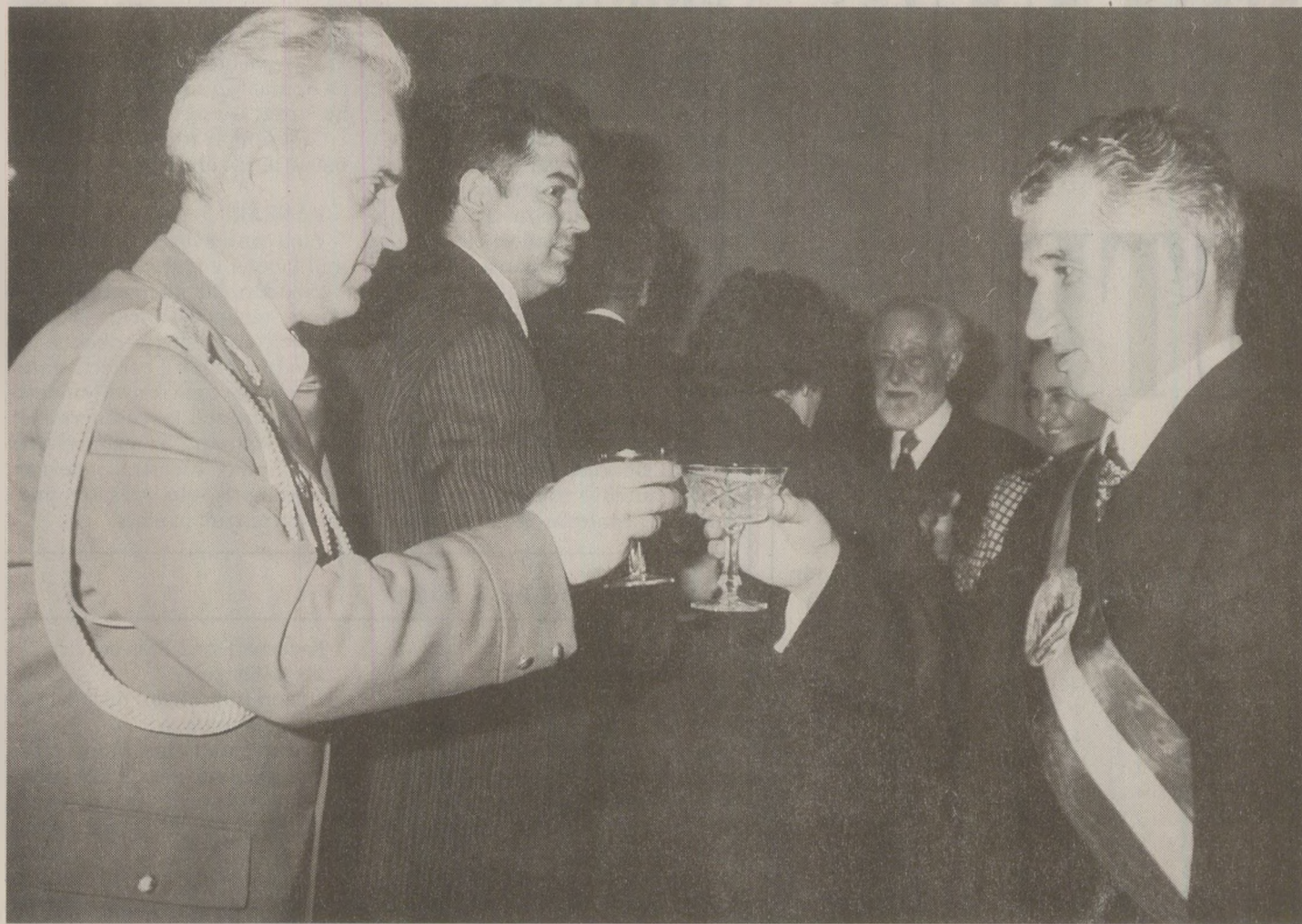
Generalul Vasile Milea a fost surprins de Nicolae Ceaușescu deoarece a încercat să-i prezinte poziția reformiștilor ungar față de regimul de la București.