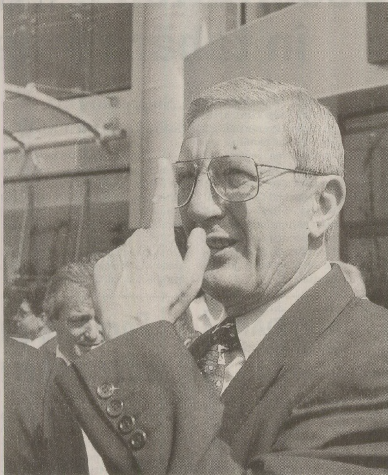
Responsabili din serviciile secrete și armată făceau diverse scenarii privind conexiunile externe ale oamenilor din cercurile Puterii. Despre generalul Stănculescu se credea că era agent englez!