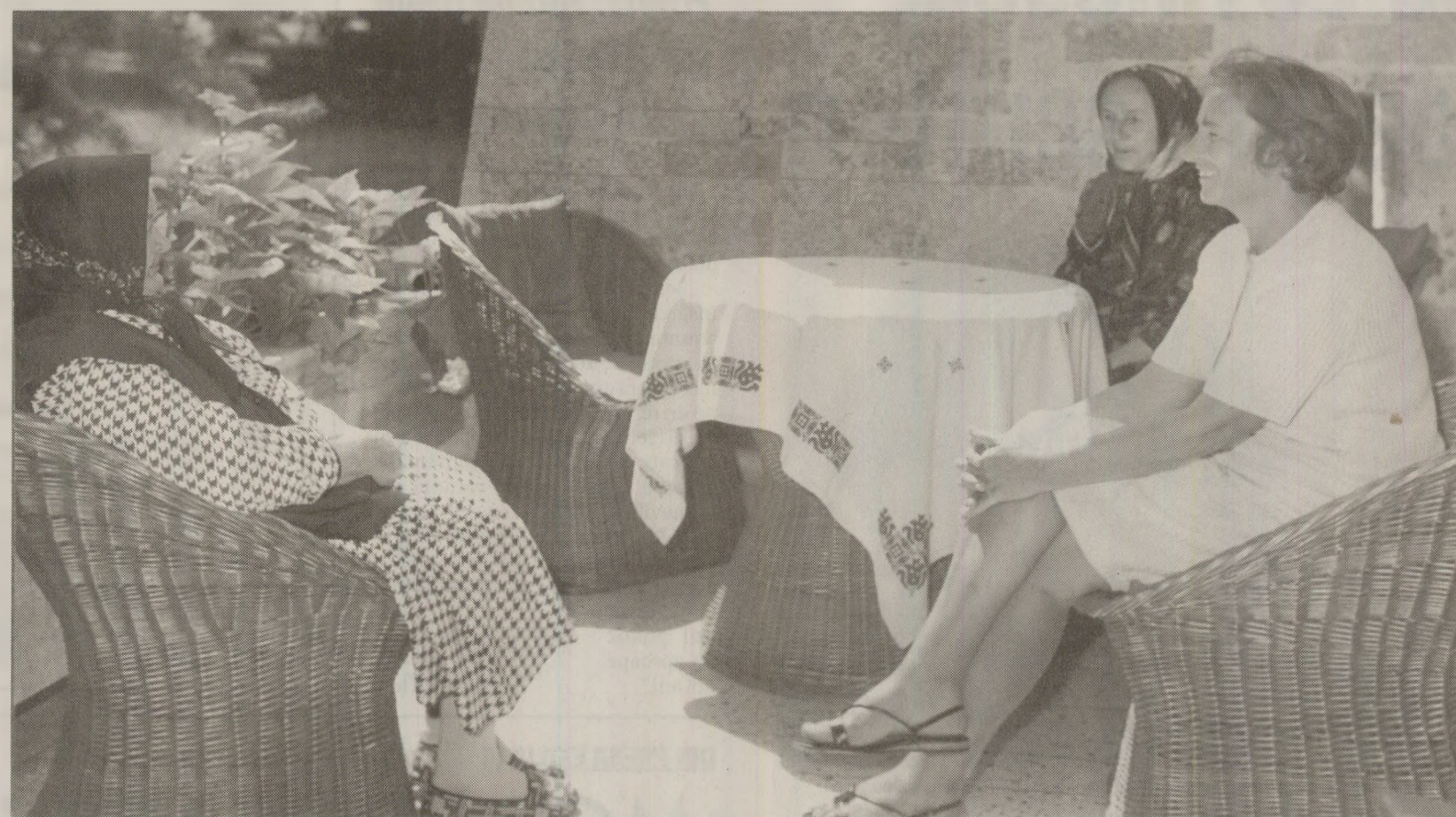
Personalul „civil” care lucra pentru familia Ceaușescu era atent monitorizat de „organele” de Securitate