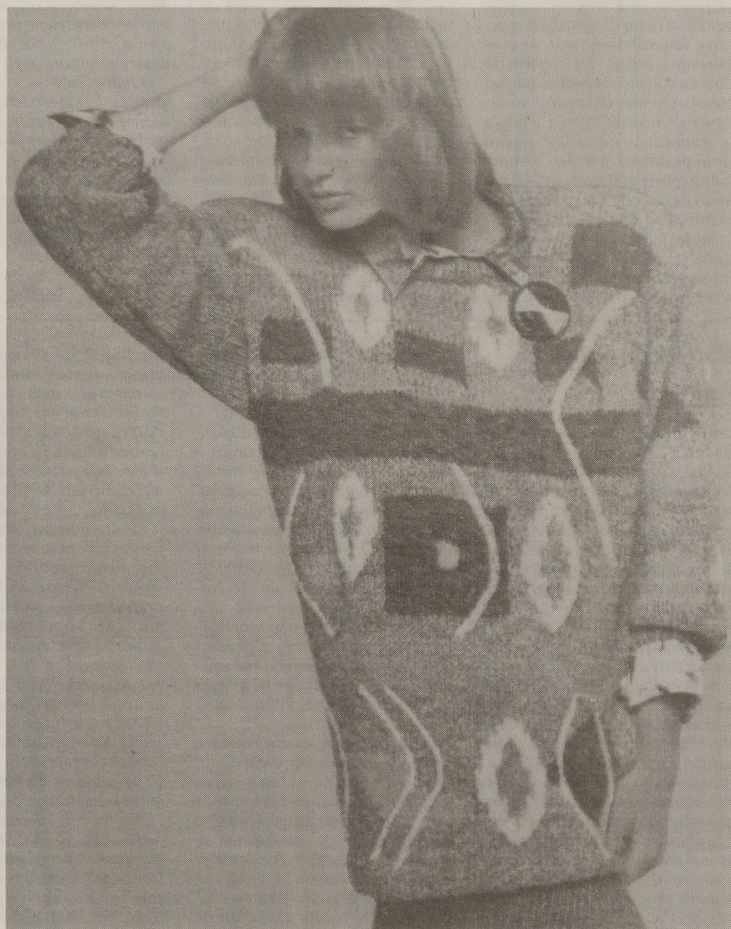
În lipsă de reprezentanțe ale mărcilor vestimentare locale, româncele își croșeteau haine „utilimul răcnet” după schemele găsite în reviste

Casa de Modă „Venus” din București prezintă ultimele modele de jachete, sacouri și pardesie. „Confecțiile acestei toamne, păstrând linia modernă, sunt realizate din țesături în amestec, din