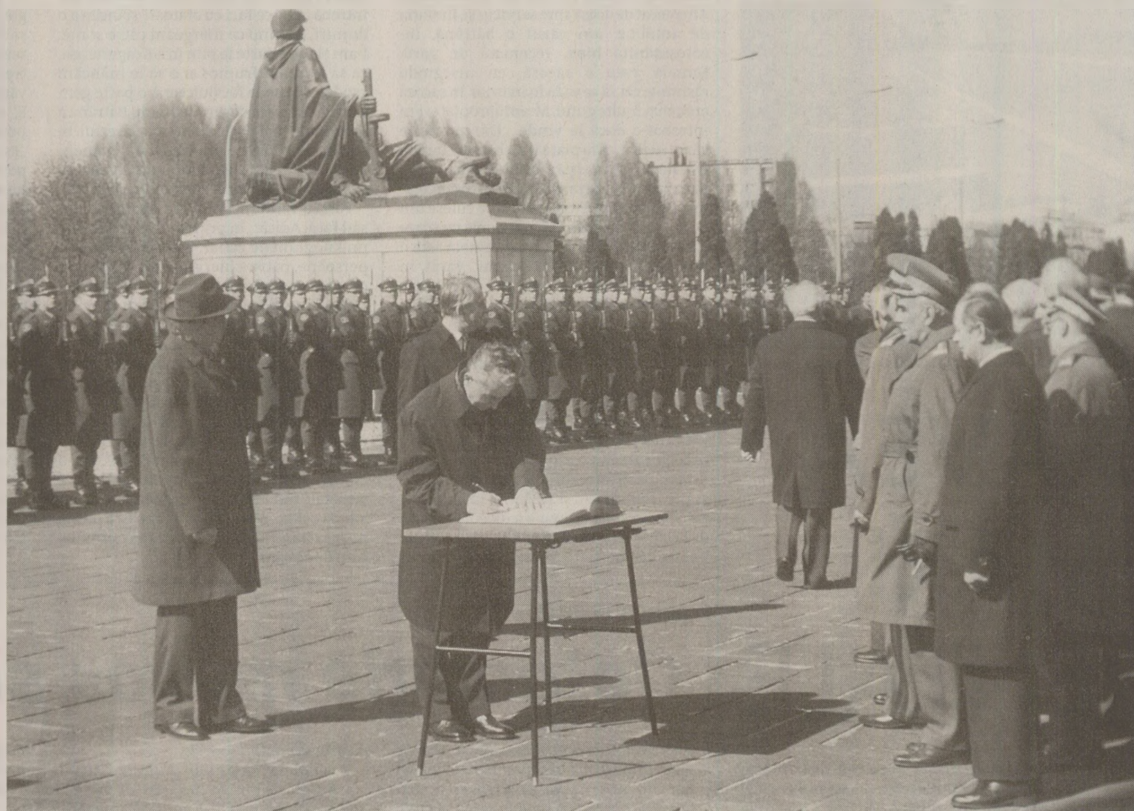
În 1985, liderii Tratatului de la Varșovia nu întrezăreau nici o schimbare în raportul de forțe militare ale lumii. Tocmai semnasera prelungirea acordului cu douăzeci de ani

În vreme ce patru țări membre NATO – Statele Unite ale Americii, Marea Britanie, Canada și Luxemburg – nu au deloc sistemul serviciului militar obligatoriu, fiecare membru al Pactului de la Varșovia se bazează pe bărbații țării pentru a le completa forța militară. Uniunea Sovietică, Bulgaria, Cehoslovacia și Polonia, de exemplu, cer ca tinerii bărbați să-și servească patria vreme de doi ani.