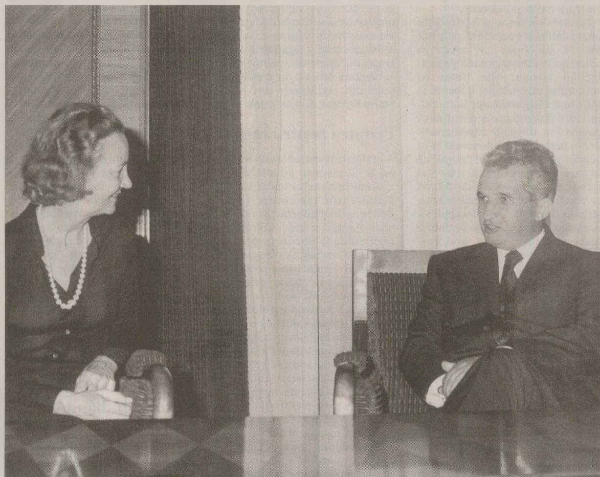
În anii '70, corespondenții ziarelor vest-europene și americane de mare tiraj îl asaltau pe Nicolae Ceaușescu cu interviuri „în exclusivitate”

Inapetența sau chiar imposibilitatea unora dintre agenții de influență de a prelucra materialele primite cu menținerea stilului cerut a condus în unele situații la degradarea calității inșiși a operațiilor de dezinformare implementate. Nu puține au fost situațiile în care, sub presiunea termenelor extrem de scurte (uneori 48 de ore), materialele scrise la București au fost publicate simultan în țări diferite și sub semnături diferite, dar cu un conținut și sub o formă vizibil unitară. Evident că nici unul dintre agenții de influență respectivi nu și-a imaginat că serviciile de specialitate românești îl vor expune atât de brutal și într-un mod atât de neprofesional. Dacă aceste situații au trecut neobservate, aceasta s-a datorat și faptului că majoritatea lor au avut loc în țări în curs de dezvoltare. Pe de altă parte, serviciile de dezinformare românești au ținut permanent seama de regimul juridic specific fiecăreia dintre țările vizate și care reglementează relațiile mass-media autohtone cu interese străine. Un exemplu în acest sens poate fi edificator. În majoritatea țărilor occidentale este permisă publicarea sau difuzarea unei largi game de materi-