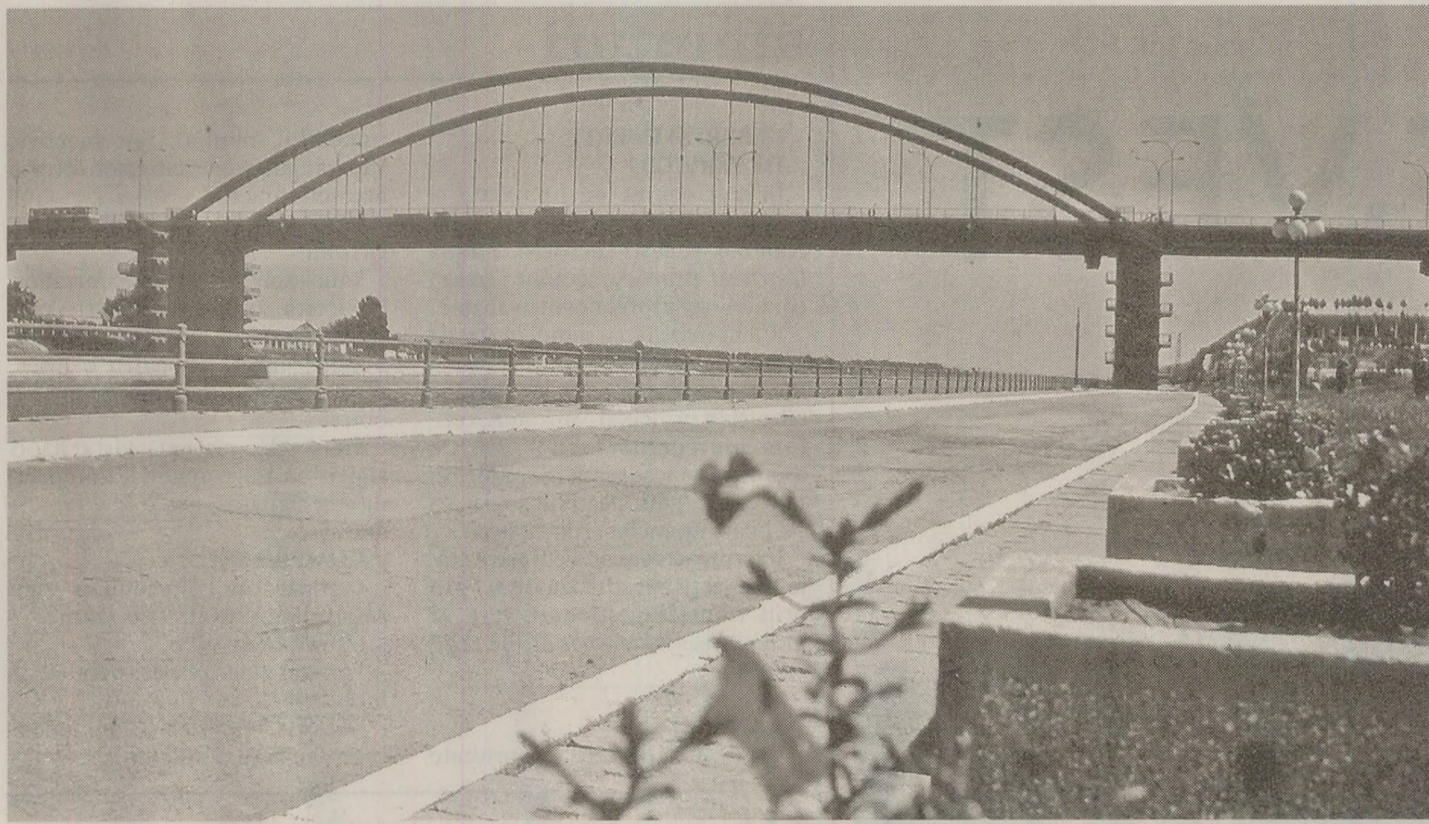
Ziariștii occidentali erau adesea duși să vadă „la fața locului” realizările socialismului. Printre obiective se număra și Canalul Dunăre-Marea Neagră