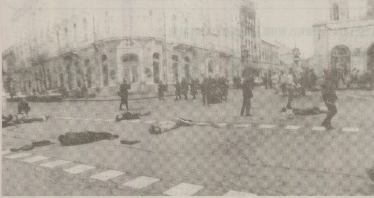
Răzvan Rotta, fotograf de ocazie al Revoluției din Cluj, a surprins în 21 de cadre drumul de la exuberanță la moarte