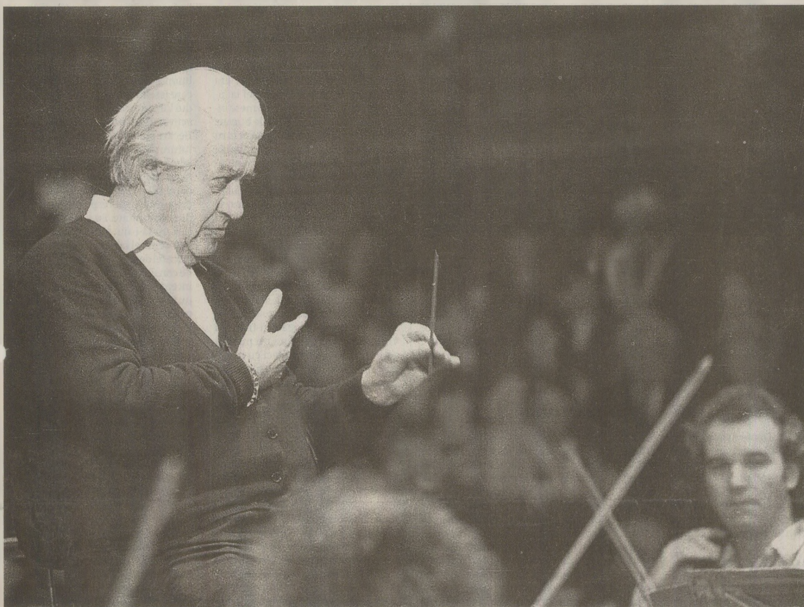
La 67 de ani, dirijorul Sergiu Celibidache cutreiera lumea, în ciuda problemelor de sănătate.

El País relatează la 24 octombrie 1989 despre vizita la Madrid a dirijorului Sergiu Celibidache, deosebit de apreciat în Vest, despre excelența sa profesională, dar și despre tabieturile sale.