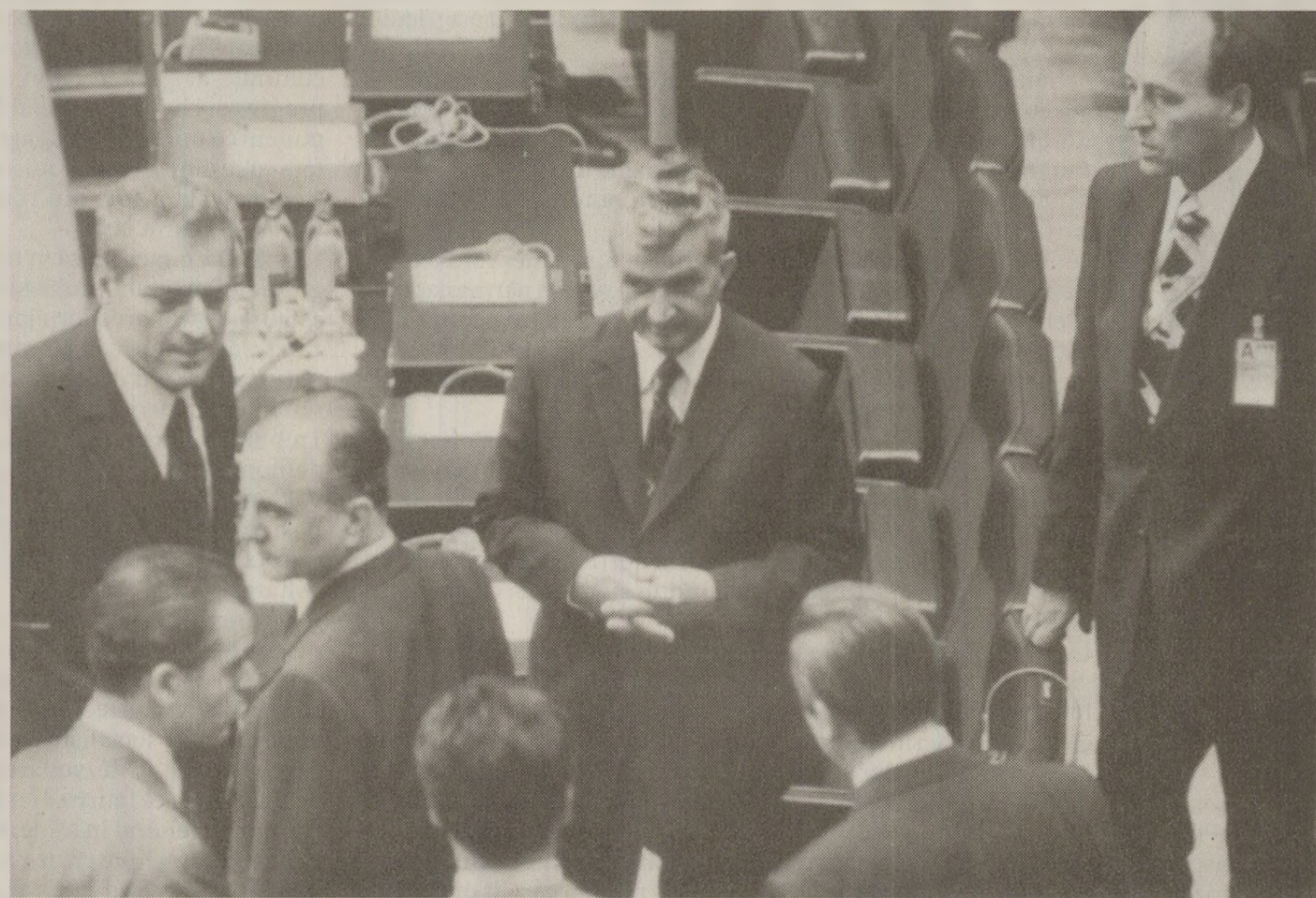
Cehoslovacia, România și Bulgaria erau pe lista „neagră” a organizațiilor pentru apărarea drepturilor omului

Raportul de 310 pagini mai menționează „eforturile extraordinare ale guvernelor de a distruge dovezile asasinatelor și ale propriei responsabilități în comiterea acestora”. Raportul menționează execuții extrajudiciare în cel puțin 24 de țări, torturi și rău tratament al prizonierilor în peste jumătate