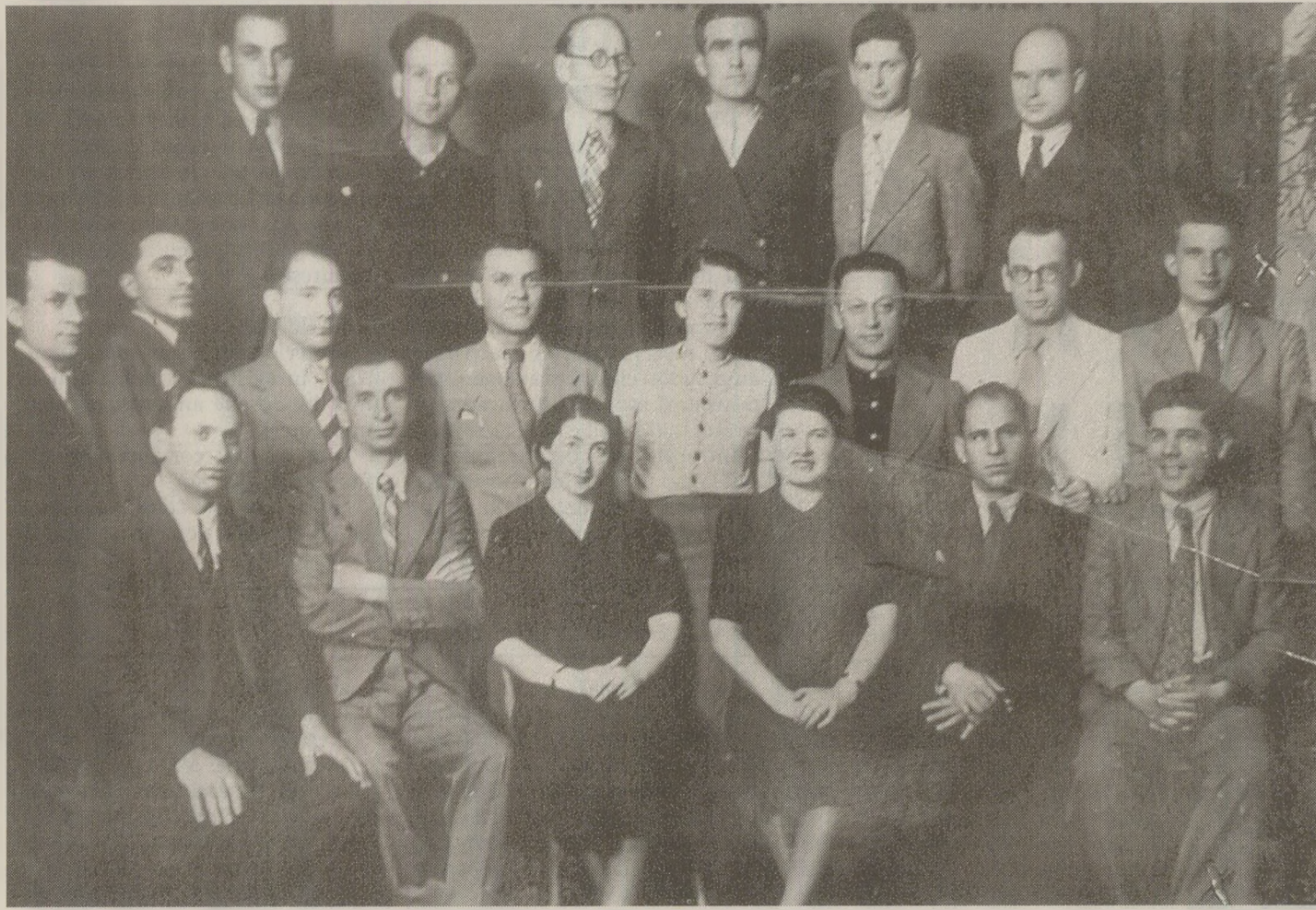
În 1939, nimic nu prevestea cariera de mai târziu a lui Nicolae Ceaușescu