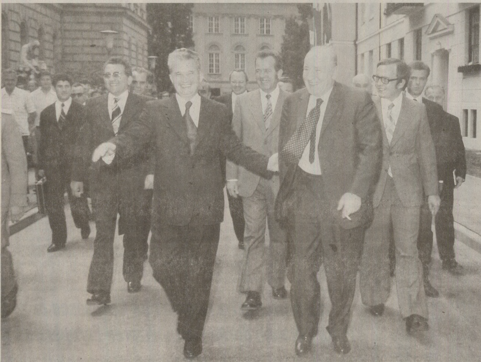
După retragerea lui János Kádár de la conducerea comuniștilor maghiari, relațiile dintre București și Budapesta au devenit încordate

fapt au un numitor comun și un rol activ îl au peste tot cei din emigranții unguri. Peste tot manifestă un caracter antiromânesc și activ, cu