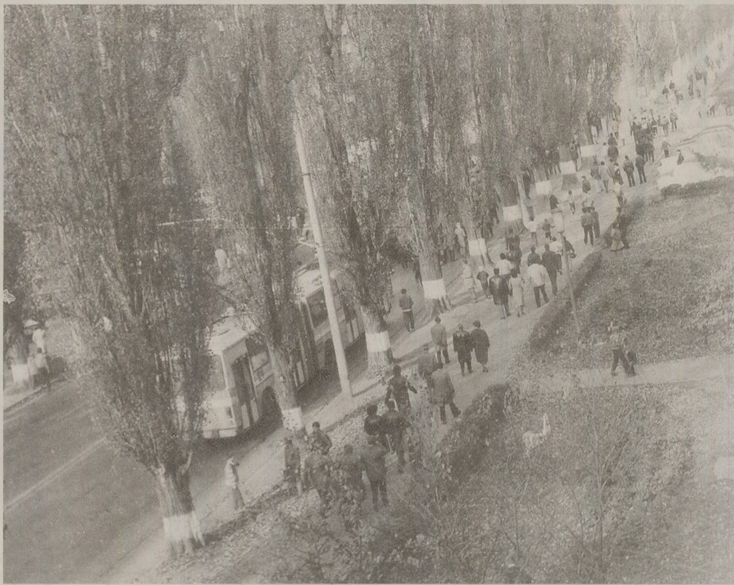
Ceaușescu îl considera pe muncitorii brașoveni care s-au revoltat pe 15 noiembrie 1987 huliganii și bețivi

După evenimentele de la Brașov, secțiile partidului s-au pus în mișcare pen-