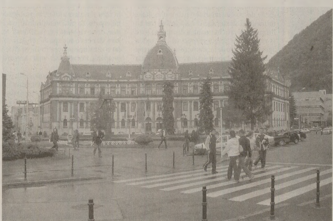
În preajma împlinirii a doi ani de la revolta muncitorilor din Brașov, milițienii și securiștii au înăspriț controlarele și patrulările, pentru a preîntâmpina „incidente nepăcâte”

„Astăzi este ziua Brașov”, semnală Radio Europa Liberă. „Se mplinesc doi ani de la marea demonstrație anticeaușistă de la Brașov, din noiembrie 1987. În țară și în afara țării, sub baionetele dictaturii, în mizerie și întuneric, în afara ei printr-o strângere impresionantă a rândurilor. Dictatura Ceaușescu cunoscute în aceste zile un moment de răscruce. Niciodată n-a fost mai aproape de eșecul final. Dictatorul și forța sa represivă știu bine asta. Este motivul pentru care România arată în aceste zile și ore precum în țară în care s-a declarat starea