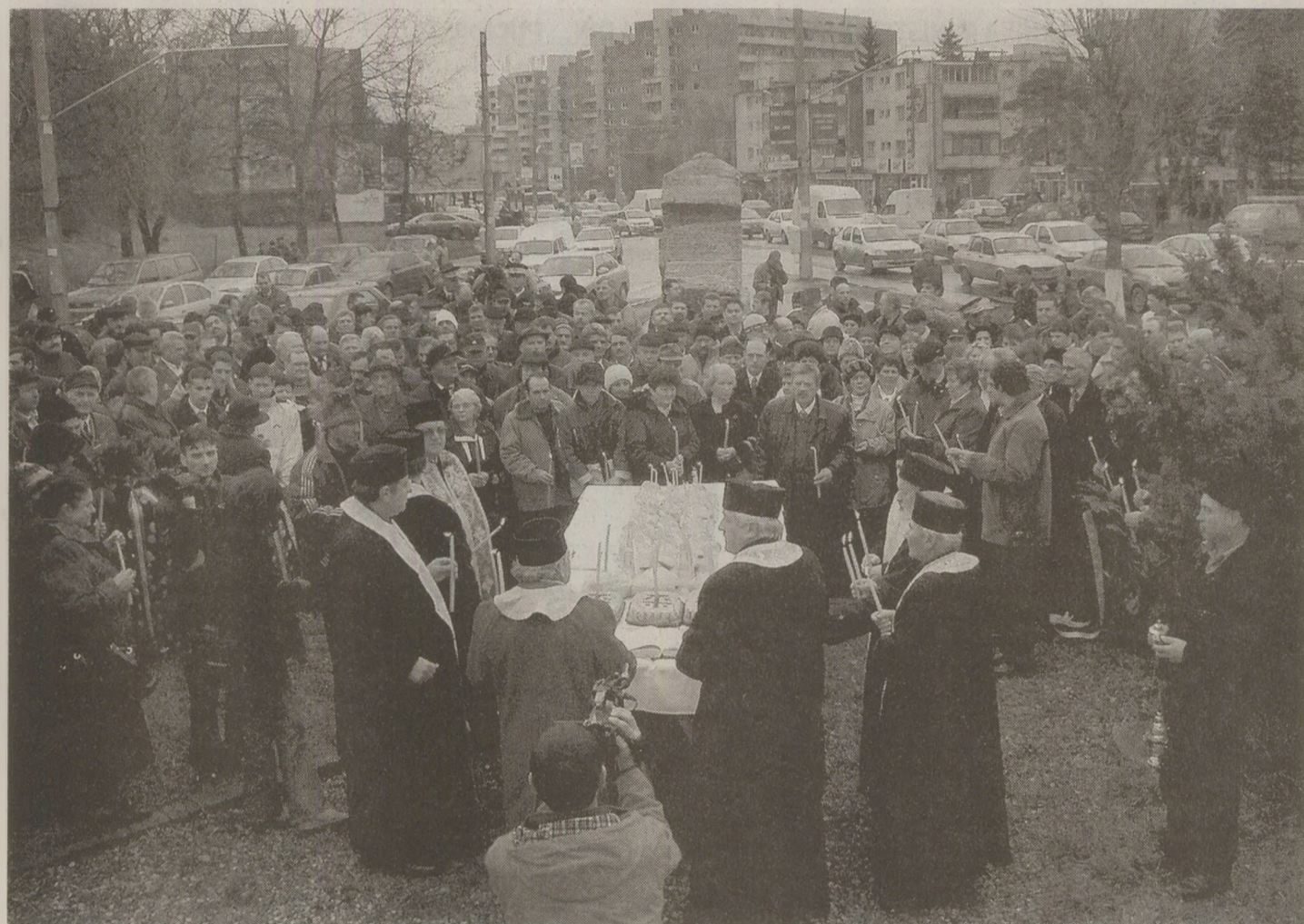
După procesul „Iotului” Brașov '87, muncitorii desemnați vinovați au fost expulzați din oraș. Din 1990 își comemorează anual suferințele de 15 noiembrie