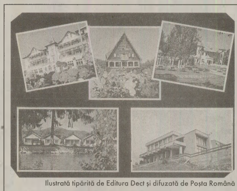
Ilustrată tipărită de Editura Deceț și difuzată de Poșta Română