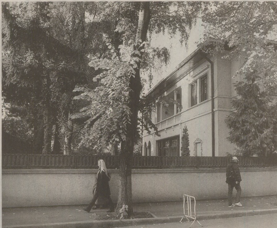
Din neglijența colegilor judecați împreună cu Mănescu în 1944. Siguranța a descoperit o importantă casă conspirativă a partidului din cartierul Primăverii. În calitate de înalt demnitar, acesta a locuit în aceeași zonă

În 1954 a fost trimis la Moscova, ca locuitor al reprezentanțului României în CAER. După anul petrecut în capitala URSS, întors în țară, a fost numit în fruntea Ministerului de Finanțe. După doi ani, în