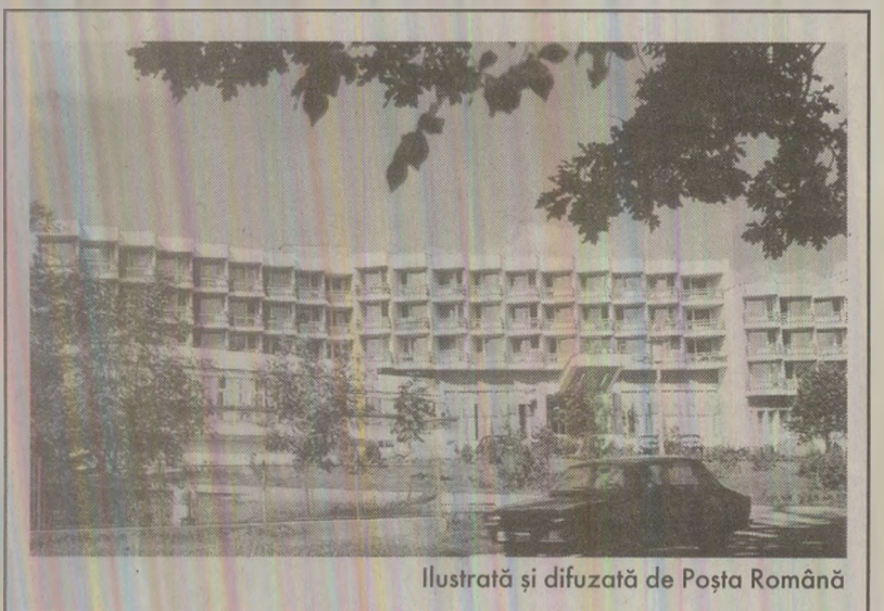
Ilustrată și difuzată de Poșta Română