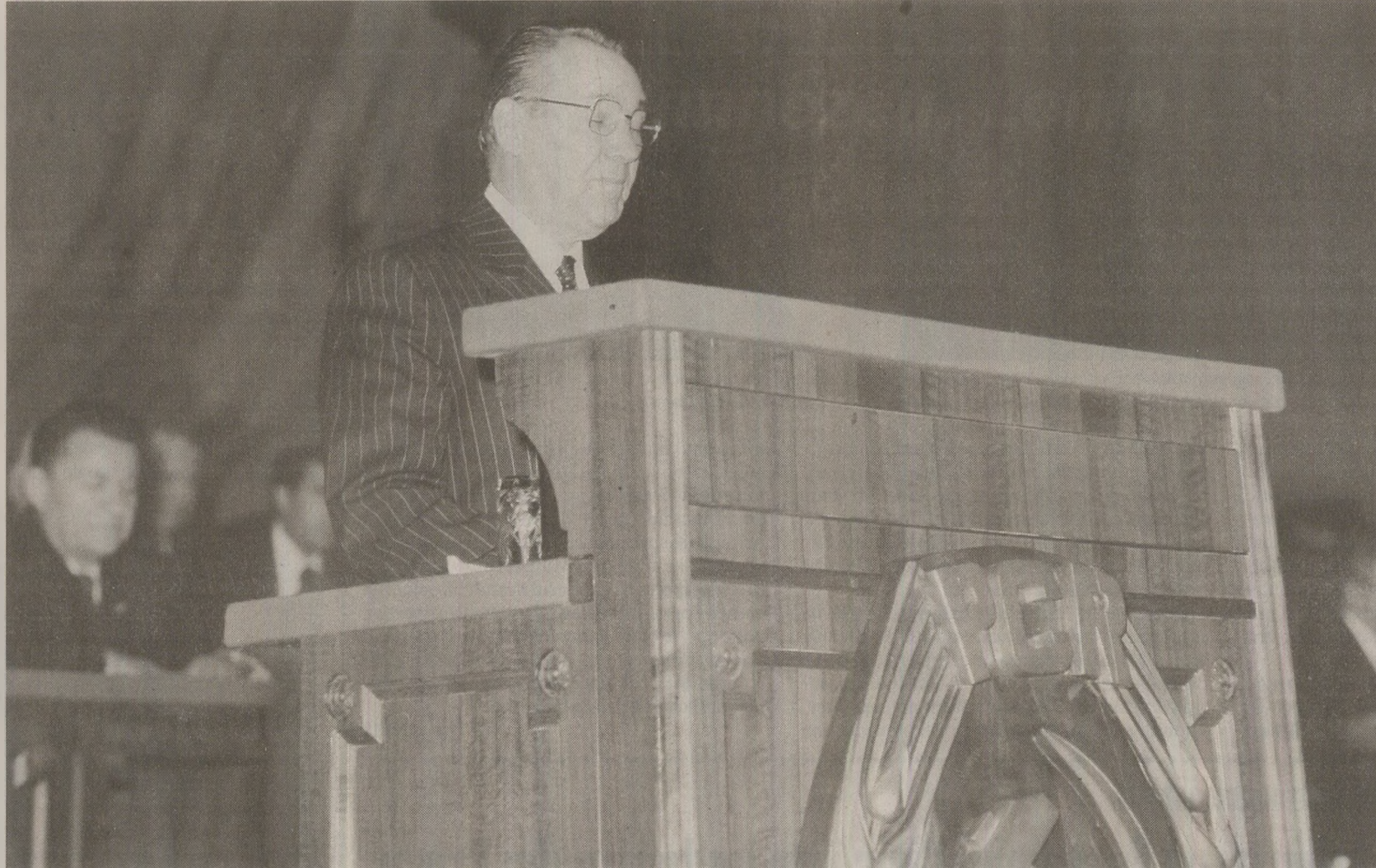
„În muncă sunt câteodată nervos și cam repezit și chiar reped pe unii tovarăși”, se autocaracteriza Manea Mănescu, prim-ministru între 1974 și 1979.

Manea Mănescu fusese arestat în decembrie 1943 și judecat în procesul Uniunii Patrioților. Comportarea în timpul anchetei și la judecata a înregistrat multe file atașate ulterior dosarului de cadre. Conșcituții din perioada studiilor, colegii de serviciu, membri de partid din ilegalitate au dat declarații despre el. Mănescu însuși și-a scris în mai multe rânduri povestea vieții. Comisia de verificări a solicitat Moscovei să trimită în țară copii de pe documente luate după război și care se refereau la activitatea lui Mănescu din timpul dictaturii militare a mareșalului Antonescu. La finele deceniului cinci, partidul începuse vânătoarea de vrăjitoare „trădătoare”. Din start, majoritatea covârșitoare a