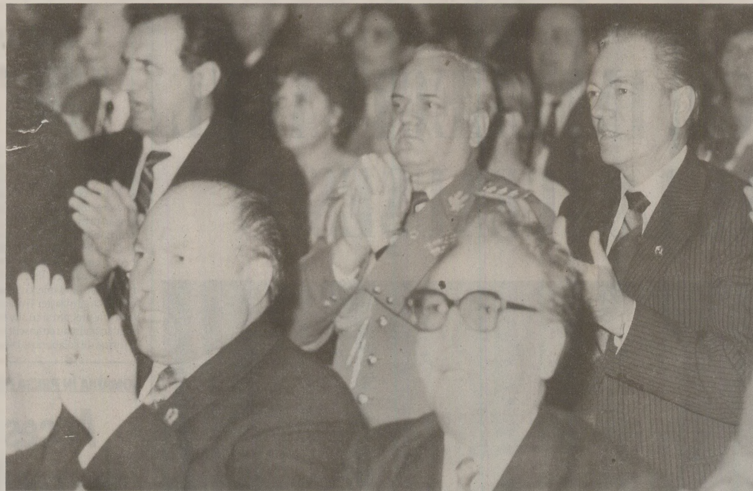
General-colonel Vasile Milea, în 1989 ministrul al Apărării Naționale, îl propunea lui Nicolae Ceaușescu diverse schimbări de experiență cu forțele armate ale statelor membre în Organizația Tratatului de la Varșovia.

Propun și rog respectuos a aproba primirea în țara noastră, în perioada 17-27.05.1989, a 5-6 generali și ofițeri din Statul Major al Forțelor Armate Unite, care să aibă acces în comandamentul Diviziei 10 Mecanizată și Regimentul 15 Mecanizat din garnizoana Iași, Regimentele 63 Tancuri, 3 Artilerie și Divizionul 327 Artilerie Antitanc din garnizoana Bacău, unități ce au mai fost văzute anterior pe timpul inspecțiilor.