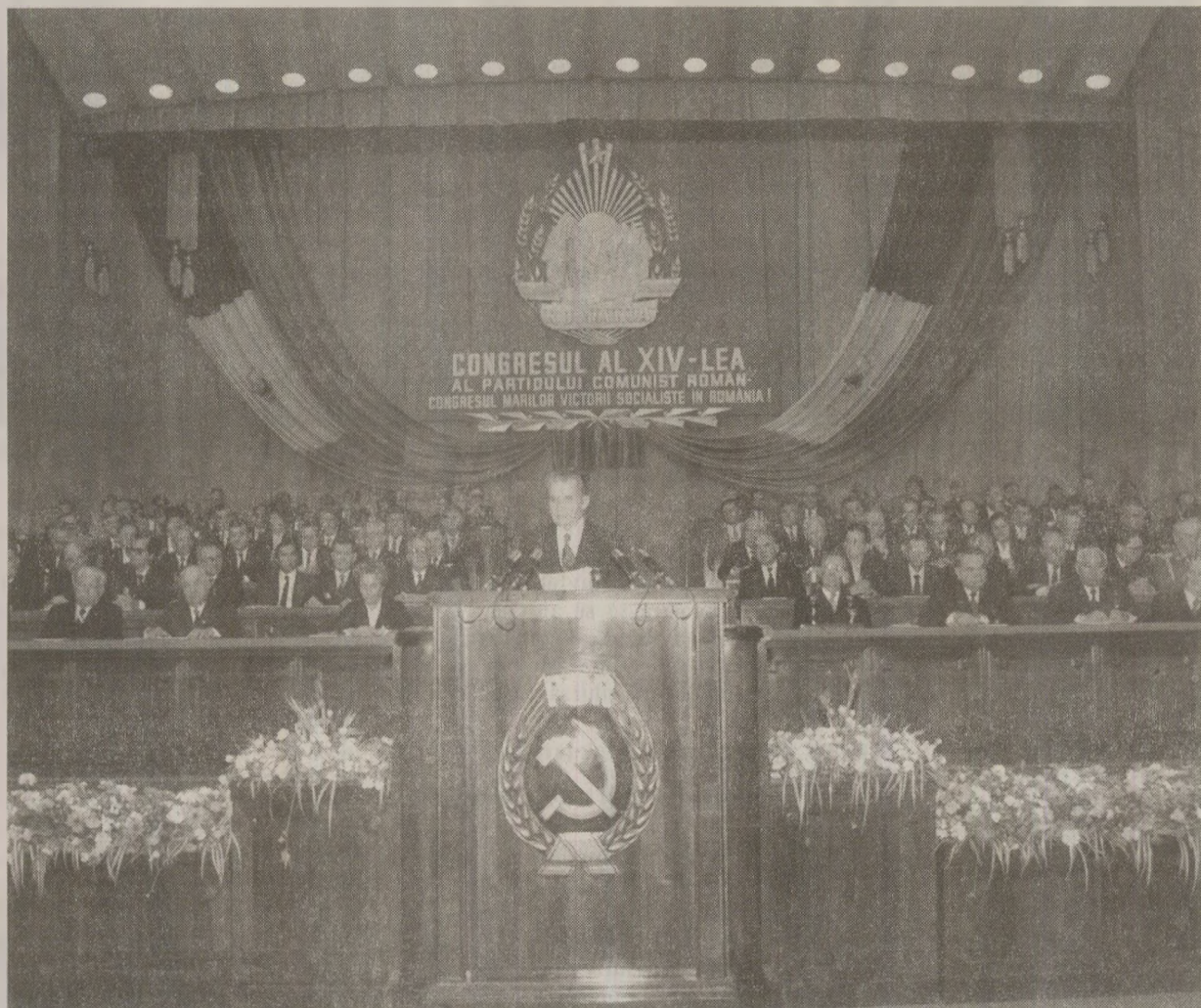
Cu un discurs de „numai” șase ore, Nicolae Ceaușescu n-a reușit totuși să doboare recordul absolut în materie stabilit de „prietenul” Fidel Castro

„Stimați tovarăși, (...) Congresul are loc în împrejurări internaționale deosebite, când în fața țărilor socialiste, a tuturor popoarelor se pun noi și noi întrebări și probleme cu privire la calea progresului economico-social, a lichidării inegalităților și asigurării, a înlăturării pericolului războiului nuclear, care ar duce la distrugerea a însăși vieții pe pământ, cu privire la căile de transformare revoluționară a lumii, de realizare a unor relații sociale și noi relații între state și popoare în vederea asigurării și făuririi unei lumi mai drepte și mai bune pe planeta noastră.”