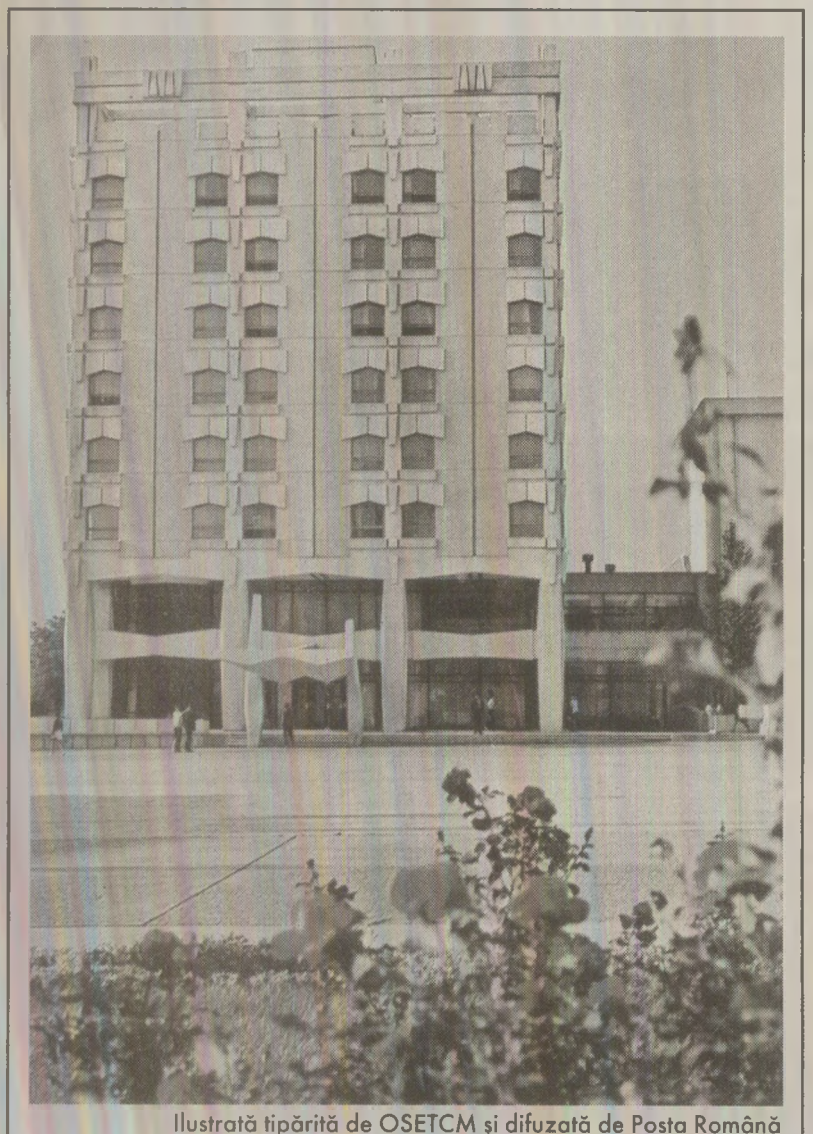
Ilustrație tipărită de OSETCM și difuzată de Poșta Română