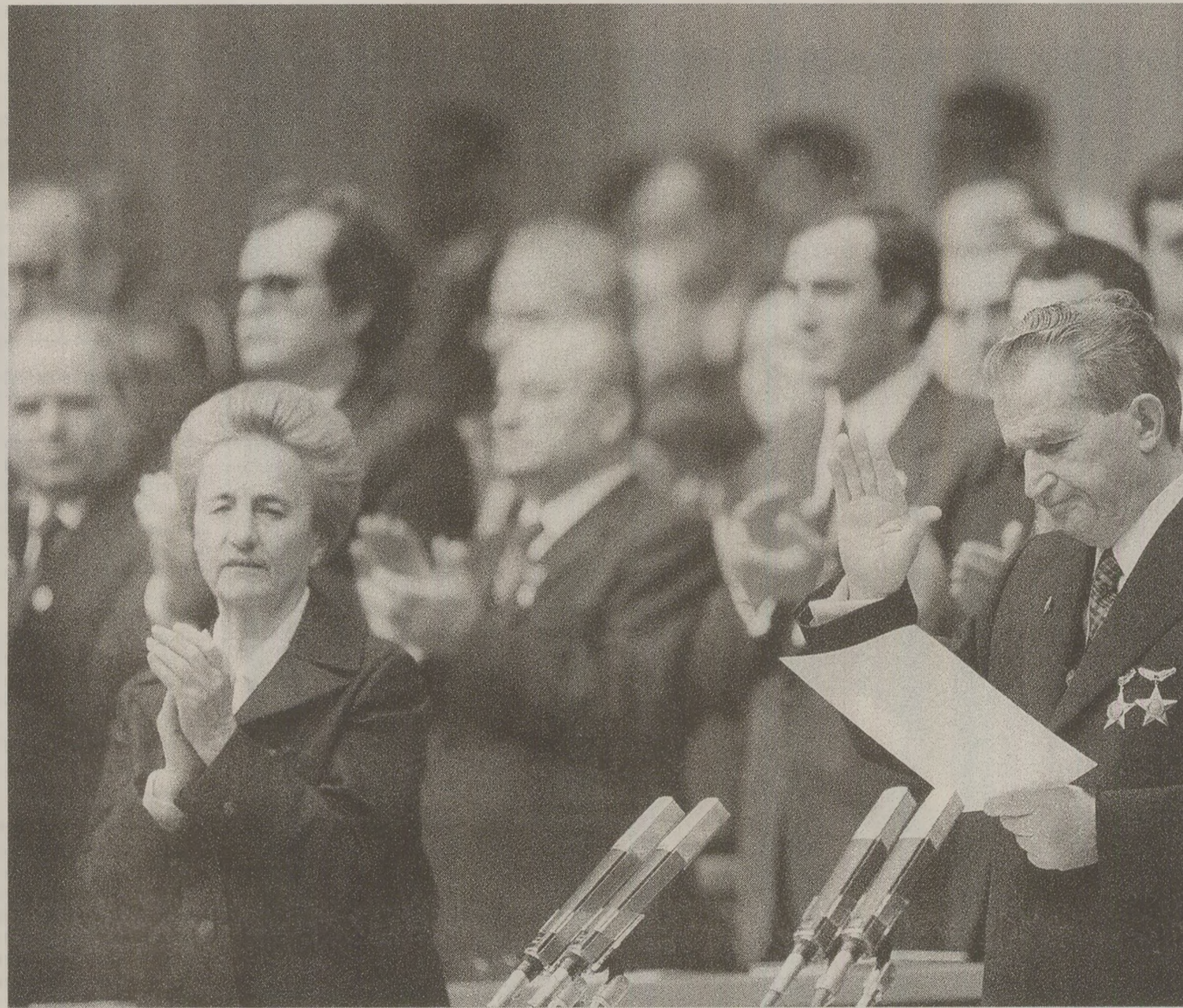
Până la capătul vieții, Ceaușescu a luat aplauzele și ovatiile drept sincere dovezi ale simpatiei și popularității

Titlurile din paginile dedicate actualității internaționale descriau astfel lumea guvernată de dușmanul de moarte al socialismului, temutul capitalism. Sub genericul „Lumea capitalismului despre ea însăși”, pentru susținerea tezei de mai sus, erau folosite chiar articole publicate în ziare de marcă din Occident. The Times relatează despre efectul noului sistem de taxe din Marea Britanie: 63% din totalul familiilor vor pierde 37% din venituri. Die Zeit descria un oraș irlandez drept „Lumea a treia a Europei Occidentale”. „Pe străzile orașului irlandez Darnale dimineața nu vezi decât câinii care scormonesc prin lăzile de gunoi în căutarea mâncării. În general, această așezare din nord-estul Dublului nu oferă un aspect plăcut. Unele case au în jur gârâni, dar ele sunt inconjurate de garduri înalte. Până și lăcașurile de cult au ziduri cu porți închise cu lacăte de teama actelor de vandalism. Supermagazinul s-a închis din pricina numeroaselor furturi. Principala problemă a orașului Darnale este șomajul, el afectând 72% din populația aptă de muncă. La un muncitor salariat revin încă trei care caută loc de muncă. Localitatea s-a transformat într-un ghetou social”, zăugărea cotidianul german al cărui articol era publicat de România Liberă chiar în zilele Congresului PCR.