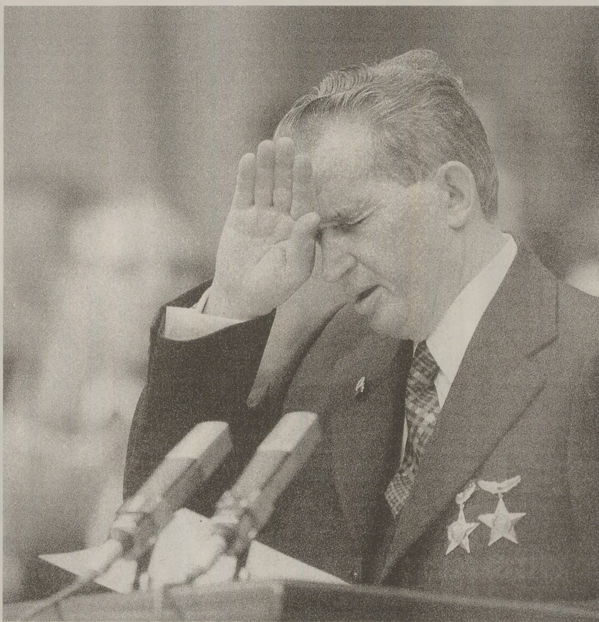
La ce se gândea, oare...? Toată lumea spera că la retragere

La 20 noiembrie, Arielle Thedrel scria în Le Figaro despre contextul marcat de schimbări democratice în care debuta cel de-al XIV-lea Congres al PCR.