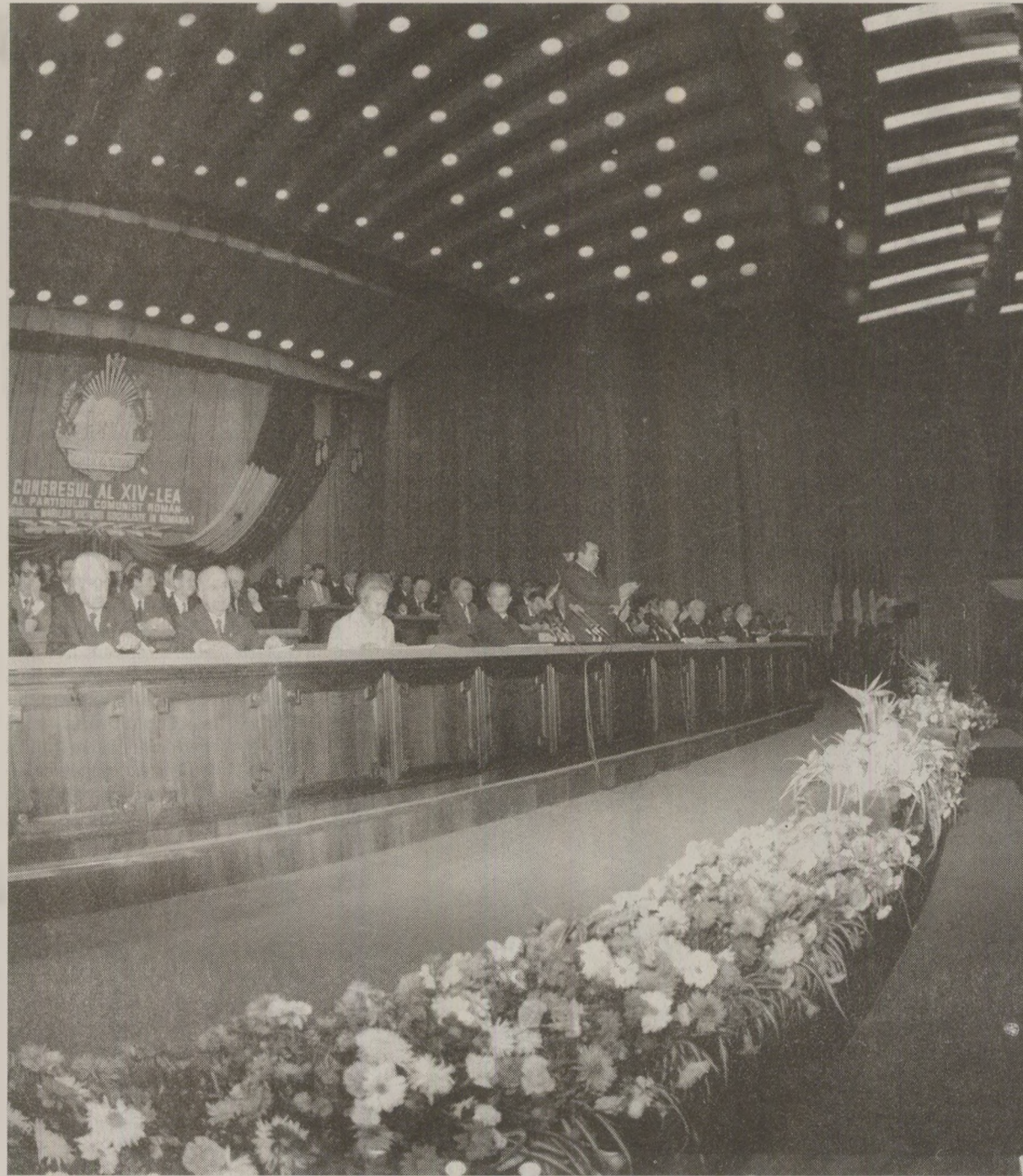
În timp de Nicolae Ceaușescu vorbea în Congres despre creșterea consumului alimentelor de la 1.800 la 3.300 de calorii zilnic pe cap de locuitor...