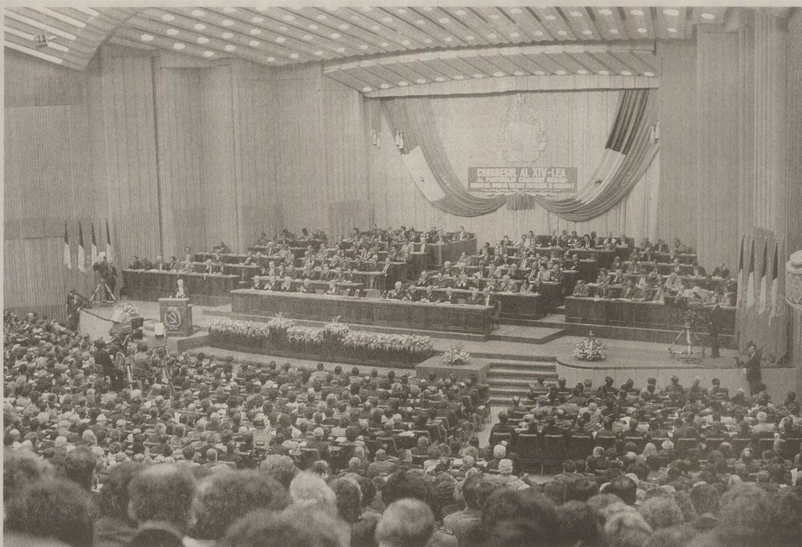
Jurnaliștii străini au participat doar la deschiderea Congresului al XIV-lea și la ceremonia de închidere, când s-a anunțat reinvestitura lui Ceaușescu.

Dar aici, la București, totul pare a fi în intineric: black-out complet în ceea ce privește știrile din restul lumii, din Europa de Est, despre precipitarea evenimentelor din Cehoslovacia sau despre schimbările din Bulgaria. Știri? La televizor, la ora 21, ne exaltăm aflând despre agricultura în epoca Nicolae Ceaușescu. Mai bine mergi la cinema. La Patria, care se află pe marele bulevard central Magheru, rulează „Mircea”, un film istoric regizat și interpretat de Sergiu Nicolaescu, un actor bun care seamănă cu Richard Burton cu barba lui lungă și grizonată. Patru spectacole pe zi, primul la ora 9 dimineața, 12 lei biletul pentru locu-