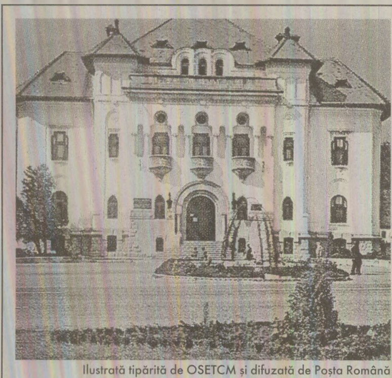
Ilustrată tipărită de OSETCM și difuzată de Poșta Română