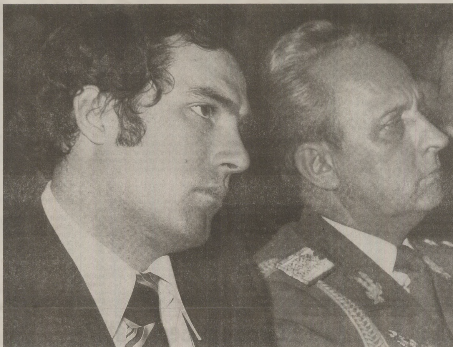
Nicu Ceaușescu a fost, la 36 de ani, cel mai tânăr prim-secretar de județ din România