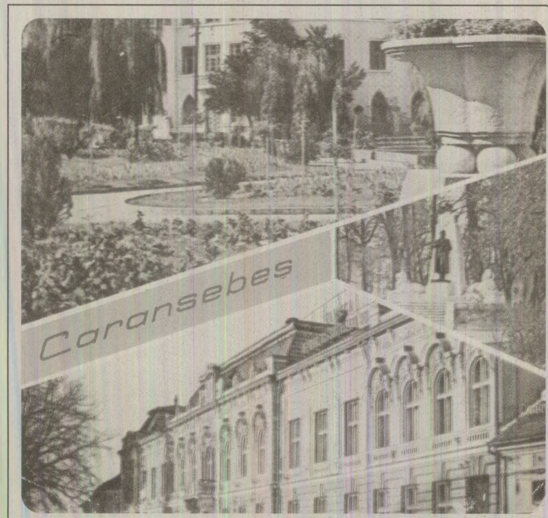
Ilustrată tipărită de OSEDȚ și difuzată de Poșta Română